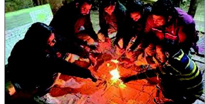
રાજકોટ, રાજકોટ શહેરમાં બે દીવસ તાપમાન સિંગલ ડીગ્રીમાં નોંધાતા શહેરીજનો ઠંડીમાં હૂંફવાઈ રહ્યા છે. રાત્રિના ઠેર ઠેર સ્થળે તાપમાન શૂન્ય થયું છે. રાજકોટ શહેરમાં ૧૧.૪ ડીગ્રી તાપમાન નોંધાયેલ છે. ઠાર અને ફૂંકાતા ઠંડા પવનના કારણે ઠંડીની અસર વધુ વર્તાઈ રહી છે. લોકો ગરમ વસ્ત્રોમાં જ ઊંચવા મળી રહ્યા છે. ખાસ કરીને સવારે અને રાત્રીના ઠંડીની અસર વધુ જોવા મળી રહી છે. કડકડતી ઠંડીના પગલે ઘેલેલી સવારે શાળાએ જતાં વિદ્યાર્થીઓ અને ધંધાદારીઓને ભારે પરેશાનીનો સામનો કરવો પડ્યો હતો. હવામાન ખાતાના સુત્રો

ગિરનાર ઉપર ૭, કચ્છના નલીયામાં ૭.૫, જામનગરમાં ૧૪ ડીગ્રી લઘુત્તમ તાપમાન