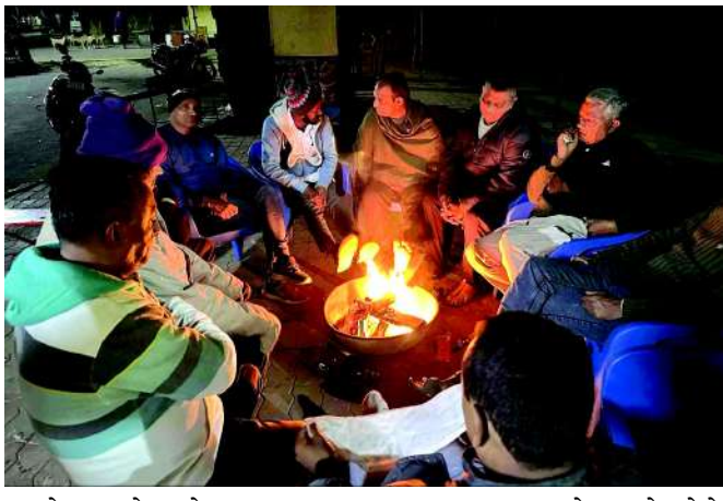
આજે સવારે શહેરના મુખ્યમ માર્ગો મોડે સુધી સુમસામ જોવા મળતા હતા. ત્યારે સવારે સ્કૂલે જતાં બાળકો પણ રંગબેરંગી ગરમ

મિલાપ રૂપારેલ અમરેલી, અમરેલી શહેર સહિત સમગ્ર જિલ્લામાં છેલ્લા એક અઠવાડિયાથી કોલ્ડવેવની અસર હોય ભારે પવન સાથે કડકડતી ઠંડીમાં લોકો હુંહવાયા છે. ત્યાંહરે આજે વહે?લી સવારે અમરેલી જિલ્લામાં ચાલું સિઝનમાં ફરી એક વખત ઠંડીમાં નોંધપાત્ર વધારો જોવા મળ્યો છે. આજે અમરેલી ૯ ડિગ્રી જેટલું નીચું તાપમાન તાપમાન નોંધાયું છે. અમરેલી શહેર સહિત જિલ્લામાં છેલ્લા ઘણાં દિવસથી ઠંડી પડી રહી છે. ઠંડીના કારણે