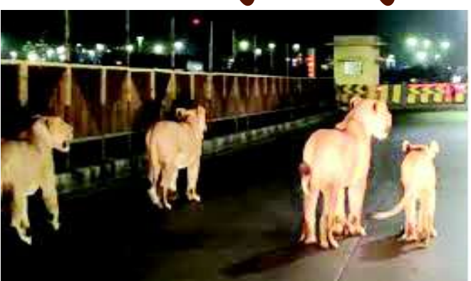
એરપોર્ટમાં રાત્રીના સમયે દીપડો હોવા અંગેનો વીડિયો પણ સોશયલ મીડિયામાં વાયરલ થયો હતો. આ વીડિયોમાં દીપડો દીવાલ ઠેકીને ભાગતો જોવા મળ્યો હતો. ત્યારે અમરેલીના

મિલાપ રૂપારેલ અમરેલી જિલ્લામાં અમરેલી જિલ્લામાં ખીર વિસ્તાર આવતો હોય જેને ઘઈ અમરેલી જિલ્લામાં સૌથી વધુ સિંહ પરિવારનો વસવાટ હોય જેને ઘઈ આ સિંહ વન વિસ્તાર છોડી માનવ વસ્તી આજુબાજુ પણ હવે વસવાટ કરી રહ્યાં છે. ત્યારે અમરેલી શહેર વિસ્તારમાં હવે દીપડાના આંટાફેરા વધી જતાં અને દીપડાના આંટાફેરા અંગેના મેસેજ સોશયલ મીડિયામાં વાયરલ થતાં શહેરીજનોમાં ભયનું લખલખુ પ્રસરી જવા પામેલ છે. અમરેલી શહેરના કીમ વિસ્તાર ગણાતાં ચિતલ રોડ ઉપર થોડા દિવસ પહેલાં અમરેલીના