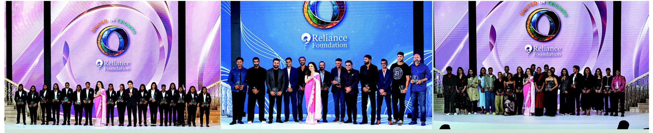
અત્યંત ભાવસભર અભિવ્યક્તિ સાથે જ્યારે જીવનમાં સામા પાણીએ તરીને પણ કુદરત સાથે તાલ મિલાવતી પ્રબળ ઈચ્છાશક્તિ અને વિજયી મુદ્રા અને મિજાજનો જ્યારે સંગમ સર્વજય ત્યારે એ અદ્ભુત દ્રશ્યોની નાની ઝાંખી પણ ઓછા શબ્દો સાથે એક નવલકથા બની જાય છે. ભારતીય પ્રજ્ઞાચક્ષુ મહિલાઓની વિજેતા ટીમ, આઈસીસી વર્લ્ડ ટી ટ્વેન્ટી ચેમ્પિયન ભારતીય ટીમની કેટલીક ખેલાડીઓ અને આઈસીસી વિમેન્સ ક્રિકેટ વર્લ્ડ કપ વિજેતા ટીમ સાથે નીતા અંબાણી, અમિતાભ બચ્ચન, સચિન તેંડુલકર અને આઈસીસી ચેરમેન શ્રી જય શાહની આ તસ્વીર મુંબઈમાં યુનાઈટેડ ઈન ટ્રાયમ્ફ ઈવેન્ટમાં આ ત્રિવેણી મૂડ અને વુસ્તાની ગવાહી આપે છે.