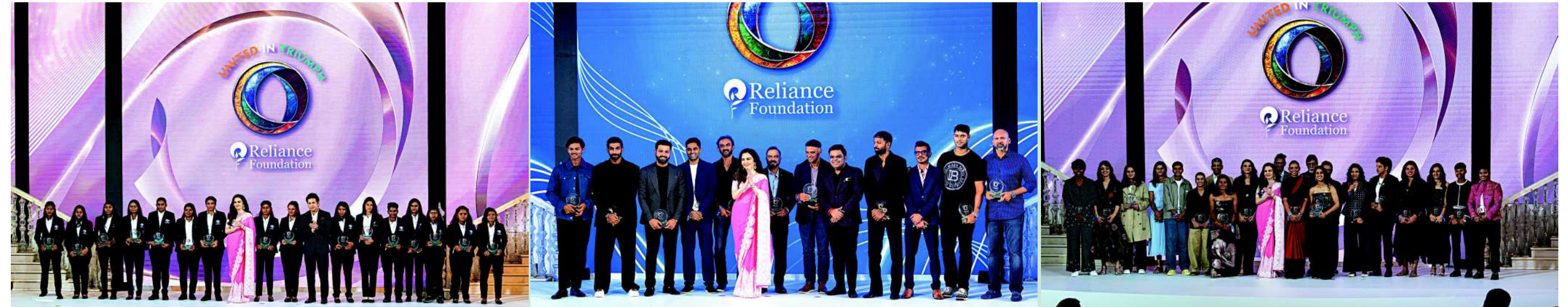
અત્યંત ભાવસભર અભિવ્યક્તિ સાથે જ્યારે જીવનમાં સામા પાણીએ તરીને પણ કુદરત સાથે તાલ મિલાવતી પ્રબળ ઈચ્છાશક્તિ અને વિજયી મુદ્રા અને મિજાજનો જ્યારે સંગમ સર્વજય ત્યાહે એ અલ્હુત દ્રશ્યોની નાની ઝાંખી પણ ઓછા શબ્દો સાથે એક નવલકથા બની જાય છે. ભારતીય પ્રજ્ઞાચક્ષુ મહિલાઓની વિજેતા ટીમ, આઈસીસી વર્લ્ડ ટી ટ્વેન્ટી ચેમ્પિયન ભારતીય ટીમની કેટલીક ખેલાડીઓ અને આઈસીસી વિમેન્સ ક્રિકેટ વર્લ્ડ કપ વિજેતા ટીમ સાથે નીતા અંબાણી, અમિતાભ બચ્ચન, સચિન તેંડુલકર અને આઈસીસી ચેરમેન શ્રી જય શાહની આ તસ્વીર મુંબઈમાં યુનાઈટેડ ઈન ટ્રાયમ્ફ ઈવેન્ટમાં આ ત્રિવેણી મૂડ અને વુસ્તાની ગવાહી આપે છે.