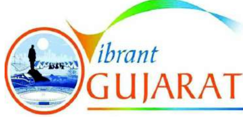
Vibrant Gujarat Global Summit 2026 in Ahmedabad

સૌરાષ્ટ્રના પાટનગર એવા રાજકોટ ખાતે આગામી તા.૧૧ જાન્યુ.થી બે દિવસ યોજનાર રીજીયોનલ વાઈબ્રન્ટ સમીટ ૨૦૨૬ની તૈયારીઓને હવે અંતિમ તબક્કામાં પહોંચી જવા પામી છે. આ વાઈબ્રન્ટ સમીટનું વડાપ્રધાન શ્રી નરેન્દ્ર મોદીના હસ્તે ઉદ્ઘાટન કરવામાં આવનાર છે.