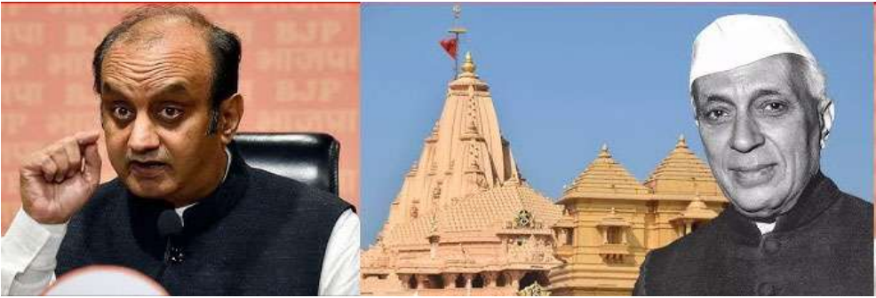
મંદિરની મુલાકાતની અસરને 'ઓછી આંકવાનો પ્રયાસ' કર્યો હતો, જે સ્પષ્ટપણે દર્શાવે છે કે તેઓ ફક્ત તટસ્થ રહેવાને બદલે, મંદિરના ઉદ્ઘાટનની આસપાસના મહત્વ અને ચર્ચાને ઈરાદાપૂર્વક ઘટાડવાનો પ્રયાસ કરી રહ્યા હતા. પાકિસ્તાનમાં ભારતના રાજદૂતને લખેલા પત્રમાં, પંડિત નેહરુએ સોમનાથ મંદિરના પવિત્ર વિધિ માટે સિંધુ નદીના પાણીના ઉપયોગને ઔપચારિક રીતે નકારી કાઢ્યો હતો, વિદેશ સચિવ દ્વારા જણાવવામાં આવ્યું હતું કે તેમને વિનંતી મંજૂર નથી, અને આદેશ આપ્યો હતો કે આવી કોઈપણ વિનંતીઓને અગાઉથી મંજૂર કરવામાં આવે, જેનાથી ભારત સરકાર સમારોહથી દૂર રહી શકે અને તેનું પ્રતીકાત્મક મહત્વ ઓછું કરી શકે."