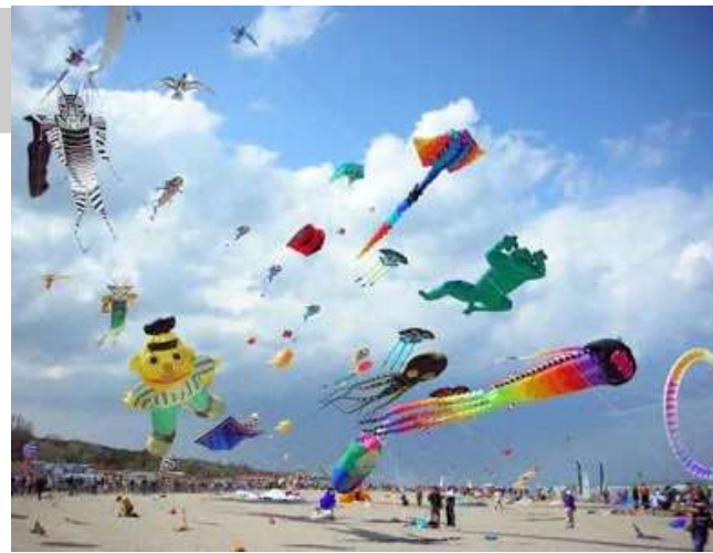
રાખવામાં આવી છે, જેમાં તેમને પતંગ બનાવવાની અને પતંગ ઉડાડવાની તકનીકો શીખવવામાં આવશે. આ મહોત્સવ ૧૦ જાન્યુઆરીથી ૧૪ જાન્યુઆરી, ૨૦૨૬ સુધી ચાલશે.

સાથે જ ભારતના પરંપરાગત પતંગ ઉત્પાદકો પણ તેમની કળાનું પ્રદર્શન કરશે, જેનાથી આકાશનો નજારો જોવા જેવો હશે. આ સુંદર પતંગોથી આકાશ ભરી દેશે અને એક અદ્ભુત દેશ જોવા મળશે. પતંગબાજો સિવાય અહીં અનેક સાંસ્કૃતિક કાર્યક્રમોની પણ મજા માણી શકાશે. લોક સંગીત અને નૃત્યના પર્ફોર્મન્સની સાથે હેન્ડિક્રાફ્ટ પ્રદર્શન અને લોકલ ફૂડ સ્ટોલ્સ પણ હશે, જ્યાં તમે ગુજરાતી વાનગીઓનો સ્વાદ માણી શકશો. બાળકો માટે ખાસ વર્કશોપ