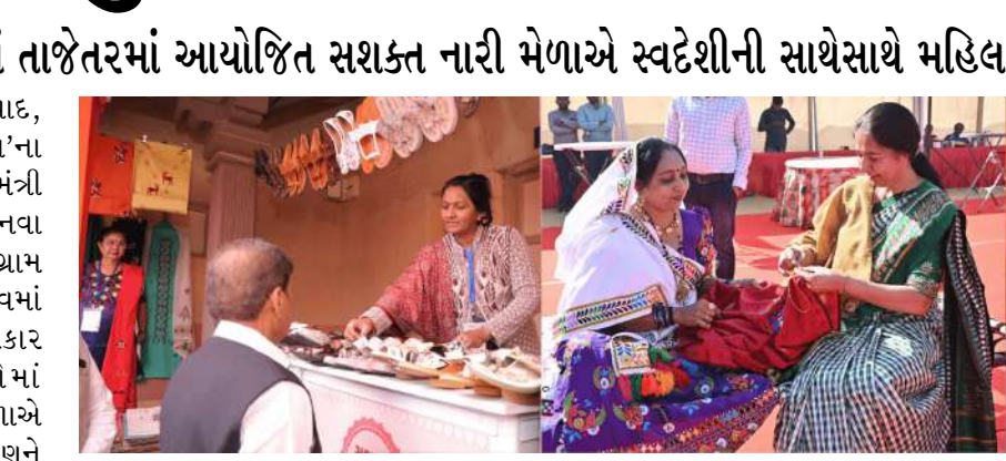
યોજનાને નવી દિશા આપી છે. રાજ્યના ગ્રામ વિકાસ વિભાગ અંતર્ગત ગુજરાત લાઈવલીહૂડ પ્રમોશન કંપની લિમિટેડ જીએલપીસી દ્વારા ગત તા. ૧૮

ગુજરાતના ૩૧ જિલ્લાઓમાં તાજેતરમાં આયોજિત સશક્ત નારી મેળાએ સ્વદેશીની સાથેસાથે મહિલા સશક્તીકરણને પણ ઉજાગર કરી અમદાવાદ, વડાપ્રધાનના 'આત્મનિર્ભર ભારત'ના સ્વપ્નને સાકાર કરવા ગુજરાતમાં મુખ્યમંત્રી ભૂપેન્દ્ર પટેલના નેતૃત્વમાં અનેકવિધ નવા સ્વદેશી પ્રકલ્પો શરૂ કરવામાં આવ્યા છે. ગ્રામ વિકાસ મંત્રી કુંવરજી બાવળીયાના નેતૃત્વમાં 'આત્મનિર્ભર ભારત'ના સ્વપ્નને સાકાર કરવા ગુજરાતના ૩૧ જિલ્લાઓમાં તાજેતરમાં આયોજિત સશક્ત નારી મેળાએ સ્વદેશીની સાથેસાથે મહિલા સશક્તીકરણને પણ ઉજાગર કરી છે. આ જિલ્લાઓમાં આયોજિત નારી મેળા દ્વારા રૂ. ૪.૧૦ કરોડની કિંમતની સ્વદેશી ઉત્પાદનોનું વેચાણ કરીને 'વન ડિસ્ટ્રીક્ટ, વન પ્રોડક્ટ'