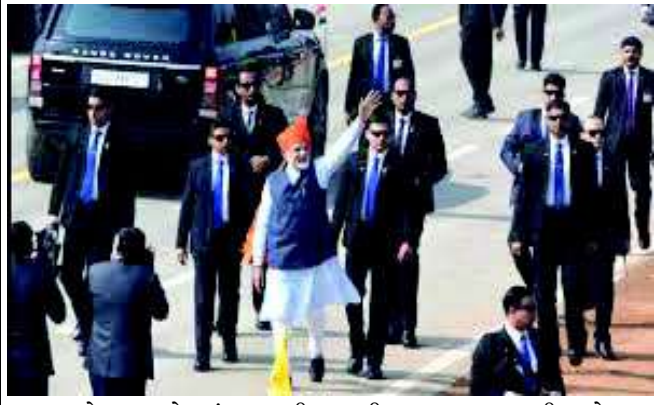
રાજકોટ: રાજકોટમાં આગામી તારીખ ૧૧ જાન્યુઆરી અને ૧૨