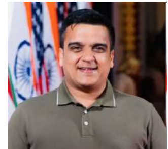
કાર્યક્રમનો મુખ્ય હેતુ લોકોમાં પ્રવર્તતી અંધશ્રદ્ધા દૂર કરી, વધુમાં વધુ લોકો અંગદાનના શય્ય લે તે માટે પ્રોત્સાહિત કરવાનો છે. જન્મદિવસને વ્યક્તિગત હરખ નહીં પરંતુ સામાજિક જવાબદારી ગણાવતા નાયબ મુખ્યમંત્રી હર્ષ સંઘવીએ જન્મદિવસની

ગાંધીનગર, અંગદાન ચેરિટેબલ ટ્રસ્ટ દ્વારા નાયબ મુખ્યમંત્રી હર્ષ સંઘવીના ૪૧મો જન્મદિવસની ઉજવણીનો પ્રારંભ એક ઉમદા અને માનવીય અભિગમ સાથે કરવામાં આવ્યો છે. આ ઉજવણી અંતર્ગત અંગદાન અંગે લોકજાગૃતિ કેળવવા ગાંધીનગર ખાતે નાયબ મુખ્યમંત્રીના હસ્તે વિદ્યાર્થીઓને 'અંગદાન મહાદાન' અંકિત ૫, ૪૪૧ પતંગોનું વિતરણ કરવામાં આવ્યું હતું. આ પ્રસંગે અંગદાન અંગે લોકજાગૃતિ કેળવવાની દિલ્હીપ દેશમુખ અને તેમની ટીમની આ સરાહનીય પહેલની નાયબ મુખ્યમંત્રીએ પ્રશંસા કરી હતી. આ