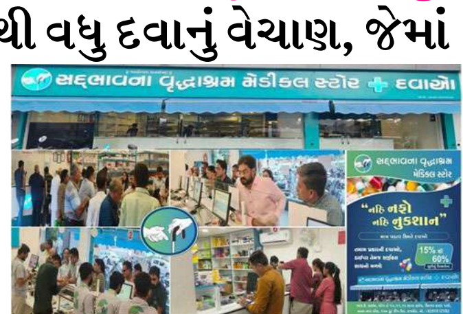
સદભાવના વૃદ્ધાશ્રમ મેડીકલ સ્ટોર દ્વારા પડતર કિંમતે દવા અને સર્જકલ સાધનોનું વેચાણ કરતો એક સદભાવના વૃદ્ધાશ્રમ મેડીકલ સ્ટોર શરૂ કરવો એવો નિર્ધાર કર્યો અને ૨૪ મહિના

અત્યાર સુધીમાં ૪૦ કરોડથી વધુ દવાનું વેચાણ, જેમાં ૧૦ કરોડથી વધુ ડિસ્કાઉન્ટ અપાય છે, એટલે કે સદભાવના વૃદ્ધાશ્રમ મેડીકલ સ્ટોર દર્દીનારાયણ, દરિદ્ર નારાયણની સેવા માટે ભગીરથ કાર્ય કરવામાં નિમિત્ત બન્યું છે. ૬૦ લોકોનો સ્લાફ કાર્યરત છે, દર મહિને ૩૦ હજાર જેટલા દર્દીઓ લાભ લ્યે છે. અત્યાર સુધીમાં ૪૦ કરોડથી વધુ વેચાણ, જેમાં ૧૦ કરોડથી વધુ ડિસ્કાઉન્ટ આપેલ છે. સદભાવના વૃદ્ધાશ્રમ મેડિકલ સ્ટોર (રાજકોટ) દ્વારા ડિસેમ્બર - ૨૦૨૫, માત્ર એક મહિના માં ચાર કરોડ ની કિંમતની દવા મૂળ ભાવે ત્રણ કરોડ માં આપી એક કરોડ રૂપિયા નું ડિસ્કાઉન્ટ દર્દીઓને આપવામાં આવ્યું છે.