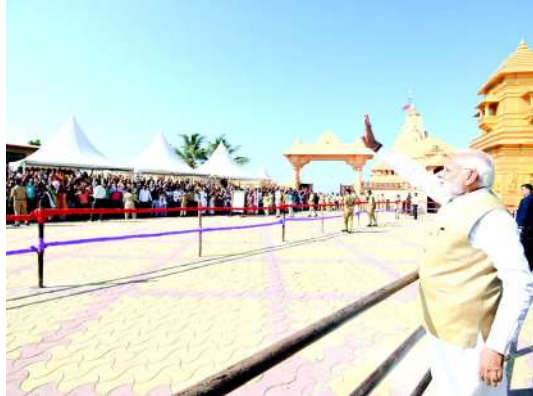
એક વિશાળ જનસભાને સંબોધન કરી દેશવાસીઓને સાંસ્કૃતિક એકતાનો સંદેશ આપશે.

રાજકોટ: ગુજરાત સરકારના પ્રવક્તા મંત્રી જીતુભાઈ વાઘાણી જણાવ્યું હતું કે સોમનાથ ખાતે આગામી ૮ થી ૧૧ જાન્યુઆરી દરમિયાન ભવ્ય "સોમનાથ સ્વાભિમાન પર્વ" ની ઉજવણી કરવામાં આવશે. જ્યારે પીએમ મોદી ૧૦ મી જાન્યુઆરીએ સાંજે ૫.૩૦ કલાકે સોમનાથ આવશે. વડાપ્રધાન ૧૧ જાન્યુઆરીના રોજ ભગવાન સોમનાથના દર્શન-અર્ચન કરીને આ પર્વમાં સહભાગી થશે. આ પર્વના મુખ્ય આકર્ષણો અંગે મંત્રી વાઘાણીએ જણાવ્યું હતું કે, સોમનાથ સ્વાભિમાન પર્વ દરમિયાન આકાશમાં ૩૦૦૦ ડ્રોન દ્વારા સોમનાથના ઇતિહાસ અને ભવ્યતાને દર્શાવતો અત્યાર સુધીનો સૌથી મોટો ડ્રોન-શો યોજાશે.