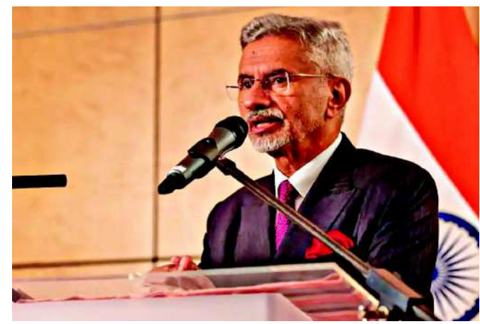
લોકોને આ કહેતા સાંભળ્યો છો, જેમ ઓપરેશન સિદ્ધર દરમિયાન થયું હતું. હવે, જો તમે તેમને પૂછો, 'ખરેખર, શું તમે ચિંતિત

નવીદિલ્હી, ભારતના વિદેશ મંત્રી ડો. એસ. જયશંકરે બુધવારે લક્ઝમબર્ગમાં વેનેઝુએલામાં તાજેતરના વિકાસ પર ઊંડી ચિંતા વ્યક્ત કરી. તેમણે તમામ પક્ષોને યુએસ લશ્કરી કાર્યવાહી અને ત્યારબાદના કટોકટી વચ્ચે વેનેઝુએલાના લોકોની સુખાકારી અને સલામતીને સર્વોચ્ચ પ્રાથમિકતા આપવા વિનંતી કરી. એસ. જયશંકરે લક્ઝમબર્ગની તેમની મુલાકાત દરમિયાન આ નિવેદન આપ્યું હતું, જ્યાં તેમણે નાયબ વડા પ્રધાન અને વિદેશ પ્રધાન સાથે દ્વિપક્ષીય સંબંધો પર ચર્ચા કરી હતી. ભારતે અગાઉ વેનેઝુએલા અંગે એક સત્તાવાર નિવેદનમાં જણાવ્યું હતું કે તે પરિસ્થિતિ પર નજીકથી નજર રાખી રહ્યું છે અને તેના લોકોની સલામતીને પ્રાથમિકતા આપી રહ્યું છે. જયશંકરે કહ્યું, "ભારત તાજેતરના વિકાસ અંગે ચિંતિત છે. અમે તમામ સંબંધિત પક્ષોને સાથે બેસીને એવી પરિસ્થિતિ પર કામ કરવા હાકલ કરીએ છીએ જે વેનેઝુએલાના લોકોના કલ્યાણ અને સલામતીના શ્રેષ્ઠ હિતમાં હોય." તેમણે એ પણ યાદ કરાવ્યું કે ભારતના વેનેઝુએલા સાથે લાંબા સમયથી ગાઢ સંબંધો છે અને ત્યાંના લોકો આ કટોકટીમાંથી ઝડપથી બહાર આવે અને સફળ રિકવરી ઈચ્છે છે. જયશંકરે એમ પણ કહ્યું, "આજના સમયમાં, દેશો તે કરશે જે તેમને સીધો ફાયદો કરે છે. તેઓ તમને મક્કત સલાહ આપશે. જો કંઈક થાય છે, તો તેઓ કહેશે, 'કૃપા કરીને આ ન કરો.' જો તણાવ હોય, તો અમે ચિંતિત છીએ. ક્યારેક તમે