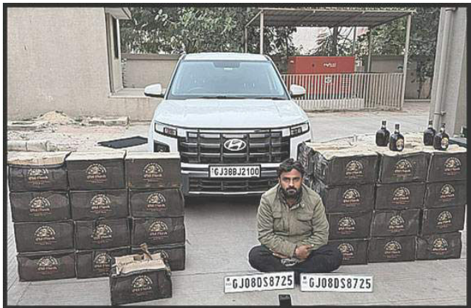
રાજકોટ, રાજકોટના મોરબી હાઈવે રતનપર ગામ પાસેથી કાર્થમ બ્રાંચની ટીમે રૂ. ૬૧ લાખનો ૪૩૨ બોટલ વિદેશી દારૂ ભરેલી કાર સાથે ચાલકની ધરપકડ કરી રૂ. ૧૫.૬૬ લાખનો મુદ્દામાલ કબજે કર્યો હતો. આ દરોહમાં દારૂ મંગાવનાર નામચીન બુટલેગર સહીત ત્રણ શખ્સોના નામ ખુલ્યા છે.

કાર્થમ બ્રાંચની ટીમે રૂ. ૬૧લાખનો ૪૩૨ બોટલ વિદેશી દારૂ ભરેલી કાર જમ કરી