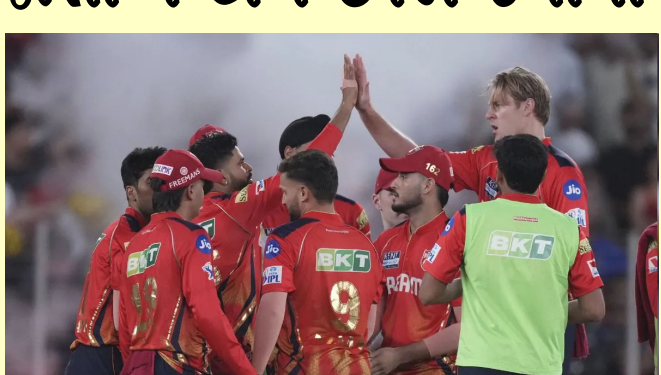
મુંબઈ, આઈપીએલ ૨૦૨૬ પહેલા પંજાબ કિંગ્સ કેન્ચાઈઝને મોટો ઝટકો લાગ્યો છે. ગયા સીઝનમાં કેન્ચાઈઝની સફળતામાં મુખ્ય ભૂમિકા ભજવનાર સ્પિન બોલિંગ કોચ સુનીલ જોશીએ હવે ટીમ છોડવાનો નિર્ણય લીધો છે. નોંધનીય છે કે પંજાબ કિંગ્સની ટીમ ૧૪ વર્ષ પછી આઈપીએલ ફાઈનલમાં પહોંચી હતી. મુખ્ય કોચ રિકી પોન્ટિંગ અને તેમના કોચિંગ સ્ટાફ ટીમને ફાઈનલમાં પહોંચાડવામાં મહત્વપૂર્ણ ભૂમિકા ભજવી હતી. સુનીલ જોશી તે કોચિંગ સ્ટાફનો મુખ્ય ભાગ હતા. જોકે, તેમણે આગામી સીઝન પહેલા ટીમ છોડવાનો નિર્ણય

લીધો છે, જે પંજાબ કિંગ્સ કેન્ચાઈઝ માટે મોટો ફટકો છે. ક્રિકેટના રિપોર્ટ મુજબ, સુનીલ જોશી બીસીસીઆઈના સેન્ટર ઓફ એક્સેલન્સમાં કામ કરી શકે છે. સુનીલ જોશીએ પંજાબ કિંગ્સ કેન્ચાઈઝને તેમના નિર્ણયની જાણ કરી હતી. જોકે, સેન્ટર ઓફ એક્સેલન્સમાં સુનીલ જોશીની ભૂમિકા અંગે હજુ સુધી કોઈ સત્તાવાર અહેવાલ બહાર પાડવામાં આવ્યો નથી. નોંધનીય છે કે સુનીલ જોશી અગાઉ આઈપીએલ ૨૦૨૦ થી ૨૦૨૨ સુધી પંજાબ ટીમના સભ્ય તરીકે સેવા આપી ચૂક્યા છે. જ્યારે રિકી પોન્ટિંગ આઈપીએલ ૨૦૨૫ પહેલા ટીમના મુખ્ય કોચ બન્યા, ત્યારે પંજાબ કેન્ચાઈઝીએ તેમને ટીમ સાથે બીજા કાર્યકાળની ઓફર કરી. સુનીલ જોશીએ ૧૯૯૬ થી ૨૦૦૧ દરમિયાન ભારત માટે ૧૫ ટેસ્ટ અને ૬૯ વનડે રમી હતી, જેમાં કુલ ૧૧૦ વિકેટ લીધી હતી. તેમની પાસે ૪૧ ટેસ્ટ વિકેટ અને ૬૯ વનડે વિકેટ છે. તેમણે થોડા સમય માટે ઉત્તર પ્રદેશ રાજ્ય ટીમના મુખ્ય કોચ તરીકે પણ સેવા આપી હતી. તેમણે ટીમ ઈન્ડિયાના મુખ્ય પસંદગીકાર તરીકે પણ સેવા આપી છે.