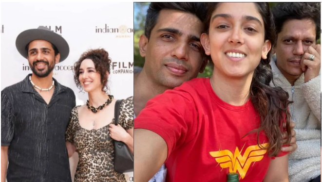
મુંબઈ, કંતારા, કમાન્ડો અને હેટ સ્ટોરી જેવી ફિલ્મોમાં પોતાના શક્તિશાળી અભિનય માટે પ્રશંસા મેળવનાર અભિનેતા ગુલશન દેવેયા ફરીથી પ્રેમમાં છે. ગુલશનના લગ્ન ૨૦૧૨ માં થયા અને ૨૦૨૦ માં છૂટાછેડા થયા. પરંતુ છૂટાછેડા પછી થોડા સમય પછી, ગુલશન ફરીથી પ્રેમમાં પડ્યો. આશ્ચર્યજનક રીતે, તે તેની ભૂતપૂર્વ પત્ની સાથે પ્રેમમાં પડી ગયો છે અને છૂટાછેડા પછી ફરીથી તેની સાથે ડેટિંગ કરી રહ્યો છે. ગુલશને તાજેતરમાં આ વાતનો પુલાસો કર્યો. તમન્ના ભાટિયા અને વિજય વર્માના નજીકના મિત્ર ગુલશને અગાઉ તેમના સંબંધોનો પુલાસો કર્યો હતો. હવે, ગુલશને તાજેતરમાં પુલાસો કર્યો કે તે તેની ભૂતપૂર્વ પત્નીને ડેટ કરી રહ્યો છે. ચાલો જાણીએ કે ગુલશનની ભૂતપૂર્વ પત્ની કોણ છે, જેની ટ્રીક સુંદરતાએ ગુલશનને ફરીથી સ્તબ્ધ કરી દીધો છે. ગુલશન દેવેયાએ અનુરાગ કશ્યપની ૨૦૧૦ ની ફિલ્મ "ધ ગર્લ ઈન યલો બૂટ" થી પોતાની કારકિર્દીની શરૂઆત કરી. આ ફિલ્મે તેમને નોંધપાત્ર ઓળખ અને