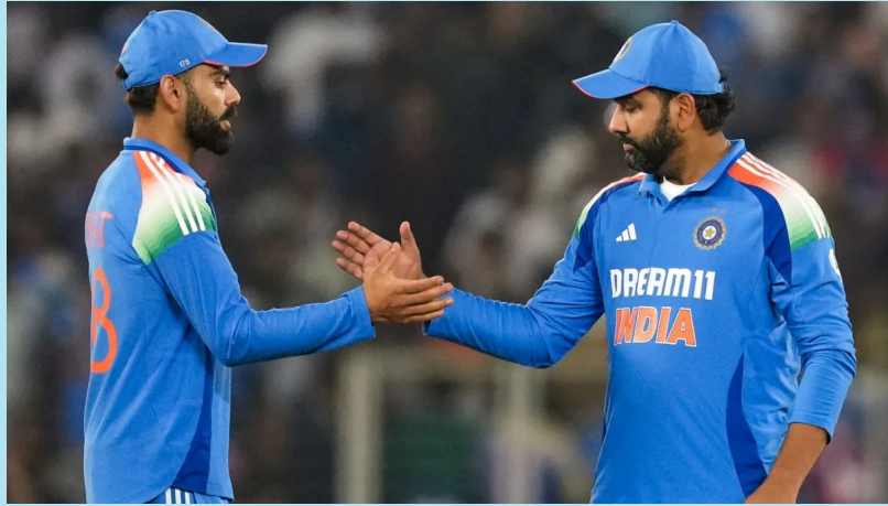
સામે પ્રથમ વનડે રમ્યા પછી જ રેક્રિંગ અને રેટિંગ બદલાશે. પૂર્વ ભારતીય કેપ્ટન રોહિત શર્મા હાલમાં આસીસી વનડે રેક્રિંગમાં નંબર વન બેટ્સમેન છે. તેમનું રેટિંગ હાલમાં ૭૮૧ છે. રોહિત શર્માએ તાજેતરમાં રેક્રિંગમાં નંબર વન સ્થાન પાછું મેળવ્યું, પછી એક અઠવાડિયા માટે નીચે આવ્યું, પરંતુ પછી સ્વસ્થ થઈને ત્યાં જ રહ્યું. દરમિયાન, વિરાટ કોહલીનું રેટિંગ ૭૮૧ છે.

નવીદિલ્હી, ભારત અને ન્યુઝીલેન્ડની ટીમો ૧૧ જાન્યુઆરીએ વનડે શ્રેણીની પહેલી મેચમાં ટકરાશે. મેચ દૂર નથી, ફક્ત થોડા દિવસો બાકી છે. સદનસીબે, પહેલી મેચ રવિવારે છે, તેથી તમે તેને આરામથી જોઈ શકો છો. દરમિયાન, શ્રેણી શરૂ થાય તે પહેલાં, બે ભૂતપૂર્વ ભારતીય કેપ્ટન, વિરાટ કોહલી અને રોહિત શર્મા માટે વર્તમાન આઈસીસી વનડે રેક્રિંગ શોધો. જાન્યુઆરી ૨૦૨૬ માં હજુ સુધી કોઈ વનડે મેચ રમાઈ નથી. આ વર્ષ, ૨૦૨૬ માં હજુ સુધી કોઈ વનડે મેચ રમાઈ નથી. આઈસીસીએ છેલ્લે ૬ ડિસેમ્બર, ૨૦૨૫ ના રોજ વનડે રેક્રિંગ અપડેટ કર્યું હતું, અને ત્યારથી તે યથાવત છે. ૧૧ જાન્યુઆરીએ રોહિત શર્મા અને વિરાટ કોહલી ન્યુઝીલેન્ડ સામે પ્રથમ વનડે રમ્યા પછી જ રેક્રિંગ અને રેટિંગ બદલાશે. પૂર્વ ભારતીય કેપ્ટન રોહિત શર્મા હાલમાં આસીસી વનડે રેક્રિંગમાં નંબર વન બેટ્સમેન છે. તેમનું રેટિંગ હાલમાં ૭૮૧ છે. રોહિત શર્માએ તાજેતરમાં રેક્રિંગમાં નંબર વન સ્થાન પાછું મેળવ્યું, પછી એક અઠવાડિયા માટે નીચે આવ્યું, પરંતુ પછી સ્વસ્થ થઈને ત્યાં જ રહ્યું. દરમિયાન, વિરાટ કોહલીનું રેટિંગ ૭૮૧ છે. રોહિત શર્માએ તાજેતરમાં રેક્રિંગમાં નંબર વન સ્થાન પાછું મેળવ્યું, પછી એક અઠવાડિયા માટે નીચે આવ્યું, પરંતુ પછી સ્વસ્થ થઈને ત્યાં જ રહ્યું. દરમિયાન, વિરાટ કોહલીનું રેટિંગ ૭૮૧ છે.