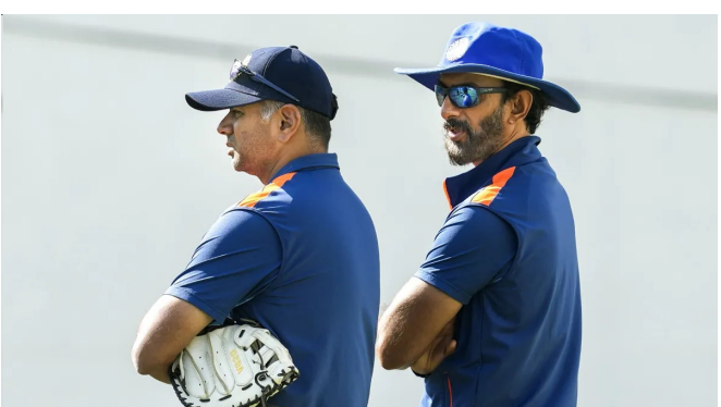
નિમણૂકનો સમાવેશ થાય છે. શ્રીલંકા ક્રિકેટ આગામી ટી ૨૦ વર્લ્ડ કપ ૨૦૨૬ માટે વિક્રમ રાઠોડને ટીમના બેટિંગ કોચ તરીકે નિમણૂક કરવાનો નિર્ણય લીધો છે. હાલમાં, રાઠોડ આઈપીએલમાં રાજસ્થાન રોયલ્સ કોચિંગ સેટઅપનો ભાગ છે, સહાયક કોચ તરીકે સેવા આપી રહ્યા છે. તે

નવીદિલ્હી, ભારત અને શ્રીલંકા દ્વારા સંયુક્ત રીતે યોજાતો આઈસીસી ટી ૨૦ વર્લ્ડ કપ ૭ ફેબ્રુઆરીથી શરૂ થશે, જેમાં કુલ ૨૦ ટીમો ભાગ લેશે. શ્રીલંકા શુપ્ત બીમાં સ્થાન મેળવ્યા પછી, ઘરેલુ મેદાન પર તેની શુપ્ત સ્ટેજ મેચ રમશે. શ્રીલંકન ટીમ ૮ ફેબ્રુઆરીએ આયર્લેન્ડ સામે તેની પહેલી મેચ રમશે. શ્રીલંકા ક્રિકેટ ટુર્નામેન્ટ માટે પોતાની પ્રોવિઝનલ ટીમની જાહેરાત કરી છે અને ટુર્નામેન્ટ શરૂ થાય તે પહેલાં તે તેની અંતિમ ૧૫ સભ્યોની ટીમની જાહેરાત કરશે. દરમિયાન, શ્રીલંકા ક્રિકેટ તેના કોચિંગ સેટઅપ અંગે એક મોટો નિર્ણય લીધો છે, જેમાં ટીમ ઈન્ડિયાના ભૂતપૂર્વ ખેલાડી વિક્રમ રાઠોડની નિમણૂકનો સમાવેશ થાય છે. શ્રીલંકા ક્રિકેટ આગામી ટી ૨૦ વર્લ્ડ કપ ૨૦૨૬ માટે વિક્રમ રાઠોડને ટીમના બેટિંગ કોચ તરીકે નિમણૂક કરવાનો નિર્ણય લીધો છે. હાલમાં, રાઠોડ આઈપીએલમાં રાજસ્થાન રોયલ્સ કોચિંગ સેટઅપનો ભાગ છે, સહાયક કોચ તરીકે સેવા આપી રહ્યા છે. તે