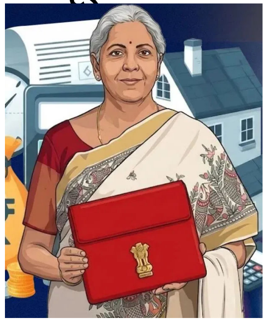
મૂળભૂત મુક્તિ મર્યાદા ૪ લાખ સુધી વધારવા જેવા નિર્ણયોએ નવી વ્યવસ્થાને મજબૂત બનાવી. જો કે, આ ઝગમગાટ વચ્ચે, જેઓ હજુ પણ "જૂની કર વ્યવસ્થા" પર આધાર રાખે છે તેઓ છેતરાયા હોવાનું અનુભવે છે.

દર વર્ષે, ફેબ્રુઆરી મહિને નજીક આવતાની સાથે, દેશભરના લાખો રોજગાર મેળવનારા અને મધ્યમ વર્ગના પરિવારો એક જ વસ્તુ પર ધ્યાન કેન્દ્રિત કરે છે: નાણામંત્રીનું બજેટ ભાષણ. ૧ ફેબ્રુઆરી, ૨૦૨૬ ના રોજ રજૂ થનાર મોદી સરકાર ૩.૦ નું ત્રીજું પૂર્ણ બજેટ ફક્ત આંકડાઓની ગણતરી નથી, પરંતુ એક દસ્તાવેજ છે જે સામાન્ય માણસના ખિસ્સા અને તેની બચતનું ભવિષ્ય નક્કી કરે છે. આ વર્ષનું કેન્દ્રીય બજેટ (૨૦૨૬-૨૭) ખૂબ જ ખાસ અને ઐતિહાસિક માનવામાં આવે છે. તેનું સૌથી મોટું કારણ એ છે કે તે વર્તમાન આવકવેરા કાયદા હેઠળ રજૂ કરાયેલ છેલ્લું પૂર્ણ બજેટ હશે. સરકાર ૧ એપ્રિલ, ૨૦૨૬ થી લગભગ ૬૦ વર્ષ જૂના કર કાયદાઓને બદલીને નવો 'આવકવેરા કાયદો ૨૦૨૫' લાગુ કરવાની તૈયારી કરી રહી છે. આમ, આ બજેટ ફક્ત વર્તમાન જરૂરિયાતોને પૂર્ણ કરશે નહીં પરંતુ ભવિષ્યની કર પ્રણાલીનો પાયો પણ નાખશે. ચાલો જાણીએ કે આ વખતે કરદાતાઓ નાણામંત્રી પાસેથી કઈ પાંચ મોટી રાહતોની અપેક્ષા રાખી શકે છે. ગયા વર્ષે, બજેટ ૨૦૨૫ માં, સરકારે "નવી કર વ્યવસ્થા" ને આકર્ષક ગણાવીને હેડલાઈનમાં સ્થાન મેળવ્યું હતું. ૧૨ લાખ સુધીની આવકને કરમુક્ત બનાવવા અને