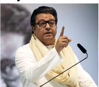
મહારાષ્ટ્ર નવનિર્માણ સેનાના રાજ ઠાકરેએ હિન્દુ-મરાઠી

મુંબઈ, બુહનું બઈ મ્યુનિસિપલ કોર્પોરેશન (બીએમસી) સહિત મહારાષ્ટ્રમાં ૨૯ મ્યુનિસિપલ કોર્પોરેશનોની ચૂંટણી માટે રાજકીય પક્ષો પોતાનો પ્રચાર ચાલુ રાખી રહ્યા છે. બધા રાજકીય પક્ષો જનતાને સંબોધિત કરી રહ્યા છે અને વિવિધ વચનો આપી રહ્યા છે અને એકબીજા વિરુદ્ધ ઉગ્ર નિવેદનબાજ કરી રહ્યા છે. આ સંદર્ભમાં, એમએનએસ વડા રાજ ઠાકરે અને શિવસેના યુબીટી વડા ઉદ્ધવ ઠાકરેએ પાર્ટીના મુખપત્ર, સામાનાને એક ઈન્ટરવ્યુ આપ્યો હતો. આ ઈન્ટરવ્યુમાં, શિવસેના યુબીટી સાંસદ સંજય રાઉતે રાજ ઠાકરે અને ઉદ્ધવ ઠાકરેને અનેક પ્રશ્નો પૂછ્યા. ઈન્ટરવ્યુ દરમિયાન, રાજ ઠાકરેએ કહ્યું કે તેઓ મંદિરમાં માથું નમાવશે પણ ગંગાનું પાણી પીશે નહીં.