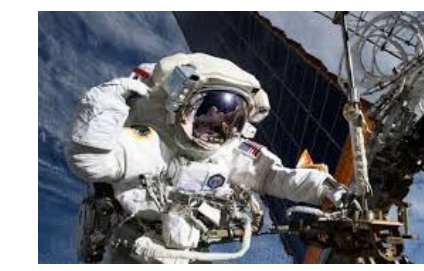
નામ કે બીમારીની વિગતો જાહેર કરી ન હતી. જોકે, નાસાએ સ્પષ્ટતા કરી હતી કે અવકાશયાત્રી હવે સ્થિર સ્થિતિમાં છે. એજન્સીના મુખ્ય આરોગ્ય અને તબીબી અધિકારી ડો. જેમ્સ પોલ્કે જણાવ્યું હતું કે, "આ કોઈ કટોકટી નથી, પરંતુ અમે અવકાશયાત્રીની સલામતી સુનિશ્ચિત કરવા માટે સાવચેતી રાખી રહ્યા છીએ." તેમણે

ન્યુયોર્ક, એક દુર્લભ નિર્ણયમાં, યુએસ અવકાશ એજન્સી નાસાએ આંતરરાષ્ટ્રીય અવકાશ મથક (આઈએસએસ) પર ચાલી રહેલા મિશનના વહેલા સમાપ્તિની જાહેરાત કરી છે. નાસાએ જણાવ્યું હતું કે આ નિર્ણય એક અવકાશયાત્રીના સ્વાસ્થ્ય સમસ્યાને કારણે લેવામાં આવ્યો હતો. અવકાશ એજન્સીએ જાહેરાત કરી હતી કે અમેરિકા, જાપાન અને રશિયાના ચાર અવકાશયાત્રીઓની એક ટીમ આગામી થોડા દિવસોમાં પૃથ્વી પર પાછા ફરશે, જે નિર્ધારિત સમય કરતાં વહેલું છે. આ સ્વાસ્થ્ય સમસ્યાને કારણે, નાસાએ નવા વર્ષની પહેલી સ્પેસવોક પણ રદ કરી. દર્દીની ગોપનીયતાનો હવાલો આપતા, નાસાએ અસરગ્રસ્ત અવકાશયાત્રીનું