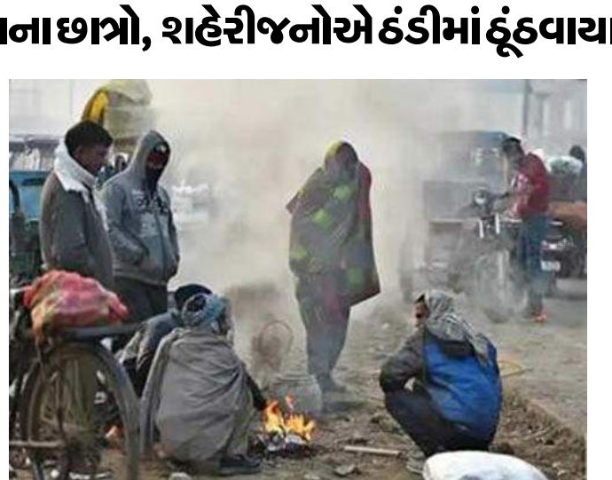
સવારથી ધુજાવી દીધા છે. આ બર્ફીલા પવનો બપોરે પણ યથાવત રહેવા પામ્યા હતા. હવામાન વિભાગના સુત્રો અનુસાર આજે

રાજકોટ, રાજકોટ શહેરમાં આજે સિઝનમાં ત્રીજી વખત પારો સિંગલ ડિજીટમાં પહોંચી ગયો છે. લઘુત્તમ તાપમાન ૯.૪ ડીગ્રી નોંધાયું છે. ઠંડા પવન ફૂંકાઈ રહ્યા હોય ઠંડીની અસર વધુ વર્તાઈ રહી છે. છેલ્લા કેટલાક દિવસોથી પારો ૧૦-૧૧ ડીગ્રી આસપાસ જ ધુમી રહ્યો છે. રાજકોટ સહિત સમગ્ર રાજ્યમાં શિયાળાએ બરોબરની જમાવટ પકડી લીધી છે. ખાસ કરીને છેલ્લા કેટલાક દિવસોથી સતત ઉત્તર-પૂર્વના બરફીલા પવનો ધુજાવી રહ્યા છે ત્યારે આજરોજ રાજકોટ શહેરમાં પણ સુસવાટા મારતા બર્ફીલા પવનોએ નગરજનોને