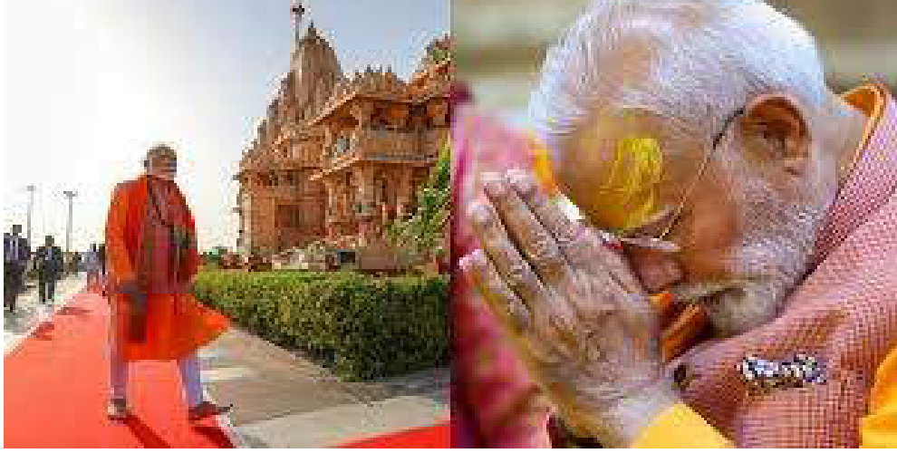
૧૦ મિનીટનું ટુંકુ રોકાણ કરી તેઓ હેલીકોપ્ટર મારફતે યાત્રાધામ સોમનાથ જવા રવાના થનાર છે. આ પ્રસંગે હિરાસર આંતરરાષ્ટ્રીય એરપોર્ટ ખાતે વડાપ્રધાન નરેન્દ્ર મોદીનું ભવ્ય સ્વાગત કરવામાં આવનાર છે. વડાપ્રધાનના સ્વાગતમાં રાજ્ય સરકારના કેબીનેટ મંત્રીઓ તેમજ રાજકોટ કલેક્ટર ડો.ઓમપ્રકાશ સહિત ટોચના સનંદી અધિકારીઓ જોડાનાર છે.

રાજકોટ સુપ્રસિધ્ધ યાત્રાધામ સોમનાથના સ્વામિમાન પર્વ તેમજ રાજકોટની મારવાડી યુનિ. ખાતે આયોજિત વાઈબ્રન્ટ ગુજરાત રીજીયોનલ સમિટ સૌરાષ્ટ્ર-કચ્છ ૨૦૨૬માં સહભાગી બનવા માટે વડાપ્રધાન નરેન્દ્ર મોદી આજથી બે દિવસના સૌરાષ્ટ્રના પ્રવાસે આવી રહ્યા હોય આ અંગેની તૈયારીઓને વહીવટી તંત્ર દ્વારા ઓપરીઓપ આપી દેવામાં આવેલ છે.