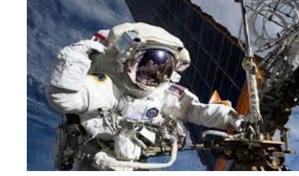
નામ કે બીમારીની વિગતો જાહેર કરી ન હતી. જોકે, નાસાએ સ્પષ્ટતા કરી હતી કે અવકાશયાત્રી હવે સ્થિર સ્થિતિમાં છે. એજન્સીના મુખ્ય આરોગ્ય અને તબીબી અધિકારી ડો. જેમ્સ પોલ્કે જણાવ્યું હતું કે, "આ કોઈ કટોકટી નથી, પરંતુ અમે અવકાશયાત્રીની સલામતી સુનિશ્ચિત કરવા માટે સાવચેતી રાખી રહ્યા છીએ." તેમણે

ન્યુયોર્ક, એક દુર્લભ નિર્ણયમાં, યુએસ અવકાશ એજન્સી નાસાએ આંતરરાષ્ટ્રીય અવકાશ મથક (આઈએસએસ) પર ચાલી રહેલા મિશનના વહેલા સમાપ્તિની જાહેરાત કરી છે. નાસાએ જણાવ્યું હતું કે આ નિર્ણય એક અવકાશયાત્રીના સ્વાસ્થ્ય સમસ્યાને કારણે લેવામાં આવ્યો હતો. અવકાશ એજન્સીએ જાહેરાત કરી હતી કે અમેરિકા, જાપાન અને રશિયાના ચાર અવકાશયાત્રીઓની એક ટીમ આગામી થોડા દિવસોમાં પૃથ્વી પર પાછા ફરશે, જે નિર્ધારિત સમય કરતાં વહેલું છે. આ સ્વાસ્થ્ય સમસ્યાને કારણે, નાસાએ નવા વર્ષની પહેલી સ્પેસવોક પણ રદ કરી. દર્દીની ગોપનીયતાનો હવાલો આપતા, નાસાએ અસરગ્રસ્ત અવકાશયાત્રીનું