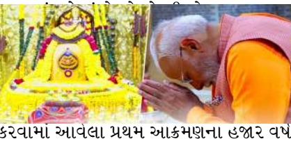
કરવામાં આવેલા પ્રથમ આકમણના હજાર વર્ષ

'સૌરાષ્ટ્ર સોમનાથ ચ, શ્રી શૈલે મલિકાજીનમ, ઉજ્જયિન્યાં મહાકાલમ ? કારમ અમલેશ્વરમ.' દાદશ જ્યોતિર્લિંગ સ્તોત્રની આ પંક્તિ દર્શાવે છે કે, ભારતના ૧૨ પવિત્ર જ્યોતિર્લિંગોનું વર્ણન થાય ત્યારે સૌથી પહેલાં સોમનાથનો ઉલ્લેખ આવે છે. આ ભારતની સંસ્કૃતિમાં સોમનાથનું અગ્રસ્થાન તથા તેના અરિનાશી સાંસ્કૃતિક અને આધ્યાત્મિક મહત્વને દર્શાવે છે. છેલ્લા બે દાયકામાં વડાપ્રધાન શ્રી નરેન્દ્ર મોદીના નેતૃત્વ હેઠળ સોમનાથ મંદિર "સુવર્ણ