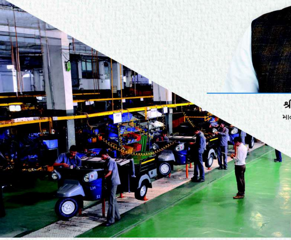
શ્રી નરેન્દ્ર મોદી માનનીય વડાપ્રધાન