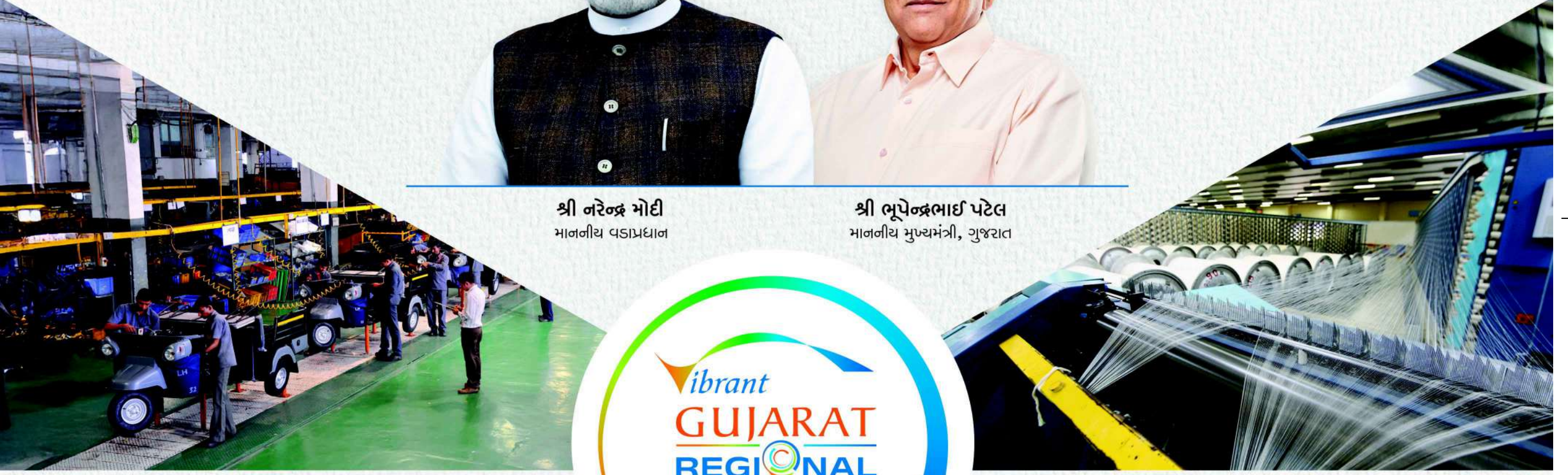
શ્રી નરેન્દ્ર મોદી માનનીય વડાપ્રધાન