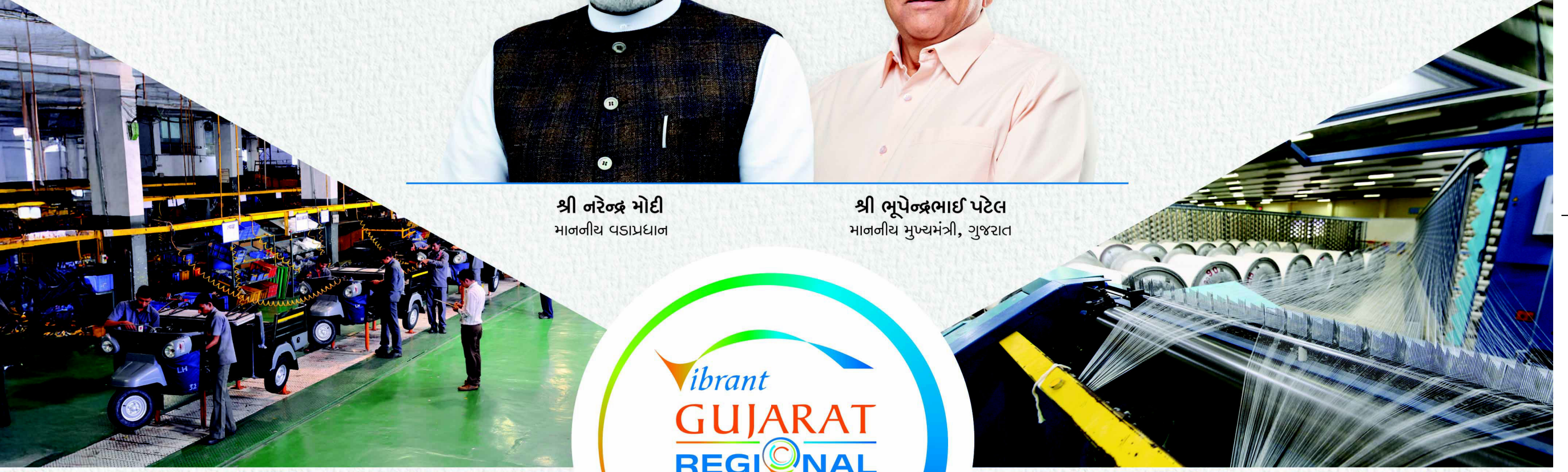
શ્રી નરેન્દ્ર મોદી માનનીય વડાપ્રધાન