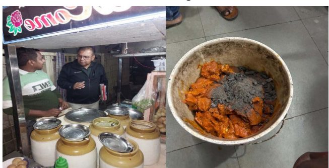
રાજકોટ, ગાંધીનગરમાં ટાઈફોઈડના રોગચાળાના કહેર વચ્ચે રાજકોટમાં પણ પાણીપુરીના ધંધાર્થીઓને ત્યાં સઘન ડ્રાઈવ ચાલી રહી છે તે અંતર્ગત ૧૫૦ ફૂડ રીંગ રોડ, યુનિ. રોડ, પુષ્કરધામ, કોટેયા ચોક, રેસકોર્સ, સર્વેશ્વર ચોક, યાજ્ઞિક રોડ સહિતના વિસ્તારોમાં ૫૦ ધંધાર્થીને ત્યાં અલગ અલગ ફેલેવરના પાણીના નમુના લઈ લેબોરેટરી પરીક્ષણમાં મોકલવામાં આવ્યા છે.