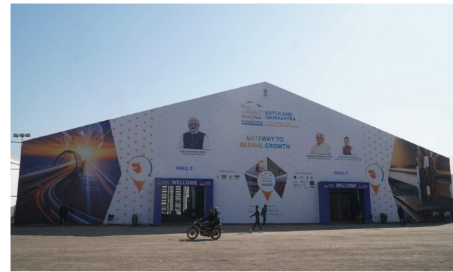
ગુજરાત રાજ્ય ડિઝાસ્ટર મેનેજમેન્ટ ઓથોરિટી, ગુજરાત પ્રદૂષણ નિયંત્રણ બોર્ડ, ગુજરાત એનર્જી ડેવલપમેન્ટ એજન્સી, ગુજરાત પર્યાવરણ પ્રબંધન સંસ્થાન (ગેમી), નેશનલ હાઈવે ઓથોરિટી ઓફ ઈન્ડિયા, વન વિભાગ-ગુજરાત રાજ્યના સ્ટોલ્સ રાખવામાં આવ્યા છે. આ તમામ સ્ટોલમાં વિવિધ ક્ષેત્રો દ્વારા દેશની અર્થવ્યવસ્થામાં અપાતા યોગદાન સાથે ભવિષ્યની સંભાવનાઓની એક ઝાંખી પણ જોવા મળશે. ઉદ્યોગકારો અને બિઝનેસમેન ઉપરાંત આ યીમ પેવેલિયન સહી દર્શકોના જ્ઞાન-માહિતીમાં વધારો થશે તેમજ વિવિધ ક્ષેત્રોને સમજવાનો નવો દ્રષ્ટિકોણ મળશે.

‘લોકલ’ કારીગરથી લઈને ‘ગ્લોબલ’ માર્કેટમાં ડંકો વગાડતી કંપનીઓની ક્ષમતા જોવા મળશે : વિવિધ સેક્ટર્સના ભવિષ્યના અવસરોને ઉજાગર કરતાં યીમ પેવેલિયન દર્શકો માટે બનશે આકર્ષણનું કેન્દ્ર