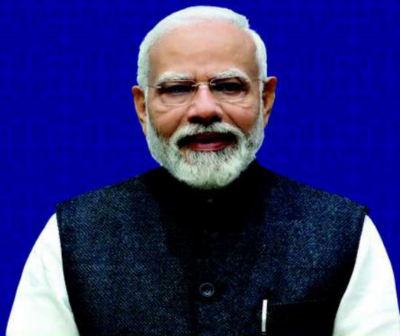
શ્રી નરેન્દ્ર મોદી માનનીય વડાપ્રધાન

આંતરરાષ્ટ્રીય પતંગ મહોત્સવ ૨૦૨૬ સાથે ગુજરાતનું આકાશ રંગોથી છલકાઈ જશે, જ્યાં પરંપરા અને પતંગબાજીના શાશ્વત આનંદનો અદ્ભુત સંગમ જોવા મળશે!