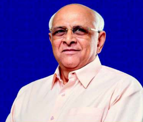
શ્રી લૂપેન્દ્રલાઈ પટેલ માનનીય મુખ્યમંત્રી, ગુજરાત