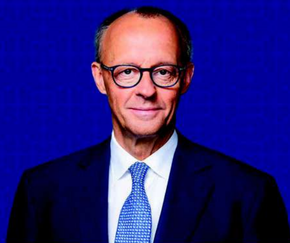
શ્રી ફ્રેડરિક મર્ઝ ફેડરલ ચાન્સેલર, ફેડરલ રિપબ્લિક ઓફ જર્મની