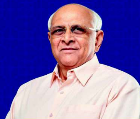
શ્રી ભૂપેન્દ્રલાલ પટેલ માનનીય મુખ્યમંત્રી, ગુજરાત