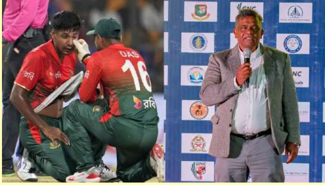
બાંગ્લાદેશ ક્રિકેટ બોર્ડના પ્રમુખ અમીનુલ ઈસ્લામ ઈસ્લામ (મધ્યે) તેમજ અન્ય અધિકારીઓ સાથે બાંગ્લાદેશ ક્રિકેટ બોર્ડના કાર્યાલયમાં મુલાકાત કરી રહ્યા છે.

સ્પષ્ટ કારણ આપ્યું ન હતું. બુલબુલે તાજેતરમાં મીડિયાને જણાવ્યું હતું કે, "અમને આઈસીસી તરફથી હજુ સુધી કોઈ જવાબ મળ્યો નથી. અમે અમારી ચિંતાઓને સમર્થન આપતા બધા પુરાવા મોકલ્યા છે." તેણીએ કહ્યું કે બોર્ડે આઈસીસીને સ્પષ્ટપણે પોતાનો વલણ જણાવ્યું છે અને ભાર મૂક્યો છે કે મેચોને ભારતના બીજા શહેરમાં ખસેડવાથી તેમની ચિંતાઓનો ઉકેલ આવશે નહીં. "અમે ઈચ્છીએ છીએ કે મેચો ભારતની બહાર ખસેડવામાં આવે," તેણીએ કહ્યું. આપણે સરકારની સૂચનાઓનું પાલન કરવું જોઈએ.