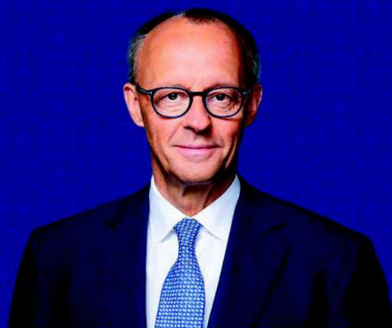
શ્રી ફ્રેડરિક મર્ઝ ફેડરલ ચાન્સેલર, ફેડરલ રિપબ્લિક ઓફ જર્મની