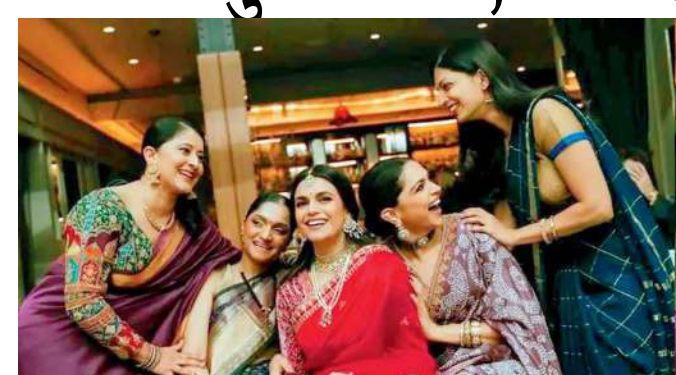
મુંબઈ, દીપિકા પાદુકોણ આ દિવસોમાં કેમેરાથી દૂર રહીને ખૂબ મજા કરી રહી છે. તેણીએ તેની શ્રેષ્ઠ મિત્ર સ્નેહા રામચંદરના લગ્નમાં ખૂબ મજા કરી, જેના ફોટા સોશિયલ મીડિયા પર વાયરલ થઈ રહ્યા છે. સ્નેહા રામચંદરના લગ્ન ન્યૂ યોર્કમાં થઈ રહ્યા છે, જ્યાં દીપિકા તેના મિત્રના લગ્નમાં દુલ્હન તરીકે કામ કરી રહી છે. લગ્નના ઘણા ફોટા સોશિયલ મીડિયા પર વાયરલ થઈ રહ્યા છે. દીપિકા તેમાં એકદમ સુંદર લાગી રહી છે. એક ખાસ ફોટામાં, તે જાંબલી રંગની બાંધણી (પ્રિન્ટેડ) ડિઝાઇનર સાડી પહેરેલી જોવા મળે છે જેમાં સુંદર બોર્ડર, ભારતકામ

કરેવું બ્લાઉઝ, મેથિંગ ચોકર, મોટા કાનના બુટ્ટી અને બંગડીઓ છે. તેના વાળ સુંદર બનમાં બાંધેલા છે. રણવીર સિંહ પણ ન્યૂ યોર્ક પહોંચી ગયો છે અને લગ્નની વિધિઓમાં હાજરી આપી રહ્યો છે. દીપિકા અને રણવીરે ૨૦૨૬ ના નવા વર્ષની શરૂઆત ન્યૂ યોર્કમાં વિતાવી છે. રણવીર અને દીપિકાના ઘણા ફોટા સોશિયલ મીડિયા પર ચાહકોમાં વાયરલ થઈ રહ્યા છે. "કિંગ" ફિલ્મમાં શાહરૂખ ખાન સાથે દીપિકા જોવા મળશે તેવું જાણવા મળ્યું છે. આ એકશનથી ભરપૂર ફિલ્મનું ડિગ્રેડેશન સિદ્ધાર્થ આનંદ કરી રહ્યા છે. શાહરૂખની પુત્રી સુહાના ખાન પણ આ ફિલ્મમાં ડેબ્યુ કરી રહી છે. રાની મુખર્જી, અભિષેક બચ્ચન અને અન્ય કલાકારો પણ આ ફિલ્મમાં અભિનય કરી રહ્યા છે. આ ફિલ્મ ૨૦૨૬માં રિલીઝ થવાની છે. રણવીર સિંહની ફિલ્મ "ધુરંધર પાર્ટ ૨" ૧૯ માર્ચ, ૨૦૨૬ના રોજ સિનેમાઘરોમાં રિલીઝ થશે. આ એકશન થ્રિલર ફિલ્મમાં આર. માધવન, અર્જુન રામપાલ અને સંજય દત્ત પણ તેમની મૂળ ભૂમિકાઓમાં પાછા ફર્યા છે.