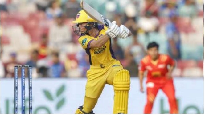
નવીદિલ્હી, મહિલા પ્રીમિયર લીગ (ડબ્લ્યુપીએલ) ની ચોથી સીઝન શરૂ થઈ ગઈ છે. ચાલુ સીઝનના બીજા મેચમાં યુપી વોરિયર્સ ટીમનો સામનો ગુજરાત જાયન્ટ્સ સામે થયો. આ મેચમાં, યુપી વોરિયર્સની કેપ્ટન મેગ લેનિંગે ઈતિહાસ રચ્યો. તે ટુર્નામેન્ટના ઈતિહાસમાં સૌથી વધુ રન બનાવનારી ઓસ્ટ્રેલિયન બેટ્સમેન બની. એકદરે, તે યાદીમાં બીજા ક્રમે છે, આ સંદર્ભમાં એલિસ પેરીને પાછળ છોડી દે છે.

મેગ લેનિંગ ૨૦૨૩ થી ડબ્લ્યુપીએલમાં કુલ ૨૮ મેચ રમી છે, જેમાં ૩૮.૨૮ ની સરેરાશથી ૮૮૨ રન બનાવ્યા છે, જેમાં નવ અડધી સદીનો સમાવેશ થાય છે. એલિસ પેરીએ ૨૫ મેચોમાં ૬૪.૮૦ ની સરેરાશથી ૯૭૨ રન