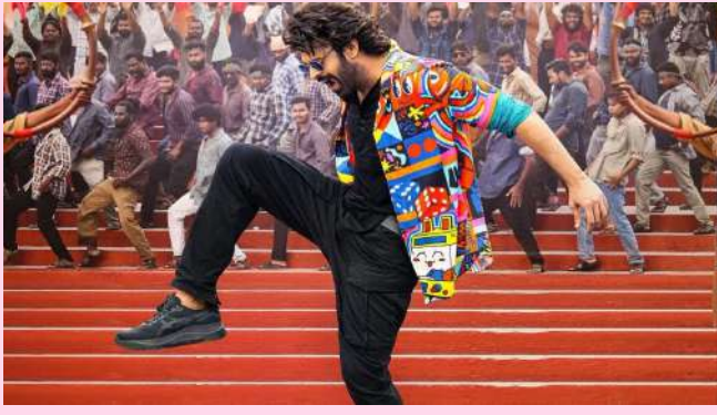
મજબૂત ઓપનિંગ પછી, ફિલ્મે બધી ભાષાઓમાં ફક્ત ૨૭.૮૩ કરોડની કમાણી કરી. આ તેના પહેલા દિવસે ૫૩.૭૫ કરોડની કમાણી કરતા નોંધપાત્ર રીતે ઓછી છે. ડેટા અનુસાર, ફિલ્મે ભારતમાં માત્ર બે દિવસમાં ૯૦.૭૩ કરોડનું ચોખ્ખું કલેક્શન એકત્રિત કર્યું છે. વિશ્વભરમાં કુલ કલેક્શન હવે ૧૩૮.૪ કરોડ છે, જેમાં ૩૦ કરોડ વિદેશમાંથી આવ્યા છે. બે દિવસ પછી, ભારતમાં કુલ કલેક્શન ૧૦૮.૪ કરોડ છે. ફિલ્મની કમાણીમાં પાછલા દિવસની સરખામણીમાં આશરે ૪૮.૨૨% ઘટાડો જોવા મળ્યો. 'ધ રાજાસાબ' ફિલ્મનો શનિવારે એકદરે તેલુગુ ઓક્ષુપ્ત્સી ૪૪.૦૦% રહ્યો.

મુંબઈ, દિવસની કમાણીની દ્રષ્ટિએ "ધુરંધર" ને પાછળ છોડી દીધી હતી. જો કે, ફિલ્મ ભારતમાં ૧૦૦ કરોડના આંકડો પહોંચી ગઈ છે. આશ્ચર્યજનક રીતે, પ્રભાસ અભિનીત "ધ રાજાસાબ" એ બીજા દિવસે બોક્સ ઓફિસ પર કમાણીમાં નોંધપાત્ર ઘટાડો જોયો.