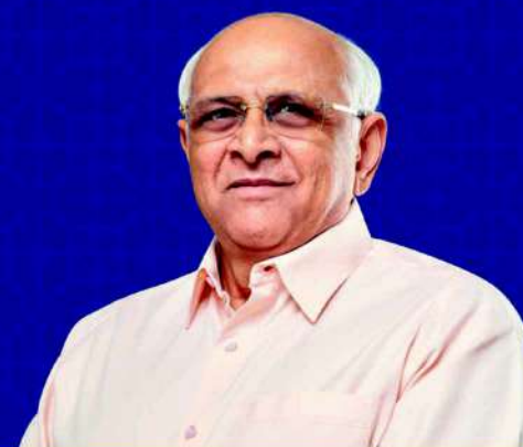
શ્રી લૂપેન્દ્રલાઈ પટેલ માનનીય મુખ્યમંત્રી, ગુજરાત