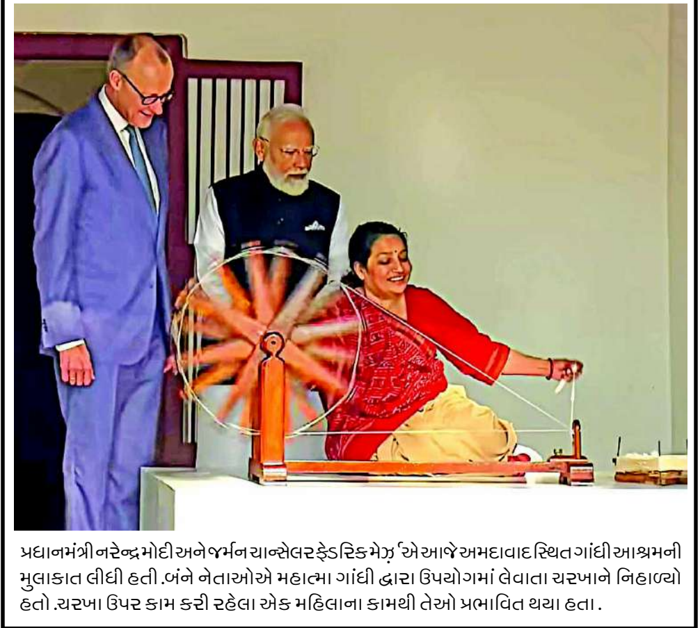
પ્રધાનમંત્રી નરેન્દ્ર મોદી અને જર્મન ચાન્સેલર ફેડરિક મેર્ક એ આજે અમદાવાદ સ્થિત ગાંધી આશ્રમની મુલાકાત લીધી હતી. બંને નેતાઓએ મહાત્મા ગાંધી દ્વારા ઉપયોગમાં લેવાતા ચરખાને નિહાળ્યો હતો. ચરખા ઉપર કામ કરી રહેલા એક મહિલાના કામથી તેઓ પ્રભાવિત થયા હતા.

જર્મન ચાન્સેલર ફેડરિક મેર્ક ભારતની બે દિવસીય મુલાકાતે અમદાવાદ પહોંચ્યા છે. ચાન્સેલર મેર્ક પ્રધાનમંત્રીના આમંત્રણ પર ૧૨-૧૩ જાન્યુઆરી ૨૦૨૬ દરમિયાન ભારતની સત્તાવાર મુલાકાતે છે, આ તેમની ભારતની પ્રથમ સત્તાવાર મુલાકાત હશે.