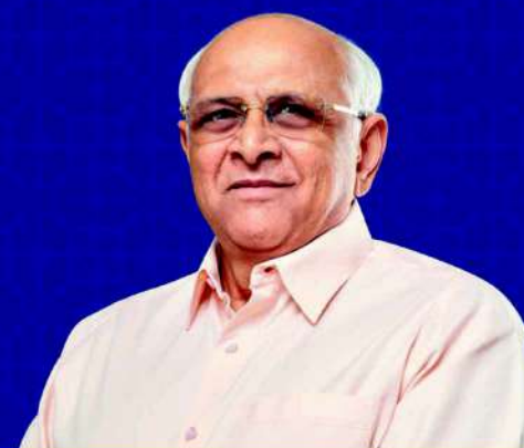
શ્રી લૂપેન્દ્રલાઈ પટેલ માનનીય મુખ્યમંત્રી, ગુજરાત