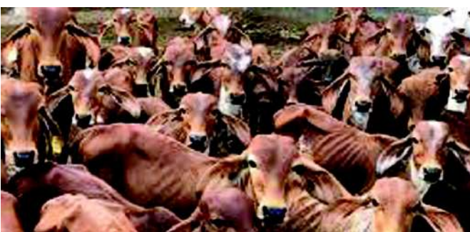
પાંજરાપોળમાં ગાયોનો નિભાવ કરી રીતે થાય છે.

જામનગર : જામનગરમાં લીમડા લાઈન વિસ્તારમાં આવેલી શ્રી જામનગર પાંજરાપોળ : ગૌશાળા કે જે ૧૫૧ વર્ષ જુની છે. ત્યાં ૧૧૦૦ ગાયોનો નિભાવ કરવામાં આવે છે. જેમાં અર્ધગ-વૃધ્ધ-સુરદાસ-બિમાર તથા માતા વગરના ગાયોના નાના બચ્ચાઓને રોજ દૂધ પિવડાવીને વર્ષોથી નિભાવ કરવામાં આવે છે.