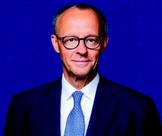
શ્રી ફ્રેડરિક મર્ઝ ફેડરલ ચાન્સેલર, ફેડરલ રિપબ્લિક ઓફ જર્મની