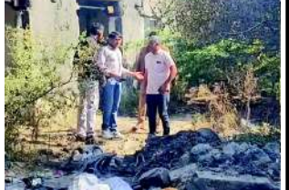
તાત્કાલિક ઘટનાસ્થળે પહોંચી ગયો હતો. પોલીસે મૃતદેહનો કબજો મેળવી પોસ્ટમોર્ટમ માટે ખસેડવાની કાર્યવાહી હાથ ધરી છે. પોલીસે અજાણી મહિલાની ઓળખ મેળવવા અને ગુનેગારો સુધી પહોંચવા માટે તપાસ શરૂ કરી છે. આસપાસના વિસ્તારના સીસીટીવી ફૂટેજ પણ તપાસવામાં આવી રહ્યા છે.

જેતપુર: જેતપુરના રબારીકા રોડ પર આવેલા એમ. જી. ઉદ્યોગનગર વિસ્તારમાંથી એક અજાણી વૃદ્ધ મહિલાનો મૃતદેહ મળી આવ્યો છે. મૃતદેહ ચાદરમાં લપેટાયેલી હાલતમાં હોવાથી હત્યાની આશંકા સેવાઈ રહી છે. પોલીસને બાવળની ઝાડીઓમાં આવેલી એક અવાવું ઓરડીમાંથી આ મૃતદેહ મળ્યો હતો. પ્રાથમિક તપાસમાં જણાવ્યું છે કે મૃતદેહ ચાદરમાં બાંધેલી હાલતમાં હતો, જે હત્યા તરફ ઈશારો કરે છે. મૃતક મહિલા પરપ્રાંતિય હોવાની શક્યતા છે. ઘટનાની જાણ થતાં જ જેતપુર ઉદ્યોગનગર પોલીસ, રાજકોટ રૂરલ પોલીસ લોકલ કાર્ટમ બ્રાન્ચ (નજમ)નો કાફલો