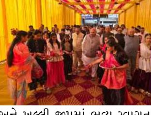
અને પુલ્લી જીપમાં ભવ્ય સ્વાગત કરાયું હતું. પરિવારની દીકરીઓએ કંકુ તિલક અને પુષ્પ વર્ષાથી મહેમાનોને આવકાર્યા હતા. કાર્યક્રમનો પ્રારંભ રાષ્ટ્રગીત અને દીપ પ્રાગટ્યથી થયો હતો. ત્યારબાદ પરિવારના દિવંગત સભ્યોને મોન પાળી શ્રદ્ધાંજલિ અર્પણ કરાઈ હતી. આ સ્નેહમિલન