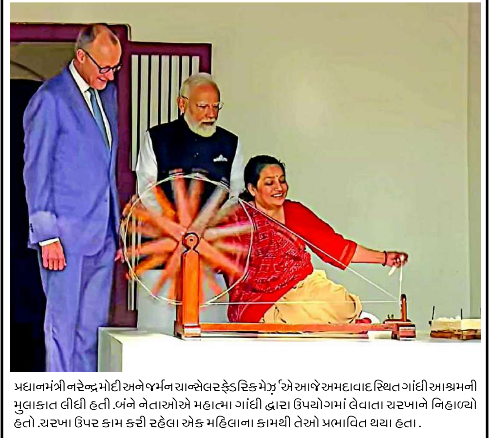
પ્રધાનમંત્રી નરેન્દ્ર મોદી અને જર્મન ચાન્સેલર ફેડરિક મેર્ક એ આજે અમદાવાદ સ્થિત ગાંધી આશ્રમની મુલાકાત લીધી હતી. બંને નેતાઓએ મહાત્મા ગાંધી દ્વારા ઉપયોગમાં લેવાતા ચરખાને નિહાળ્યો હતો. ચરખા ઉપર કામ કરી રહેલા એક મહિલાના કામથી તેઓ પ્રભાવિત થયા હતા.

જર્મન ચાન્સેલર ફેડરિક મેર્ક ભારતની બે દિવસીય મુલાકાતે અમદાવાદ પહોંચ્યા છે. ચાન્સેલર મેર્ક પ્રધાનમંત્રીના આમંત્રણ પર ૧૨-૧૩ જાન્યુઆરી ૨૦૨૬ દરમિયાન ભારતની સત્તાવાર મુલાકાતે છે, આ તેમની ભારતની પ્રથમ સત્તાવાર મુલાકાત હશે.