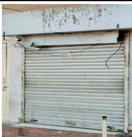
સવરે આ ઇસ્પુન: કાર્યરત કરવામાં આવે જેથી દૂર-દૂરથી વીરપુર આવતા ભાવિકોની શ્રદ્ધા યાત્રા સુખદ રહે અને તેમને આર્થિક વ્યવહારમાં કોઈ મુશ્કેલી ન પડે.

વીરપુર: વિશ્વભરમાં પ્રખ્યાત યાત્રાધામ વીરપુર (જલારામ) ખાતે હાલમાં બ્રહ્મણુઓ અને પ્રવાસીઓને રોકડ રકમ ઉપાડવા માટે ભારે મુશ્કેલીનો સામનો કરવો પડી રહ્યો છે. વીરપુરની મુખ્ય બજારમાં આવેલું સ્ટેટ બેંક ઓફ ઈન્ડિયા SBI ATM છેલ્લા ૧૦ દિવસથી બંધ હાલતમાં હોવાથી સ્થાનિકો તેમજ બહારગામથી આવતા યાત્રિકો રોકડ રકમ માટે મુશ્કેલીઓ વેઠવી પડી રહી છે. વીરપુરમાં પૂજ્ય જલારામ બાપના દર્શનાર્થે દરરોજ હજારોની સંખ્યામાં ભાવિકો ઉમટી પડે છે. હાલ શિયાળાની ઋતુ અને રિસેમ્બર મહિનો હોવાથી એનઆરઆઈ અને અન્ય રાજ્યોમાંથી આવતા પ્રવાસીઓની સંખ્યા પણ વિશેષ છે. આવા સમયે, ગામની મધ્યમાં અને મુખ્ય બજારમાં આવેલું એકમાત્ર સ્ટેટ બેંક ઓફ ઈન્ડિયા SBI ATM છેલ્લા ૧૦ દિવસથી બંધ હાલતમાં છે (શરૂ કરાવવામાં છે).