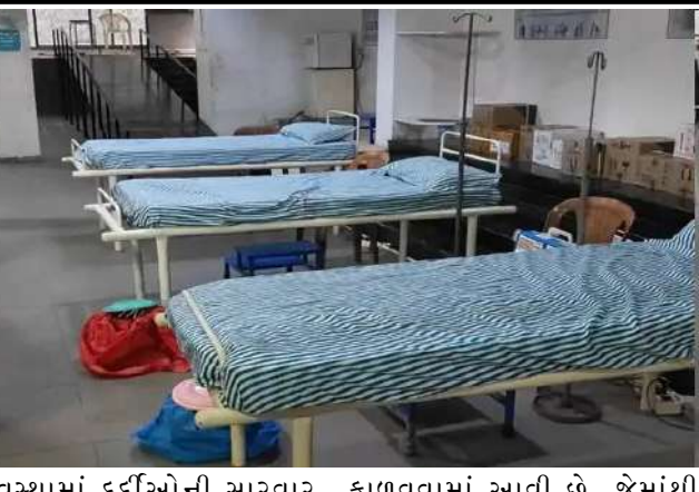
વ્યવસ્થામાં દર્દીઓની સારવાર માટે કુલ ૫૦ જેટલા મેડિકલ સ્ટાફને ફરજ સોંપવામાં આવી છે. આ ટીમમાં ફિઝિયોથેરાપી, જનરલ સર્જન, ઓર્થોપેડિક (હાડકાના નિષ્ણાત) અને મેડિકલ ઓફિસર જેવા વિવિધ રોગોના નિષ્ણાતોનો સમાવેશ થાય છે.

રાજકોટમાં આજથી શરૂ થઈ રહેલી વાઈબ્રન્ટ ગુજરાત ગ્લોબલ કોન્ફરન્સને લઈને વહીવટી તંત્ર અને આરોગ્ય વિભાગ દ્વારા ખાસ આયોજન કરવામાં આવ્યું છે. આ આંતરરાષ્ટ્રીય સ્તરના કાર્યક્રમમાં દેશ-વિદેશના અનેક મહાનુભાવો અને પ્રતિનિધિઓ મોટી સંખ્યામાં ઉપસ્થિત રહેવાના હોવાથી, કોઈપણ સંભવિત તબીબી કટોકટીને પહોંચી વળવા માટે મારવાડી કોલેજ કેમ્પસમાં જ ૬ બેડની સુવિધા ધરાવતી અદ્યતન મિની હોસ્પિટલ ઉભી કરવામાં આવી છે. રાજકોટ સિવિલ હોસ્પિટલના નેજા હેઠળ તૈયાર કરાયેલી હોસ્પિટલમાં નિષ્ણાત તબીબોની કોજ તૈનાત કરવામાં આવી છે, જે કોન્ફરન્સ પૂર્ણ થાય ત્યાં સુધી ચોવીસ કલાક ખડેપગે રહેશે. સિવિલ હોસ્પિટલ દ્વારા કરવામાં આવેલી આ વિશેષ