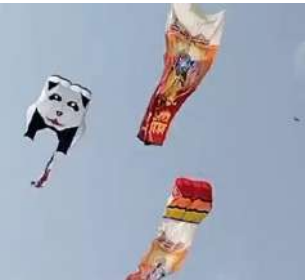
સમાચાર એ છે કે, આ વર્ષે પતંગ યગાવવા માટે વધુ હુમકા લગાવવા નહીં પડે. રાજ્યમાં પવનની ગતિ સામાન્ય અને પતંગ યગાવવા માટે અનુકૂળ રહેવાની આગાહી કરવામાં આવી છે. હવામાન નિષ્ણાંત અંકિત પટેલના જણાવ્યા મુજબ સામાન્ય પતંગ યગાવવા માટે પવનની ગતિ પ્રતિકલાક પ કિમીની હોવી જરૂરી છે. આ વર્ષે ઉત્તરાયણના દિવસે મોટાભાગના શહેરોમાં પવનની ગતિ પ કિમી કે તેનાથી વધુ રહેવાની શક્યતા હોય પતંગબાજોએ પતંગ યગાવવામાં તકલીફ નહીં પડે.

રાજકોટ: ઉત્તરાયણનું પર્વ નજીક આવતા જ પતંગરસિયાઓના મનમાં એક જ સવાલ હોય છે કે, પતંગ યગાવવા માટે પવન કેવો રહેશે? આ વર્ષે ઉત્તરાયણના દિવસે પતંગ યગાવવા માટે પતંગરસિયાઓએ ચિંતા કરવાની જરૂર નથી. હવામાન નિષ્ણાંતના જણાવ્યા અનુસાર ઉત્તરાયણના દિવસે પતંગ યગાવવા માટે પવનની ગતિ સાનુકૂળ રહેશે. જાણકારોના મતે સામાન્ય પતંગ યગાવવા માટે પ્રતિકલાક પ કિમીની ઝડપે ફૂંકતા પવનની જરૂરિયાત રહે છે. ભારકરે હવામાન નિષ્ણાંત અંકિત પટેલ સાથે વાત કરી હતી અને ઉત્તરાયણના પર્વ પર રાજ્યના મહત્વના શહેરોમાં સવારથી સાંજ સુધી પવનની ગતિ કેવી રહેશે તે ઉત્તરાયણના દિવસે મોટાભાગના શહેરોમાં પવનની ગતિ પ કિમી કે તેનાથી વધુ રહેવાની શક્યતા હોય પતંગબાજોએ પતંગ યગાવવામાં તકલીફ નહીં પડે.