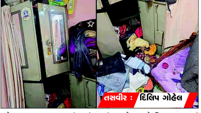
પહેલા જ અવસાન થયું હતું. પરિવારજનો જુનાગઢ હતાં ત્યારે

રાજકોટ, રાજકોટના શહેરના કાલાવડ રોડ પર સાંજા ચુલ્હાર પાછળ આવેલી બે સોસાયટીમાં ત્રણ મકાનને ભુકાનીધારી તસ્કરો નિશાન બનાવી. એક મકાનમાંથી ૯,૩૪,૦૦૦ની રોકડ-દાગીના સહિતની મત્તા, બીજા એક ઘરમાંથી ૧૫ હજારની રોકડ ગઈ હતી. તો એક મકાનમાં ચોરીનો પ્રયાસ થયો હતો. જ્યાં લાખોની મત્તાની ચોરી થઈ એ પરિવારના દસ વર્ષના ટિકરાનું છ દિવસ