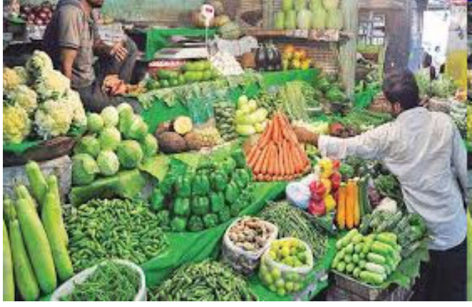
શાકભાજી અને અનાજના ભાવ, આગામી મહિનાઓમાં ફુગાવાના માર્ગને નક્કી કરશે. સરકાર અને રિઝર્વ બેંક બંને ફુગાવા પર

નવીદિલ્હી, તા. ૧૨ ધરગથ્થુ રસોડા પર ફુગાવાનો દબાણ ફરી એકવાર વધી રહ્યો હોય તેવું લાગે છે. શાકભાજી અને પ્રોટીનયુક્ત ખોરાકના ભાવમાં વધારાને કારણે ડિસેમ્બર ૨૦૨૫માં છૂટક ફુગાવો વધીને ૧.૩૩ ટકા થયો હતો. આ છેલ્લા ત્રણ મહિનામાં સૌથી વધુ સ્તર છે. અગાઉ, નવેમ્બરમાં ફુગાવો ઓછો હતો. જોકે, વર્તમાન સ્તરે, ફુગાવો હજુ પણ નિયંત્રણમાં હોવાનું માનવામાં આવે છે અને તે રિઝર્વ બેંક ઓફ ઈન્ડિયા દ્વારા નિર્ધારિત મર્યાદામાં રહે છે. નિષ્ણાનો કહે છે કે ખાદ્યપદાર્થો, ખાસ કરીને