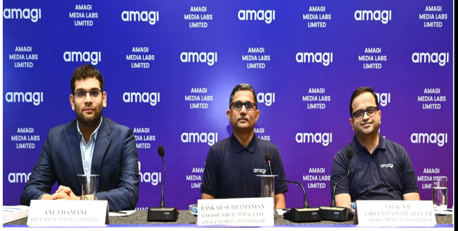
અમાગી મીડિયા લેબ્સ લિમિટેડના સંસ્થાપકો અને મેનેજિંગ ડિરેક્ટર્સ.

અમાગી મીડિયા લેબ્સ લિમિટેડ નો ઈશ્યુ આજથી ખૂબી રહ્યો છે. ઓફર ની પ્રાઈઝ બેન્ડ ઈકવિટી શેર દીઠ ૩ રૂઝથી ૩ ૩૫ રાખવામાં આવી છે. બીડ અરજી ૪૧ ઈકવિટી શેર અને ત્યારબાદ ૪૧ ઈકવિટી શેર ના ગુણાંક માં કરી શકાશે. ઈશ્યુ ૧૩ જાન્યુઆરી ના રોજ ખુલશે અને ૧૬ જાન્યુઆરી ના રોજ બંધ થશે.