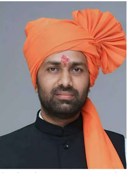
એક નોટિફિકેશન બહાર પાડી આ અમરેલી ગ્રામીણ-૨ પેટા વિભાગ કચેરીની રચના કરવાં

મિલાપ રૂપારેલ દ્વારા અમરેલી તા. હાલમાં અમરેલી પીજીવીસીએલ હસ્તકની અમરેલી ગ્રામીણ પેટા વિભાગની એક કચેરી કાર્યરત છે. આ કચેરીનું વિભાજન કરીને હવે નવી અમરેલી ગ્રામીણ-૨ પેટા વિભાગ કચેરીની રચના કરવાની સ્થાનિકો દ્વારા માંગણી ઘણાં સમયથી ઊઠી હતી. આ કચેરીનું વિભાજન કરી વહીવટી સુગમતા માટે નવી કચેરી ઊભી કરવા માટેની રજૂઆત રાજ્યના ઊર્જા અને પેટ્રોકેમિકલ્સ રાજ્ય મંત્રી કૌશિક વેકરિયાને કરવામાં આવતા જે અંગેની નોંધ લઈ રાજ્ય મંત્રીએ સત્તા સંભાળ્યાના માત્ર દોઢ માસમાં જ આ કચેરીની રચનાને પાસ કિસ્સામાં મંજૂરી આપતા હુકમો કરવા ઊર્જા વિભાગને નિર્દેશ આપ્યા હતા. જે અનુસંધાને ઊર્જા વિભાગ દ્વારા ગઈકાલે તા ૧૦ ના રોજ