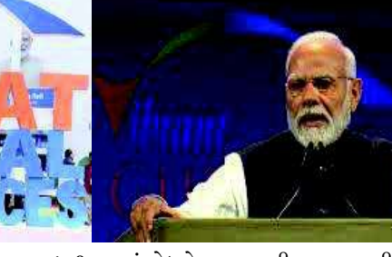
માંડવિયા, અન્ય કેન્દ્રીય મંત્રી, મુખ્યમંત્રી ભુપેન્દ્રભાઈ પટેલ, નાયબ મુખ્યમંત્રી હર્ષ સંઘવી ઉપરાંત ટોચના ઉદ્યોગપતિઓ ઉપસ્થિત રહેશે.

રાજકોટ, આગામી જાન્યુઆરીના બીજા સપ્તાહમાં રાજકોટમાં યોજાનારી વાઈબ્રન્ટ સમિટની તડામાર તૈયારી ચાલી રહી છે. આ સમિટમાં વડાપ્રધાન નરેન્દ્ર મોદી ઉપસ્થિત રહેવાના હોવાથી મહત્વ વધી ગયું છે અને તંત્રની દોડધામ પણ વધી ગઈ છે. આ સમિટમાં દેશના ટોચના ઉદ્યોગપતિઓ અને વિદેશી રોકાણકારો પણ ઉપસ્થિત રહેશે. આ સમગ્ર આયોજન સાથે સંકળાયેલા કલેક્ટર કચેરીના સુત્રો અનુસાર, આ સમિટ તા. ૧૦, ૧૧ અને ૧૨ જાન્યુઆરીએ મોરબી રોડ ઉપર આવેલી મારવાડી યુનિવર્સિટીના કેમ્પસમાં યોજાશે. વડાપ્રધાન નરેન્દ્ર મોદી આવવાના હોવાથી એ મુજબની તૈયારી શરૂ કરી દેવામાં આવી છે. વડાપ્રધાન નરેન્દ્ર મોદી સાથે કેન્દ્રીય મંત્રી મનસુખભાઈ