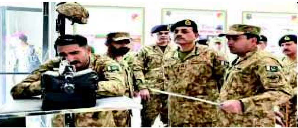
સેના આંતરિક અને બાહ્ય પડકારો માટે તૈયાર છે. દુશ્મનના હાઈબ્રિડ ઓપરેશન્સ અને ખોટા પ્રચાર રાષ્ટ્રીય સ્થિરતાને નબળી પાડવાનો પ્રયાસ કરી રહ્યા છે, પરંતુ તેમનો સામનો કરવામાં આવશે. અસીમ મુનીરને તાજેતરમાં પાકિસ્તાનના ચીફ ઓફ ડિફેન્સ સ્ટાફ તરીકે નિયુક્ત કરવામાં

શાખા, ઈન્ટર-સર્વિસિસ પબ્લિક રિલેશન્સ દ્વારા જારી કરાયેલા એક નિવેદનમાં કહેવામાં આવ્યું છે કે મુનીરે ફિલ્ડ ટ્રેનિંગ કસરતો અને એડવાન્સ્ડ સિમ્યુલેટર તાલીમ સુવિધાનું અવલોકન કર્યું. મુનીરે ત્યાં સૈનિકોના ઉચ્ચ વ્યાવસાયિક ધોરણો અને એકંદરે તૈયારીઓની પ્રશંસા કરી અને તકનીકી અનુકૂળનશક્તિના મહત્વ પર ભાર મૂક્યો. આઈએસપીઆર ફોટા અને વિડિઓઝમાં મુનીર ટેક અને ડ્રોન સાથે સંકળાયેલા લશ્કરી પ્રદર્શનને જોતા દેખાય છે. સૈનિકો સાથે વાત કરતા, મુનીરે જણાવ્યું હતું કે પાકિસ્તાન