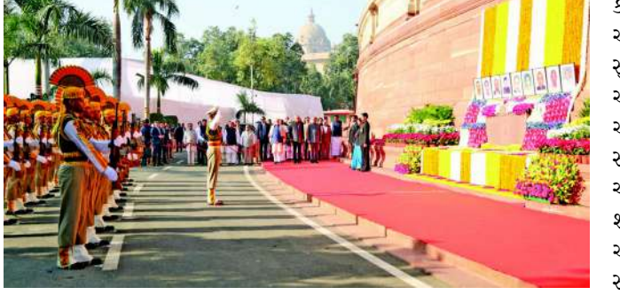
પ્રધાન કિરેન રિજિજુ અને અન્ય સાંસદોએ હુમલામાં શહીદ થયેલા સુરક્ષા કર્મચારીઓને શ્રદ્ધાંજલિ આપી અને તેમના બલિદાનને યાદ કર્યું. સંસદ હુમલામાં ઘણા સુરક્ષા

નવીદિલ્હી, તા. ૧૩ આજે, સંસદ હુમલાની ૨૪મી વર્ષગાંઠ પર, દેશ તેના બહાદુર સપૂતોને યાદ કરી રહ્યો છે, જેમણે પોતાના જીવની પરવા કર્યા વિના, આતંકવાદીઓના કાવતરાઓને નિષ્ફળ બનાવ્યા. આ પ્રસંગે, વડા પ્રધાન નરેન્દ્ર મોદી, ઉપરાષ્ટ્રપતિ સી.પી. રાધાકૃષ્ણન, લોકસભામાં વિરોધ પક્ષના નેતા રાહુલ ગાંધી, કોંગ્રેસ સંસદીય પક્ષના અધ્યક્ષ સોનિયા ગાંધી, કેન્દ્રીય સંસદીય બાબતોના