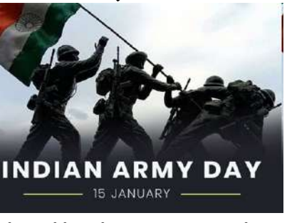
INDIAN ARMY DAY 15 JANUARY

દર વર્ષે ૧૫ જાન્યુઆરીએ આર્મી દિવસ ઉજવવામાં આવે છે. તે પાછળનું કારણ એ છે કે ૧૯૪૭માં આ દિવસે, બ્રિટિશ લેફ્ટનન્ટ જનરલ કે.એમ. કારિઅપ્પા ભારતમાં છેલ્લા બ્રિટીશ કમાન્ડર-ઇન-ચીફ જનરલ ક્લિસ્ટિયન બુચરની જગ્યાએ ભારતીય સેનાનાં કમાન્ડર-ઇન-ચીફ બન્યા હતા. કે.એમ. કારિઅપ્પા એવા પ્રથમ અધિકારી હતા કે જેને ફીલ્ડ માર્શલનું બિરુદ આપવામાં આવ્યું હતું. તેમના યુદ્ધ કૌશલ્ય અને વીરતાને જોઈને ભારત ઉપર વિદેશોમાં પણ તેમને સન્માનિત કરવામાં આવ્યા છે. તેમણે ૧૯૪૭માં ભારત-પાક યુદ્ધમાં ભારતીય સેનાનું નેતૃત્વ કર્યું હતું. ૨૮ જાન્યુઆરી ૧૯૮૯માં ક્ષત્રીકના કુર્મીમાં શનિવસંધિ નામના સ્થળે જન્મેલા ફીલ્ડ માર્શલ કારિઅપ્પાએ માત્ર ૨૦ વર્ષની વયે બ્રિટિશ ઈન્ડિયન આર્મીમાં નોકરી શરૂ કરી હતી. તેમના પિતા કોડેરા