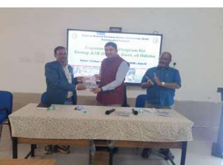
ઓડિશા સરકારના ઉચ્ચ અધિકારીશ્રીઓએ અમરેલી સ્થિત કોલેજ ઓફ નેચરલ ફર્મિંગ ખાતે પ્રાકૃતિક ખેતીના પ્રાયોગિક ફાર્મની મુલાકાત લીધી

આ મુલાકાતનો મુખ્ય હેતુ ગુજરાત રાજ્યમાં સફળતાપૂર્વક અમલમાં રહેલી પ્રાકૃતિક ખેતી પદ્ધતિઓનો ઊંડાણપૂર્વક અભ્યાસ કરી તેને ઓડિશા રાજ્યમાં અમલી બનાવવાનો હતો.