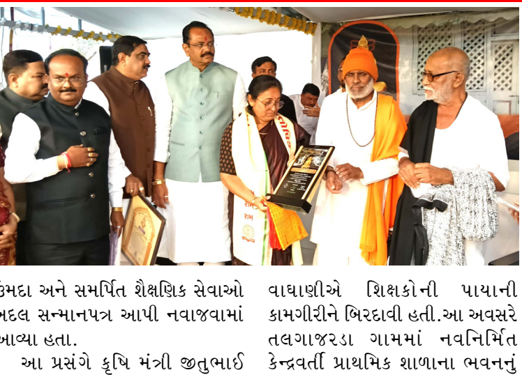
ઉમદા અને સમર્પિત શૈક્ષણિક સેવાઓ બદલ સન્માનપત્ર આપી નવાજવામાં આવ્યા હતા. આ પ્રસંગે કૃષિ મંત્રી જીતુભાઈ

ભાવનગર, તા. ૧૫ મહુવા તાલુકાના તલગાજરડા ખાતે મકરસંક્રાંતિના પવિત્ર અવસરે શિક્ષણ, સંસ્કાર અને સેવા ભાવનાનો ત્રિવેણી સંગમ સર્જાયો હતો. પૂ. મોરારીબાપુના વરદ્ હસ્તે તથા રાજ્યના કૃષિ મંત્રી જીતુભાઈ વાઘાણીની વિશેષ ઉપસ્થિતિમાં ગુજરાત રાજ્યના ૩૬ શ્રેષ્ઠ પ્રાથમિક શિક્ષકોને પ્રતિષ્ઠિત 'ચિત્રકૂટ એવોર્ડ'થી સન્માનિત કરવામાં આવ્યા હતા. ગુજરાત રાજ્ય પ્રાથમિક શિક્ષક સંઘ દ્વારા પસંદ કરાયેલા રાજ્યના દરેક જિલ્લાના એક-એક તેમજ નગરપાલિકા વિસ્તારના શ્રેષ્ઠ શિક્ષકો મળી કુલ ૩૬ શિક્ષકોને તેમની