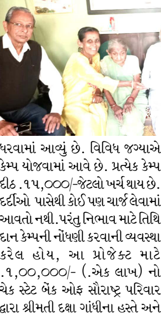
રેડક્રોસ, ભાવનગર દ્વારા કેન્સર નિદાન માટે, વિશેષ કરીને નાના અને અંતરિયાળ ગ્રામ્ય વિસ્તારના લોકોને ધ્યાનમાં રાખી ને એક અભિયાન હાથ

ભાવનગર, તા. ૧૫ સમાજ પ્રત્યેનું ઋણ ચૂકવવાના ભાગરૂપે હાલમાં જ ઈન્ડિયન રેડક્રોસ સોસાયટી ભાવનગરને જેનબર્કટ કંપની દ્વારા કેન્સર સ્કીનીંગ વેન ભેટ આપવામાં આવી છે જે વેન મારફતે શહેર અને જિલ્લામાં કેન્સર સ્કીનીંગ કેમ્પ માટે અને વેનના નિભાવ માટે કોઈપણ યાદગાર દિવસે તિથિ દાન પ્રોજેક્ટ અમલમાં મુકવામાં આવેલ છે જેના મારફતે અલગ અલગ કુલ સાત કેમ્પ માટે સ્ટેટ બેન્ક ઓફ સૌરાષ્ટ્ર કર્મચારી પરિવાર દ્વારા રૂ. એક લાખનું અનુદાન આપવામાં આવ્યું છે.