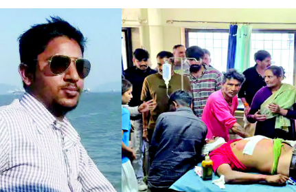
બે પરિવારોનો લાકડી અને તીક્ષ્ણ હથિયારો વડે સામસામે હુમલો, ધાયલોને વર્ષ જતાં હોસ્પિટલે ભીડ, પોલીસ દોડી ગઈ

ગોંડલ:રાજ્યભરમાં જ્યારે મકર સંક્રાંતિની ઉજવણી થઈ રહી હતી, ત્યારે ગોંડલના ભગવતપરા ગોંડ વાળી શેરીમાં માતમ છવાઈ ગયો હતો. પતંગ ચગાવવા જેવી નજીવી બાબતે એક જ જાતિના બે પક્ષો સામસામે આવી જતાં તીક્ષ્ણ હથિયારો વડે હુમલો કરવામાં આવ્યો હતો. આ સંઘર્ષમાં એક યુવાનની હત્યા થતા તહેવારનો આનંદ શોકમાં ફેરવાયો હતો. મકરસંક્રાંતિના દિવસે ભગવતપરામાં બે પરિવારો પોતપોતાના મકાનની અગાસી પર પતંગ ચગાવી રહ્યા હતા. આ દરમિયાન કોઈ અગમ્ય કારણસર બંને પક્ષો વચ્ચે બોલાચાલી થઈ હતી. વિવાદ એટલો વચકો કે બંને પક્ષના લોકો લાકડી અને તીક્ષ્ણ હથિયારો સાથે શેરીમાં ઉતરી આવ્યા હતા.