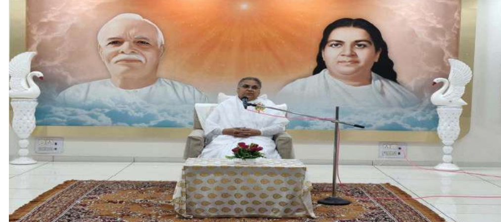
રાજકોટ, તા. ૧૨ ને વિશ્વભરમાં "યુવા દિવસ" તરીકે ઉજવવામાં આવે છે. કેમકે, ત્યારે યુવાનોના આદર્શ એવા સ્વામી વિવેકાનંદની જન્મ જયંતી હોય છે. દુનિયાભરમાં આ દિવસે ઘણા બધા કાર્યક્રમો થયા, જે પૈકી ગત તા. ૧૧ ના રોજ ફોર યુથ કાર્યક્રમમાં માર્ટિન્ડ હેર્સ, ઈમોશનલ એક્સલોરર, રિજિટલ ડીટોક્ષ, પર્પસ ધ એનર્જી જેવા વિભિન્ન ગેમ્સ દ્વારા વર્કશોપ કરવામાં આવ્યું હતું. આ સેમિનારમાં ૧૮ થી ૪૦ વર્ષના ૧૫૦થી વધુ ભાઈઓ-બહેનોએ લાભ લીધો.