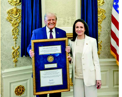
વોશિંગ્ટન વેનેઝુએલામાં ચાલી રહેલા ગંભીર રાજકીય સંકટ વચ્ચે, વિપક્ષી નેતા અને નોબેલ શાંતિ પુરસ્કાર વિજેતા મારિયા કોરિના મયાડો અને અમેરિકન પ્રમુખ ડોનાલ્ડ ટ્રમ્પ વચ્ચેની મુલાકાતે રાજકીય ગરમાવો વધારી દીધો છે. આ મુલાકાત બાદ મયાડોએ

નોબેલ શાંતિ પુરસ્કાર વિજેતા મારિયા કોરિના મયાડો અને અમેરિકન પ્રમુખ ડોનાલ્ડ ટ્રમ્પ વચ્ચેની મુલાકાતથી અમેરીકામાં રાજકીય ગરમાવો