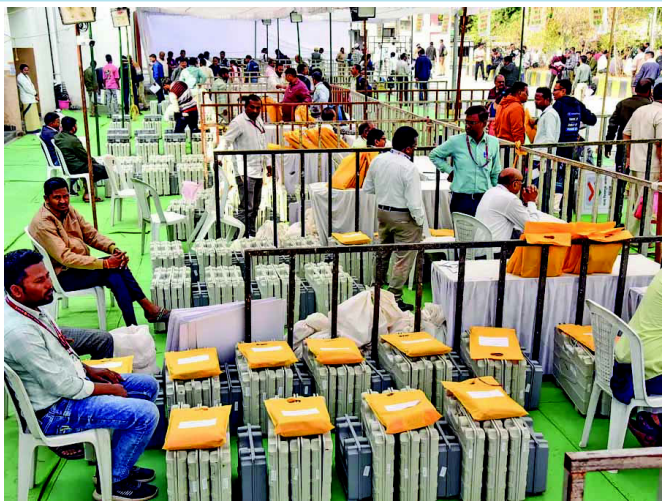
ભાજપ જીત્યો હતો. જ્યારે એનસીપીએ ૨ બેઠક જીતી એકનાથ શિંદેની શિવસેનાએ ૧૯ હતી. જેને લઈને વિપક્ષ ભારે

મુંબઈ મહારાષ્ટ્રમાં ચાર વર્ષના લાંબા વિલંબ બાદ યોજાયેલી ૨૯ નગર નિગમોની ચૂંટણીના પરિણામો આજે જાહેર થઈ રહ્યા છે. રાજ્યભરના ૮૯૩ વોર્ડમાં કુલ ૧૫,૮૩૧ ઉમેદવારોના ભાવિનો ફેંસલો આજે થશે. મતોની ગણતરી સવારે ૧૦ વાગ્યે શરૂ થઈ ગઈ છે અને બપોર પછી મુખ્ય પરિણામો આવવાની ધારણા છે. ઉલ્લેખનીય છે કે એનડીએ ગઠબંધન એટલે કે મહાયુતિ મહારાષ્ટ્રની સ્થાનિક એકમની ચૂંટણીમાં ૬૦થી વધુ બેઠકો પહેલાથી જ બિનહરિક્ષિ જીતી ચૂક્યું છે. તેમાં સૌથી વધુ બેઠક ૪૩