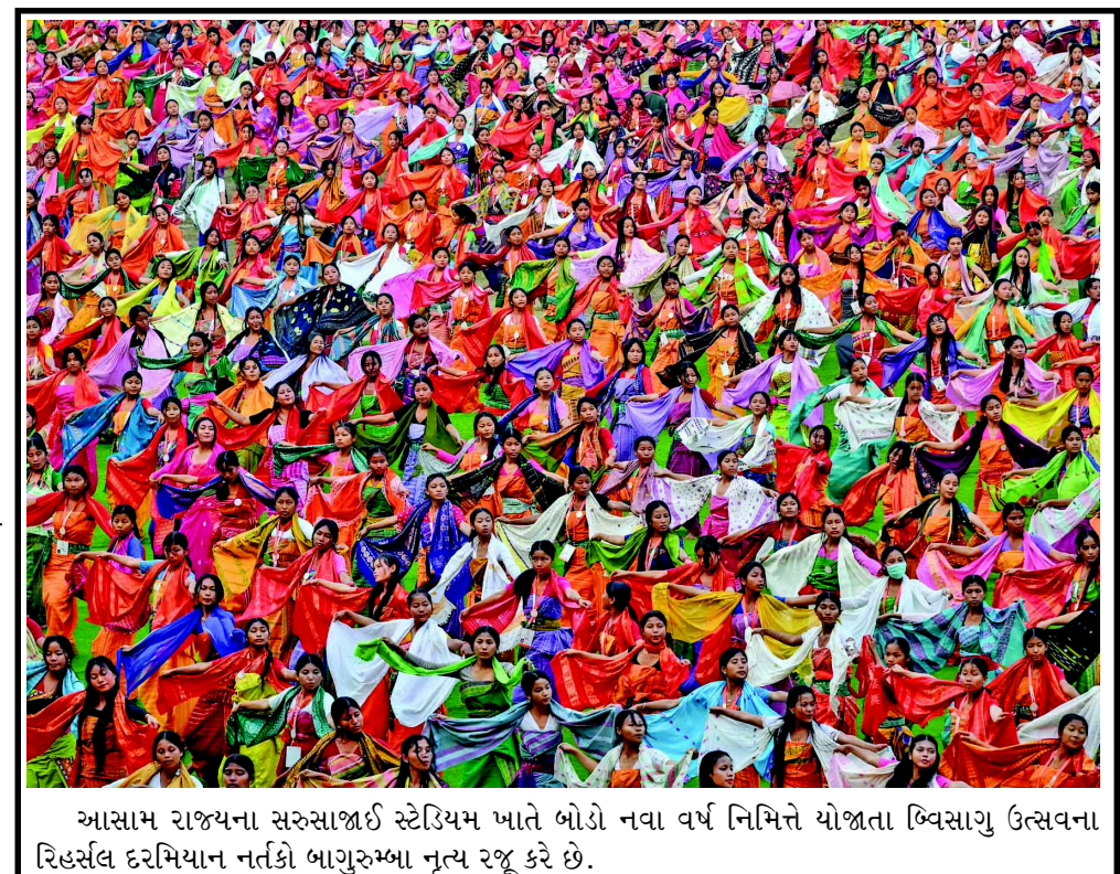
આસામ રાજ્યના સરસાજાઈ સ્ટેડિયમ ખાતે બોડો નવા વર્ષ નિમિત્તે યોજાતા બિવસાગુ ઉત્સવના રિહર્સલ દરમિયાન નર્તકો બાગુરુમ્મા નૃત્ય રજૂ કરે છે.