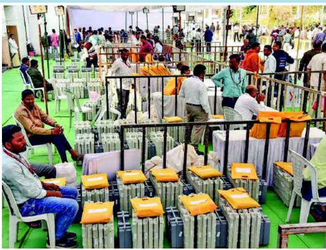
ભાજપ જીત્યો હતો. જ્યારે એનસીપીએ ૨ બેઠક જીતી એકનાથ શિંદેની શિવસેનાએ ૧૯ હતી. જેને લઈને વિપક્ષ ભારે

મુંબઈ મહારાષ્ટ્રમાં ચાર વર્ષના લાંબા વિલંબ બાદ યોજાયેલી ૨૯ નગર નિગમોની ચૂંટણીના પરિણામો આજે જાહેર થઈ રહ્યા છે. રાજ્યભરના ૮૯૩ વોર્ડમાં કુલ ૧૫,૮૩૧ ઉમેદવારોના ભાવિનો ફેંસલો આજે થશે. મતોની ગણતરી સવારે ૧૦ વાગ્યે શરૂ થઈ ગઈ છે અને બપોર પછી મુખ્ય પરિણામો આવવાની ધારણા છે. ઉલ્લેખનીય છે કે એનડીએ ગઠબંધન એટલે કે મહાયુતિ મહારાષ્ટ્રની સ્થાનિક એકમની ચૂંટણીમાં ૬૦થી વધુ બેઠકો પહેલાથી જ બિનહરિક જીતી ચૂક્યું છે. તેમાં સૌથી વધુ બેઠક ૪૩