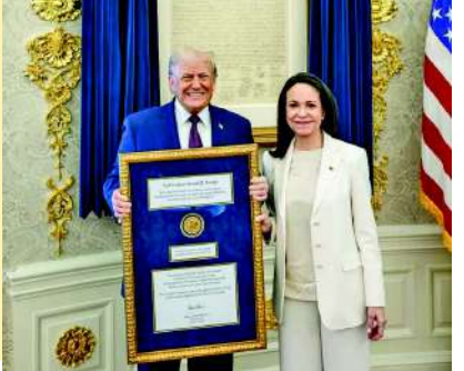
વોશિંગ્ટન વેનેઝુએલામાં ચાલી રહેલા ગંભીર રાજકીય સંકટ વચ્ચે, વિપક્ષી નેતા અને નોબેલ શાંતિ પુરસ્કાર વિજેતા મારિયા કોરિના મયાડો અને અમેરિકન પ્રમુખ ડોનાલ્ડ ટ્રમ્પ વચ્ચેની મુલાકાતે રાજકીય ગરમાવો વધારી દીધો છે. આ મુલાકાત બાદ મયાડોએ

નોબેલ શાંતિ પુરસ્કાર વિજેતા મારિયા કોરિના મયાડો અને અમેરિકન પ્રમુખ ડોનાલ્ડ ટ્રમ્પ વચ્ચેની મુલાકાતથી અમેરીકામાં રાજકીય ગરમાવો