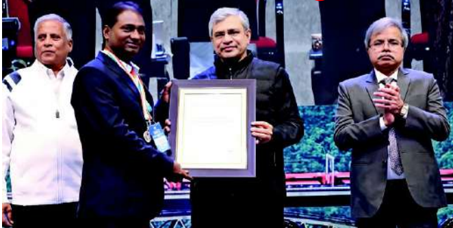
મોટા સ્ટેશન વચ્ચે વળાંક આવતા તેમણે એક વેગનનું ઢાંકણ ખુલ્લું રાખ્યું અને તાત્કાલિક ગાડી ઊભી રાખી દીધી હતી. તપાસ દરમિયાન વેગન નંબર ૦૮૮૮૬૬૮૧૮૧ સ્પંદ્ર માં ગેસ લીકેજ જોવા મળ્યું હતું. તેમની ત્વરિત સૂઝબૂજ અને