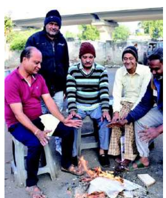
સાથો સાથ સુસવાટા મારતા બરફીલા ઠંડા પવને રીતસર લોકોને ધ્રુજાવ્યા છે. ગઈકાલે સમગ્ર દિવસ દરમિયાન ૨૦ થી ૨૫ ડિ.મી ની ઝડપે બરફીલો ઠંડો પવન ફૂંકાયો

જામનગર : જામનગર શહેર અને જિલ્લામાં મકરસંક્રાંતિના પર્વના દિવસે ઠંડીનો પારો નીચે ઉતરીને સિંગલ ડિજિટમાં આવી ગયો હતો, અને ૯.૫ ડિગ્રી તાપમાન નોંધાતાં મોસમનો સૌથી ઠંડો દિવસ રહ્યો હતો જેમાં ગઈકાલે થોડી સહિત જોવા મળ્યા બાદ આજે ફરીથી ઠંડીએ ભુક્કા કાઢ્યા છે, અને ઠંડીનો પારો ફરીથી નીચે સરકીને ૯.૫ ડિગ્રીએ પહોંચ્યો હોવાથી કાતિલ ઠંડી પડી રહી છે, અને શહેર-જિલ્લા ઉપરાંત પશુ પક્ષીઓ થર થર કાંપ્યા છે.