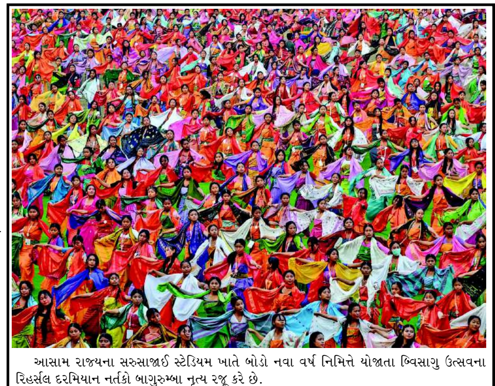
આસામ રાજ્યના સરુસાજાઈ સ્ટેડિયમ ખાતે બોડો નવા વર્ષ નિમિત્તે યોજાતા બિવસાગુ ઉત્સવના રિહર્સલ દરમિયાન નર્તકો બાગુરુમ્બા નૃત્ય રજૂ કરે છે.

રશિયન સરકાર રાષ્ટ્રીય સુરક્ષાના મામલામાં ઝીરો-ટોલરન્સ નીતિ ધરાવતી હોવાનું મંત્રાલયે કહ્યું હતું. ધોળકિયાને સ્મોલેન્સ્કાયા સ્ક્વેર ખાતે બોલાવવામાં આવ્યા હતા. જેથી તેમને જણાવી શકાય કે રશિયાના સક્ષમ અધિકારીઓને માહિતી મળી છે કે દૂતાવાસનો એક રાજદ્વારી કર્મચારી બ્રિટિશ ગુમચર એજન્સીઓ સાથે સંકળાયેલો છે. મંત્રાલયે જણાવ્યું કે આને ધ્યાને લેતાં અને ૧૯૬૧ના વિયેના કન્વેન્શન ઓન ડિપ્લોમેટિક રિલેશન્સની કલમ ૯ અનુસાર આ વ્યક્તિની માન્યતા રદ કરવામાં આવી રહી છે. તેણે બે અઠવાડિયાના સમયગાળામાં રશિયન ફેડરેશન છોડવું પડશે.