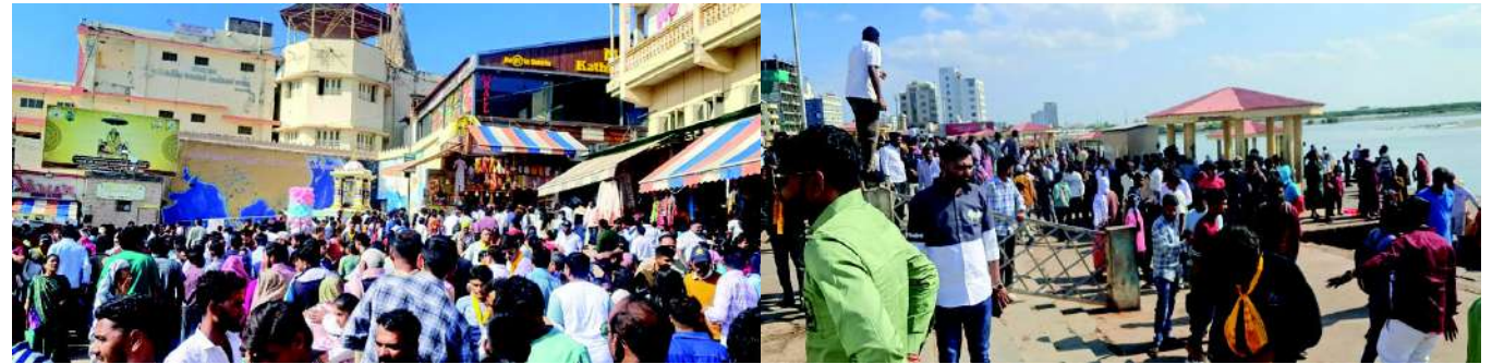
દારકા : મકરસંક્રાંતિના પાવન પર્વે યાત્રાધામ દારકાના દારકાપીશ જગતમંદિરે લાખો ભાવિકો શ્રીજીના દર્શનાર્થે ઉમટ્યા હતા. વહેલી સવારથી જ દારકાપીશ મંદિર પરિસરમાં ભાવિકોની ભારે ભીડ જોવા મળી હતી. સૂત્રોમાંથી મળતી માહિતી અનુસાર એક જ દિવસમાં એક લાખ વીસ હજારથી વધુ ભાવિકોએ ઠાકોરજીના દર્શનનો લાભ સીધા હાટો. દારકાપીશ સાથેનો વિશેષ શુંગાર યોજવામાં આવ્યો હતો.