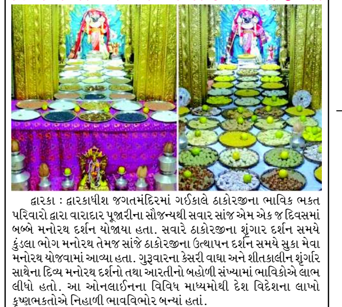
દારકા : દારકાપીશ જગતમંદિરમાં ગઈકાલે ઠાકોરજીના ભાવિક ભક્ત પરિવારો દ્વારા વારાદાર પૂજારીના સૌજન્યથી સવાર સાંજ એમ એક જ દિવસમાં બબ્બે મનોરથ દર્શન યોજાયા હતા. સવારે ઠાકોરજીના શુંગાર દર્શન સમયે કુંડલા ભોગ મનોરથ તેમજ સાંજે ઠાકોરજીના ઉત્થાપન દર્શન સમયે સુકા મેવા મનોરથ યોજવામાં આવ્યા હતા. ગુરૂવારના કેસરી વાઘા અને શીતલાલીન શુંગર સાથેના દિવ્ય મનોરથ દર્શનો તથા આરતીનો બહોળી સંખ્યામાં ભાવિકોએ લાભ લીધો હતો. આ ઓનલાઈનના વિવિધ માધ્યમોથી દેશ વિદેશના લાખો કૃષ્ણભક્તોએ નિહાળી ભાવવિભોર બન્યાં હતાં.