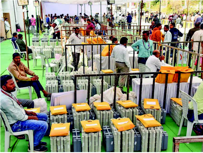
ભાજપ જીત્યો હતો. જ્યારે એનસીપીએ ૨ બેઠક જીતી એકનાથ શિંદેની શિવસેનાએ ૧૯ હતી. જેને લઈને વિપક્ષ ભારે

મુંબઈ મહારાષ્ટ્રમાં ચાર વર્ષના લાંબા વિલંબ બાદ યોજાયેલી ૨૯ નગર નિગમોની ચૂંટણીના પરિણામો આજે જાહેર થઈ રહ્યા છે. રાજ્યભરના ૮૯૩ વોર્ડમાં કુલ ૧૫,૮૩૧ ઉમેદવારોના ભાવિનો ફેંસલો આજે થશે. મતોની ગણતરી સવારે ૧૦ વાગ્યે શરૂ થઈ ગઈ છે અને બપોર પછી મુખ્ય પરિણામો આવવાની ધારણા છે. ઉલ્લેખનીય છે કે એનડીએ ગઠબંધન એટલે કે મહાયુતિ મહારાષ્ટ્રની સ્થાનિક એકમની ચૂંટણીમાં ૬૦થી વધુ બેઠકો પહેલાથી જ બિનહરિક જીતી ચૂક્યું છે. તેમાં સૌથી વધુ બેઠક ૪૩