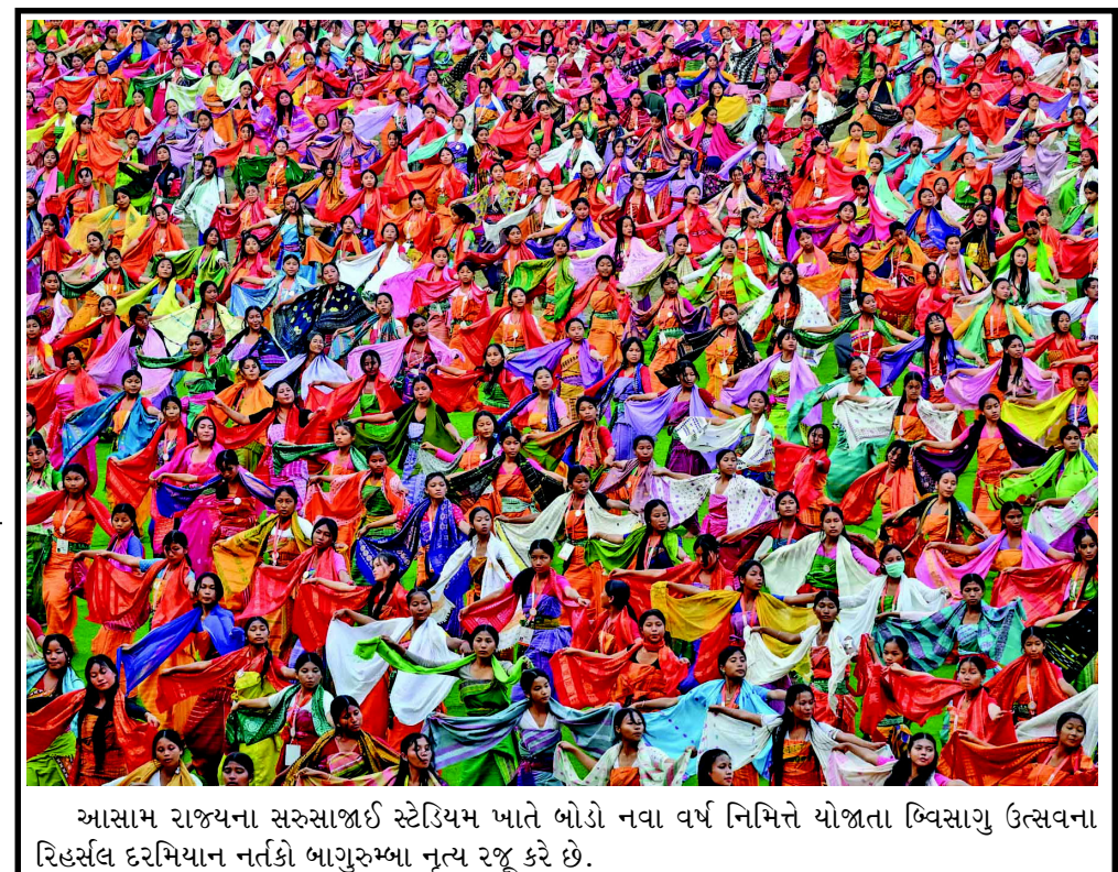
આસામ રાજ્યના સરુસાજાઈ સ્ટેડિયમ ખાતે બોડો નવા વર્ષ નિમિત્તે યોજાતા બિવસાગુ ઉત્સવના રિહર્સલ દરમિયાન નર્તકો બાગુરુમ્બા નૃત્ય રજૂ કરે છે.

રશિયન સરકાર રાષ્ટ્રીય સુરક્ષાના મામલામાં ઝીરો-ટોલરન્સ નીતિ ધરાવતી હોવાનું મંત્રાલયે કહ્યું હતું. ધોળકિયાને સ્મોલેન્સ્કાયા સ્ક્વેર ખાતે બોલાવવામાં આવ્યા હતા. જેથી તેમને જણાવી શકાય કે રશિયાના સક્ષમ અધિકારીઓને માહિતી મળી છે કે દૂતાવાસનો એક રાજદ્વારી કર્મચારી બ્રિટિશ ગુમચર એજન્સીઓ સાથે સંકળાયેલો છે. મંત્રાલયે જણાવ્યું કે આને ધ્યાને લેતાં અને ૧૯૬૧ના વિયેના કન્વેન્શન ઓન ડિપ્લોમેટિક રિલેશન્સની કલમ ૯ અનુસાર આ વ્યક્તિની માન્યતા રદ કરવામાં આવી રહી છે. તેણે બે અઠવાડિયાના સમયગાળામાં રશિયન ફેડરેશન છોડવું પડશે.