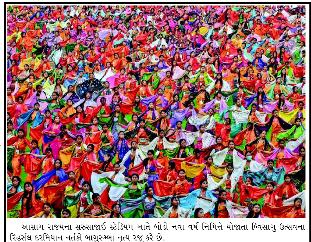
આસામ રાજ્યના સરસાજાઈ સ્ટેડિયમ ખાતે બોડો નવા વર્ષ નિમિત્તે યોજાતા બિવસાગુ ઉત્સવના રિહર્સલ દરમિયાન નર્તકો બાગુરુમ્બા નૃત્ય રજૂ કરે છે.