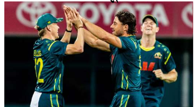
અંગે એક નિવેદનમાં કહ્યું, "મને લાગે છે કે સ્કેન પછી પરિસ્થિતિનો સંપૂર્ણ વિસ્તાર સ્પષ્ટ થશે, પરંતુ હાલમાં હું ટીક છું. બોલ મને વાગ્યાના ૧૦ સેકન્ડ પછી મને તે લાગ્યું, અને તે સમયે વધુ જોખમ લેવાનું યોગ્ય નહોતું. મને નથી લાગતું કે તે ગંભીર ઈજા છે, પરંતુ હું અત્યારે કોઈ જોખમ લેવા માંગતો નથી. હું ચોક્કસપણે કહી શકું છું કે હું ટી ૨૦ વર્લ્ડ કપની સાથે બિગ બેશ લીગની ફાઈનલ પણ રમીશ." ક્રિકેટ ઓસ્ટ્રેલિયા માર્ક્સ સ્ટોઈનિસની ઈજા પર નજીકથી નજર રાખી રહ્યું છે, કારણ કે વર્લ્ડ કપ માટેની ઓસ્ટ્રેલિયન ટીમમાં પહેલાથી જ બે ખેલાડીઓ, પેટ કમિન્સ અને ટિમ ડેવિડનો સમાવેશ થાય છે, જેમની ફિટનેસ હાલમાં પ્રશ્નાર્થમાં છે.

સિડની, ભારત અને શ્રીલંકા દ્વારા સંયુક્ત રીતે યોજાનારા આગામી ટી ૨૦ વર્લ્ડ કપ પહેલા ઓસ્ટ્રેલિયાનો તથા વ્યક્તિઓ વધી ગયો છે, જેમાં તેમના સ્ટાર ઓલરાઉન્ડર માર્ક્સ સ્ટોઈનિસની ઈજાના સમાચાર છે. સ્ટોઈનિસ હાલમાં ઓસ્ટ્રેલિયામાં રમાઈ રહેલી ફેન્સાઈઝ આધારિત ટી ૨૦ લીગ, બિગ બેશ લીગમાં મેલબોર્ન સ્ટાર્સ તરફથી રમી રહ્યો છે. ૧૩ જાન્યુઆરીએ ઓસ્ટ્રેલિયન ટીમની મેચમાં બેટિંગ કરતી વખતે તેને જમણા અંગૂઠામાં ઈજા થઈ હતી. સ્ટોઈનિસ તરત જ રિટાયર્ડ હટી ગયો અને પેલેવિયન પાછો ફર્યો. હવે, આગામી ટી ૨૦ વર્લ્ડ કપ પહેલા તેની ઈજાએ ઓસ્ટ્રેલિયન ટીમની ચિંતાઓમાં વધારો કર્યો છે. ઓસ્ટ્રેલિયન ટીમની મેચ પછી માર્ક્સ સ્ટોઈનિસે પોતાની ઈજા