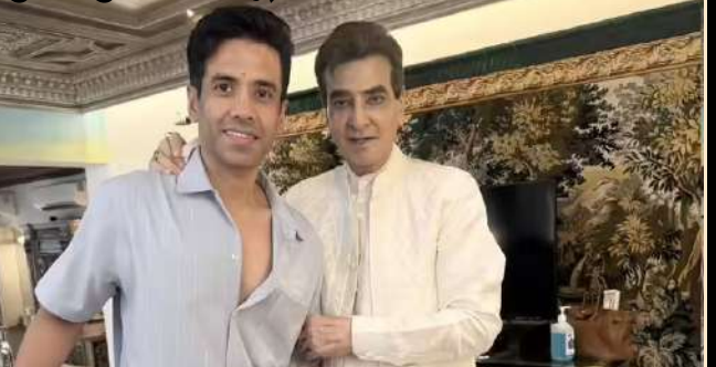
દસ્તાવેજો અનુસાર, એનટીટી ગ્લોબલ ડેટા સેન્ટર્સે તુષાર ઈન્ફા ડેવલપર્સ પ્રાઈવેટ લિમિટેડ પાસેથી બાલાજી આઈટી પાર્કમાં ૫૫૯.૨૪ કરોડમાં ૩૦,૧૯૫ ચોરસ મીટરથી વધુ જગ્યા ખરીદી હતી. તુષાર ઈન્ફા ડેવલપર્સ પ્રાઈવેટ લિમિટેડ તુષાર કપૂર અને જીતેન્દ્રની માલિકીની છે. નોંધણી