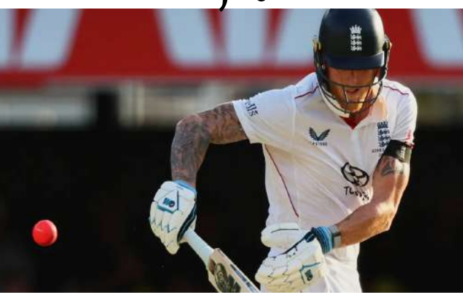
નવીદિલ્હી, ઈંગ્લેન્ડની ટીમે તાજેતરમાં ઓસ્ટ્રેલિયાનો પ્રવાસ પૂર્ણ કર્યો હતો, જ્યાં તેઓ ૨૦૨૫-૨૬ એશિયન શ્રેણી રમવાના હતા. આ પ્રવાસમાં રમાયેલી પાંચ ટેસ્ટ મેચમાંથી, ઈંગ્લેન્ડ ચાર હારી ગયું અને માત્ર એક જીત્યું. ઈંગ્લેન્ડ અને વેલ્સ ક્રિકેટ બોર્ડે ૨૦૨૬-૨૭ના ઓસ્ટ્રેલિયા પ્રવાસ માટે તેધારીઓ શરૂ કરી દીધી છે, જેમાં તેઓ આગામી ટેસ્ટ શ્રેણીમાં ગુલાબી બોલથી ટેસ્ટ મેચ રમવાનું ઠાણવાનો ઈરાદો ધરાવે છે.

ઓસ્ટ્રેલિયાએ અત્યાર સુધી વિશ્વ ક્રિકેટમાં ગુલાબી બોલથી સૌથી વધુ મેચ રમી છે, અને તેમનું વર્ચસ્વ સ્પષ્ટ થયું છે. બીબીસી સ્પોર્ટ્સના અહેવાલ મુજબ, ઈંગ્લેન્ડ અને વેલ્સ ક્રિકેટ બોર્ડે શ્રેણી સમાપ્ત થયા પછી વરિષ્ઠ અધિકારીઓ સાથેની આગામી બેઠકમાં ગુલાબી બોલથી ટેસ્ટ મેચ ન રમવાના તેમના નિર્ણયની જાણ ક્રિકેટ ઓસ્ટ્રેલિયાને કરી હતી. ૨૦૨૫-૨૬ એશિયનમાં, બ્રિસ્બેનના ગાબા સ્ટેડિયમમાં ગુલાબી બોલથી ટેસ્ટ મેચ રમાઈ હતી, જ્યાં ઈંગ્લેન્ડને એકતરફી હારનો સામનો કરવો પડ્યો હતો. ત્યારથી, ડેનાઈટ ટેસ્ટ મેચ ન રમવા અંગે ચર્ચાઓ તેજ થઈ ગઈ છે. ઈજા એ સ્પષ્ટતા કરી છે કે તે માન્યું નથી કે આ ફોર્મેટમાં ગુલાબી બોલથી ટેસ્ટ મેચમાં આગામી ઓસ્ટ્રેલિયન પ્રવાસ પર ગુલાબી બોલ ટેસ્ટ રમવા માંગતું નથી, ત્યારે ૨૦૨૭ માં મેલબોર્ન ક્રિકેટ ગ્રાઉન્ડની ૧૫૦મી વર્ષગાંઠ નિમિત્તે ઓસ્ટ્રેલિયા અને ઈંગ્લેન્ડ વચ્ચે ગુલાબી બોલ ટેસ્ટ મેચ રમવાનું નક્કી છે. ક્રિકેટ ઓસ્ટ્રેલિયાએ ઓગસ્ટ ૨૦૨૪ માં આ જાહેરાત કરી હતી. આ મેચ અંગે, એક ભૂતપૂર્વ ઓસ્ટ્રેલિયન ખેલાડીએ બીબીસી સ્પોર્ટ્સને જણાવ્યું હતું કે તેઓ વ્યક્તિગત રીતે માને છે કે આ મેચ પરંપરાગત ટેસ્ટ ક્રિકેટની જેમ લાલ બોલથી રમવી જોઈએ, અને ક્રિકેટ ઓસ્ટ્રેલિયાએ તેના નિર્ણય પર પુનઃવિચાર કરવો જોઈએ.