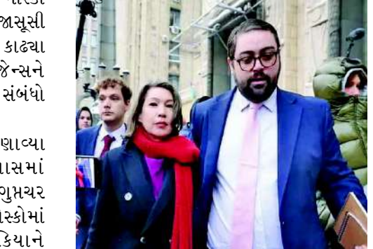
રશિયાના વિદેશ મંત્રાલયે એક નિવેદનમાં જણાવ્યું કે મોસ્કો રશિયન પ્રદેશ પર બ્રિટિશ વિશેષ સેવાઓના અધોષિત એજન્ટોની પ્રવૃત્તિઓને સહન નહીં કરે.