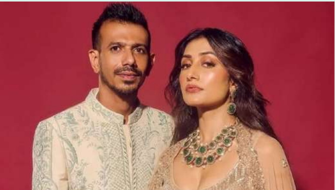
વાતચીત કે પ્રતિબદ્ધતા થઈ છે. નિવેદનમાં કહેવામાં આવ્યું છે કે, "યુઝવેન્દ્ર ચહલ કોઈપણ રિયાલિટી શોમાં ભાગ લઈ રહ્યા છે તે અંગે ફરતા અહેવાલોમાં કોઈ સત્ય નથી. આ બધા દાવાઓ માત્ર અટકળો અને ખોટા છે." તેમાં વધુમાં સ્પષ્ટતા કરવામાં આવી હતી કે ચહલનો તાજેતરના અહેવાલોમાં ઉલ્લેખિત શો સાથે કોઈ સંબંધ નથી, અને મીડિયા અને સોશિયલ મીડિયા વપરાશકર્તાઓને અપ્રમાણિત માહિતી શેર ન કરવા વિનંતી કરી છે. ધનશ્રી વર્માએ હજુ સુધી આ અફવાઓ પર કોઈ પ્રતિક્રિયા આપી નથી. ફિલ્મ નિર્માતા ફરાહ પાન

મુંબઈ, ક્રિકેટરે પોતે જ યુઝવેન્દ્ર ચહલ અને તેની ભૂતપૂર્વ પત્ની ધનશ્રી વર્મા આગામી રિયાલિટી શોમાં સાથે દેખાવા અંગે ચાલી રહેલી અટકળોનો અંત લાવી દીધો છે. તાજેતરમાં, એવા અહેવાલો સામે આવ્યા હતા કે ચહલ ધનશ્રી સાથે ઓન-સ્ક્રીન વાપસી કરતી વખતે રિયાલિટી શો "ધ પો" માં ભાગ લઈ શકે છે. આ સંભવિત પુનઃમિલનથી ચાહકોમાં ભારે ચર્ચા જાગી છે. જોકે, ચહલે એક ઈન્ટરવ્યુમાં સ્ટોરી દ્વારા આ અહેવાલોને સંપૂર્ણપણે ખોટા ગણાવ્યા હતા. તેમણે સ્પષ્ટતા કરી હતી કે તેમનો કોઈ રિયાલિટી શો સાથે કોઈ સંબંધ નથી, કે ન તો આવી કોઈ