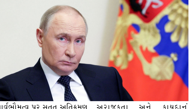
સાર્વભૌમત્વ પર સતત અતિક્રમણ થઈ રહ્યું છે. આ નિવેદન વેનેઝુએલા સામે અમેરિકાની તાજેતરની લારીજાનીનો પણ સમાવેશ થાય છે. ગેરકાયદેસર દખલગીરીનો ઉલ્લેખ કરે છે. પુતિને આરોપ લગાવ્યો કે ડઝનબંધ દેશો તેમની સાર્વભૌમત્વ,

રશિયન રાષ્ટ્રપતિ વ્લાદિમીર પુતિને ગ્રાન્ડ કેમલિન પેલેસના સેન્ટ એલેક્ઝાન્ડર હોલમાં નવા વિદેશી રાજદૂતો માટે ઓળખપત્રો પ્રાપ્ત કરવા માટેના સમારોહમાં એક મજબૂત સંદેશ આપ્યો. તેમણે કહ્યું કે વૈશ્વિક પરિસ્થિતિ ઝડપથી બગડી રહી છે અને વિશ્વ ખૂબ જ ખતરનાક વળાંક પર પહોંચી ગયું છે. વેનેઝુએલા સામે અમેરિકાની કાર્યવાહી અને ટ્રમ્પ દ્વારા ઈરાનને સતત ધમકીઓ આપ્યા બાદ પુતિનેનો આ સંદેશ આવ્યો છે. જોકે તેમણે અમેરિકા કે ટ્રમ્પનું નામ લીધું ન હતું, પરંતુ તેમણે ગર્ભિત રીતે બંને પર નિશાન સાધ્યું હતું. પુતિને કહ્યું કે ઘણા દેશોની