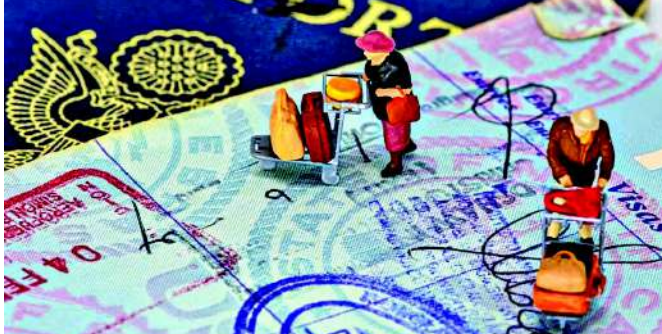
કોન્સ્યુલર સહાય જેવા કારણો આગળ ધરીને તેને "હાઈ એલ્ટ" કેટેગરીમાં રાખવામાં આવ્યું છે. ભારતને પાકિસ્તાન, ઈરાન, યમન, સીરિયા, અફઘાનિસ્તાન અને દક્ષિણ સુદાન જેવા સંઘર્ષસ્ત્ર દેશોની સમાન શ્રેણીમાં સ્થાન આપવામાં આવ્યું

ઓટાવા, કેનેડાના વડા પ્રધાન માર્ક કાર્નીની ભારત મુલાકાત પૂર્વે જ કેનેડા સરકારે પોતાની ઈન્ટરનેશનલ ટ્રાવેલ એડવાઈઝરી અપડેટ કરી છે. આ એડવાઈઝરીના વિસ્તરમાં ભારતને "હાઈ એલ્ટ"ની શ્રેણીમાં મૂકવામાં આવ્યું છે. કેનેડા સરકારની સત્તાવાર વેબસાઈટ પર જાન્યુઆરીના બીજા સપ્તાહમાં જારી કરાયેલા એડવાઈસમાં જણાવ્યાનુસાર, ભારતમાં રાજકીય અસ્થિરતા, સુરક્ષા જોખમો અને મર્યાદિત