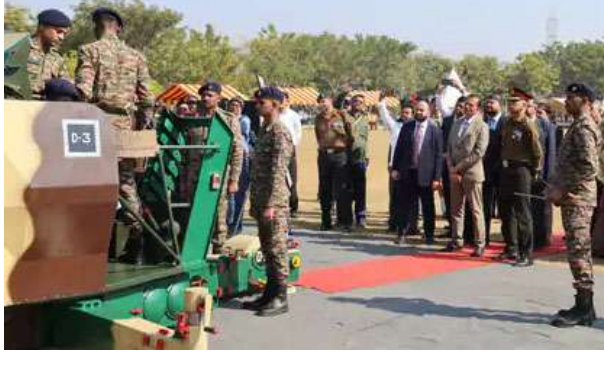
ગૌરવ બગ્ગા, જેને 'ગોલ્ડન કટાર ડિવિઝન' તરીકે ઓળખવામાં આવે છે, મુખ્ય અતિથિ તરીકે ઉપસ્થિત રહ્યા હતા. આ અવસરે પ્રોફેસર ડૉ. બિમલ એન. પટેલે જણાવ્યું હતું કે, "આ પ્રકારની પહેલ અકાદમી અને સશસ્ત્ર દળો વચ્ચેનો સેતુ મજબૂત કરે છે અને યુવાનોમાં રાષ્ટ્રીય સુરક્ષા તથા સંરક્ષણ તૈયારી અંગે જાગૃતિ પેદા કરે છે." મેજર જનરલ ગૌરવ બગ્ગાએ યુવાનોને સંબોધતાં જણાવ્યું હતું કે, "સંરક્ષણ ટેકનોલોજીનો પરિચય અને વિદ્યાર્થીઓ વચ્ચેની પરસ્પર ચર્ચા સાથે થયું, જેના દ્વારા નાગરિક-સૈન્ય સંબંધોને વધુ મજબૂતી મળી.

ગાંધીનગર, રાષ્ટ્રીય રક્ષા યુનિવર્સિટી (આરઆરયુ), જે રાષ્ટ્રીય મહત્વની સંસ્થા છે, તેણે ગુરુવારે ગાંધીનગરમાં તેના કેમ્પસમાં આર્માર્ડેડ નિમિત્તે શસ્ત્ર અને ગોળા બારૂદનું સ્ટેટિક ડિસ્પ્લે યોજ્યું હતું. પરંતુ ગ્રાઉન્ડ ખાતે યોજાયેલા આ કાર્યક્રમમાં ભારતીય સેનાની કામગીરી શક્તિ અને આધુનિક ટેકનોલોજીનું પ્રદર્શન કરવામાં આવ્યું હતું, સાથે જ સેનાના શોર્સ અને સેવાને શ્રદ્ધાંજલિ આપવામાં આવી હતી. કાર્યક્રમનું નેતૃત્વ રાષ્ટ્રીય રક્ષા યુનિવર્સિટીના કુલપતિ પ્રોફેસર ડૉ. બિમલ એન. પટેલ દ્વારા કરવામાં આવ્યું હતું. ૧૧ ડિવિઝનના જનરલ ઓફિસર કમાન્ડિંગ મેજર જનરલ