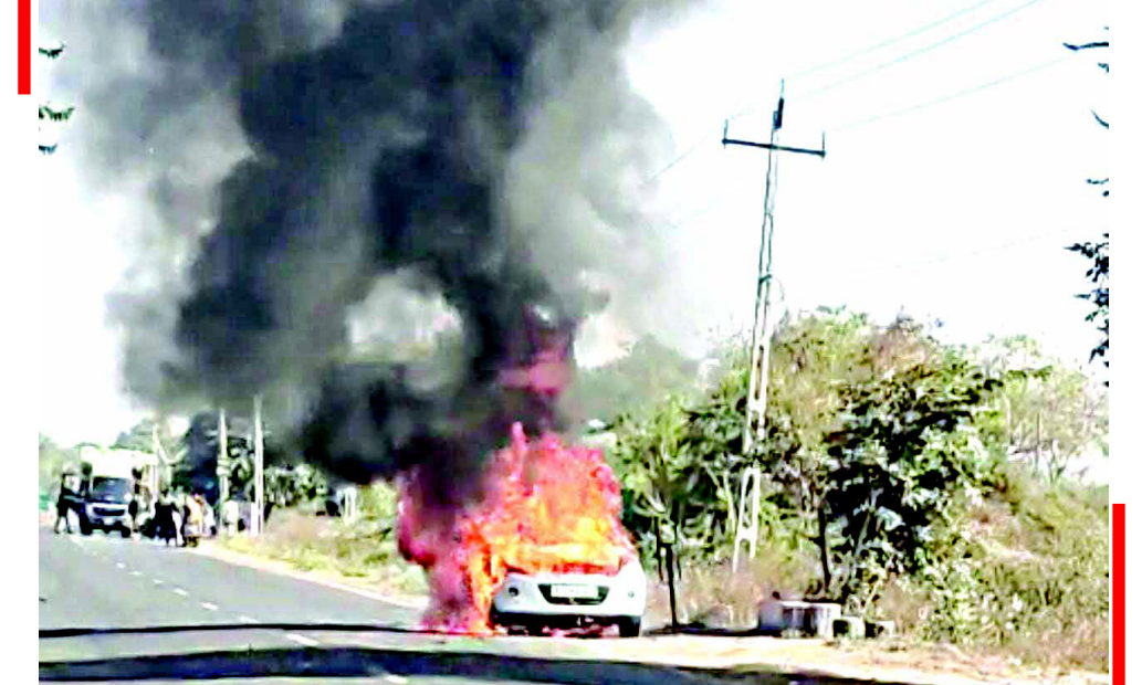
ગારિયાધાર-ટીઆઇ પાટિયા વિસ્તારમાં કારમાં અચાનક વિકરાળ આગ લાગી હતી. મળતી માહિતી પ્રમાણે આગને કારણે રસ્તા પર ટ્રાફિક જામ જેવી સ્થિતિ સર્જાઈ હતી. સદનસીબે કોઈ જાનહાની થઈ નથી. ઘટનાની વધુ વિગતોની રાહ જોવાઈ રહી છે.