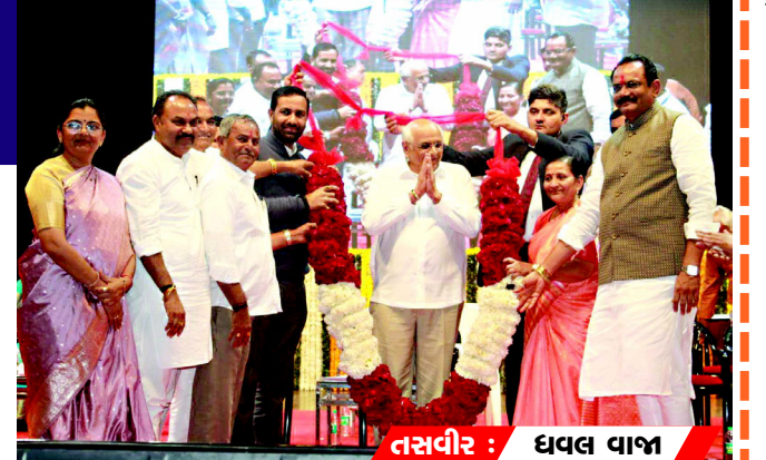
તસવીર : ધવલ વાજા તરીકે અપનાવી ભાવનગર સિટિઝન સેન્ટ્રિક ગવર્નન્સની દિશામાં અગ્રેસર રહેશે. કેન્દ્રિય રાજ્યમંત્રી નિમુબેન બાંભણીયાએ જણાવ્યું હતું કે,

કરવામાં આવી છે, જ્યારે માત્ર છેલ્લા ચાર વર્ષમાં ભાવનગર મહાનગરને રૂ. ૮૫૪ કરોડ જેટલી રકમ વિકાસલક્ષી કામો માટે ફાળવવામાં આવી છે. મુખ્યમંત્રીએ જણાવ્યું કે, તાજેતરમાં રાજકોટ ખાતે યોજાયેલી સૌરાષ્ટ્ર-કચ્છ ક્ષેત્રમાં ભાવનગર શહેર અને જિલ્લાના પોટેન્શિયલને ધ્યાનમાં રાખીને રૂ. ૬૦ હજાર કરોડથી વધુના રોકાણ માટે ૩૦૬ એમ.ઓ.યુ. થયા છે. આ ઉદ્યોગથી ભવિષ્યના શહેરીકરણને અવસર