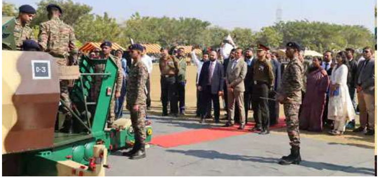
ગૌરવ બગ્ગા, જેને 'ગોલ્ડન કટાર ડિવિઝન' તરીકે ઓળખવામાં આવે છે, મુખ્ય અતિથિ તરીકે ઉપસ્થિત રહ્યા હતા. આ અવસરે પ્રોફેસર ડૉ. બિમલ એન. પટેલે જણાવ્યું હતું કે, "આ પ્રકારની પહેલ અકાદમી અને સશસ્ત્ર દળો વચ્ચેનો સેતુ મજબૂત કરે છે અને યુવાનોમાં રાષ્ટ્રીય સુરક્ષા તથા સંરક્ષણ તૈયારી અંગે જાગૃતિ પેદા કરે છે." મેજર જનરલ ગૌરવ બગ્ગાએ યુવાનોને સંબોધતાં જણાવ્યું હતું કે, "સંરક્ષણ ટેકનોલોજીનો પરિચય અને વિદ્યાર્થીઓ વચ્ચેની પરસ્પર ચર્ચા સાથે થયું, જેના દ્વારા નાગરિક-સૈન્ય સંબંધોને વધુ મજબૂતી મળી.

ગાંધીનગર, રાષ્ટ્રીય રક્ષા યુનિવર્સિટી (આરઆરયુ), જે રાષ્ટ્રીય મહત્વની સંસ્થા છે, તેણે ગુરુવારે ગાંધીનગરમાં તેના કેમ્પસમાં આર્મી ડે નિમિત્તે શસ્ત્ર અને ગોળા બારૂદનું સ્ટેટિક ડિસ્પ્લે યોજ્યું હતું. પરંતુ ગ્રાઉન્ડ ખાતે યોજાયેલા આ કાર્યક્રમમાં ભારતીય સેનાની કામગીરી શક્તિ અને આધુનિક ટેકનોલોજીનું પ્રદર્શન કરવામાં આવ્યું હતું, સાથે જ સેનાના શોર્સ અને સેવાને શ્રદ્ધાંજલિ આપવામાં આવી હતી. કાર્યક્રમનું નેતૃત્વ રાષ્ટ્રીય રક્ષા યુનિવર્સિટીના કુલપતિ પ્રોફેસર ડૉ. બિમલ એન. પટેલ દ્વારા કરવામાં આવ્યું હતું. ૧૧ ડિવિઝનના જનરલ ઓફિસર કમાન્ડિંગ મેજર જનરલ