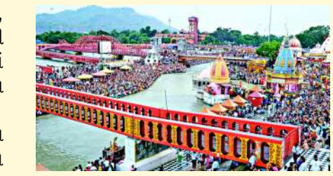
દરમિયાન, મ્યુનિસિપલ કોર્પોરેશન હેઠળ એક મ્યુનિસિપલ કાયદો ઘડવામાં આવ્યો હતો, જેના કારણે બિન-હિન્દુઓને હરિદ્વારમાં હર કી પૌડીમાં પ્રવેશવા પર પ્રતિબંધ મૂકવામાં આવ્યો હતો. તેમણે કહ્યું કે લોકો આ કાયદાથી સંપૂર્ણપણે વાકેફ ન હતા. તેથી, ગંગા સભાએ આ માહિતી