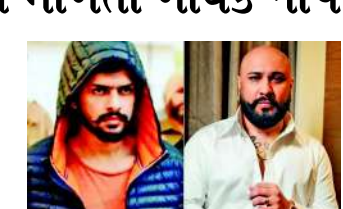
મોહલાલીમાં આવ્યું હતું. અગાઉ, દિલનૂરને ૫ જાન્યુઆરીએ બે ફોન આવ્યા હતા, પરંતુ દિલનૂરને તેનો જવાબ આપ્યો ન હતો. ૬ જાન્યુઆરીના રોજનો ફોન પણ વિદેશી નંબર પરથી આવ્યો હતો. પંજાબી ગાયક દિલનૂરે મોહલાલીના જીજી પાસે ફરિયાદ નોંધાવી છે. ફરિયાદ મુજબ, તેણીને વિદેશી નંબર પરથી ધમકીઓ મળી રહી છે. પોતાને આરજૂ બિશ્નોઈ તરીકે ઓળખાવનાર કોલરે ગાયક દિલનૂરને તેના મિત્ર, બોલીવૂડ અને પંજાબી ગાયક બી. પ્રાક માટે ૧૦ કરોડ રૂપિયાની ખંડણીનો સંદેશ પહોંચાડવા કહ્યું. ફોન કરનારે બી. પ્રાકને ધમકી આપી હતી કે જો એક અઠવાડિયામાં ખંડણી ચૂકવવામાં નહીં આવે તો તેને ગંભીર નુકસાન પહોંચાડવામાં આવશે.

મોહાલી, પ્રખ્યાત પંજાબી અને બોલિવૂડ ગાયક બી પ્રાકને ધમકીઓ મળી છે. કુખ્યાત લોરેન્સ બિશ્નોઈ ગેંગે ગાયક પાસેથી ૧૦ કરોડ રૂપિયાની ખંડણી માંગી છે. યૈસા ન ચૂકવવા પર ગંભીર પરિણામોની ધમકી આપવામાં આવી છે.