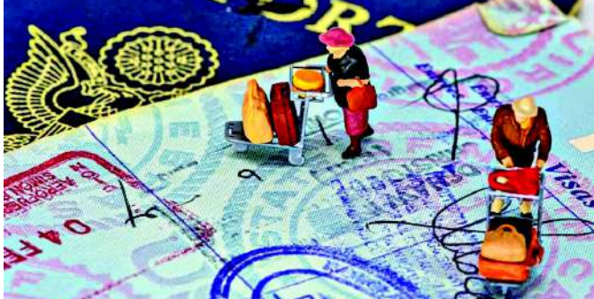
કોન્સ્યુલર સહાય જેવા કારણો આગળ ધરીને તેને "હાઈએલ્ટ" કેટેગરીમાં રાખવામાં આવ્યું છે. ભારતને પાકિસ્તાન, ઈરાન, યમન, સીરિયા, અફઘાનિસ્તાન અને દક્ષિણ સુદાન જેવા સંઘર્ષગ્રસ્ત દેશોની સમાન શ્રેણીમાં સ્થાન આપવામાં આવ્યું

ઓટાવા - કેનેડાના વડા પ્રધાન માર્ક કાર્નીની ભારત મુલાકાત પૂર્વે જ કેનેડા સરકારે પોતાની ઈન્ટરનેશનલ ટ્રાવેલ એડવાઈઝરી અપડેટ કરી છે. આ એડવાઈઝરીના વિસ્તરમાં ભારતને "હાઈ એલ્ટ"ની શ્રેણીમાં મૂકવામાં આવ્યું છે. કેનેડા સરકારની સત્તાવાર વેબસાઈટ પર જાન્યુઆરીના બીજા સપ્તાહમાં જારી કરાયેલા એડવાઈઝરીમાં જણાવ્યાનુસાર, ભારતમાં રાજકીય અસ્થિરતા, સુરક્ષા જોખમો અને મર્યાદિત