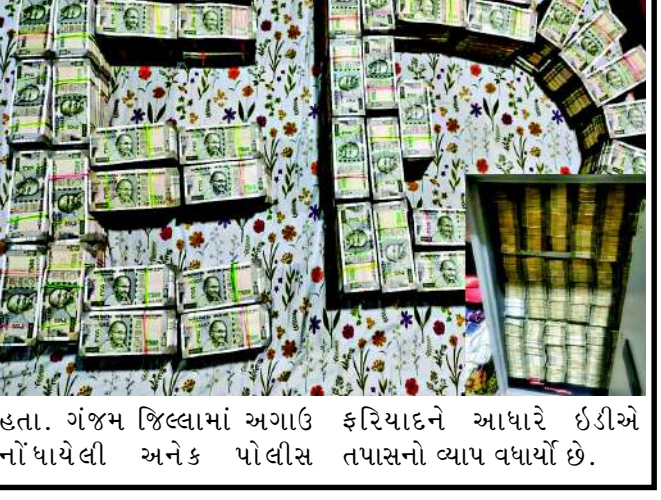
હતા. ગંજમ જિલ્લામાં અગાઉ ફરિયાદને આધારે ઈડીએ નોંધાયેલી અનેક પોલીસ તપાસનો વ્યાપ વધાર્યો છે.

તિજોરીને કરોડોનું નુકસાન પહોંચાડ્યું હતું. કેગના અહેવાલ બાદ આ કોલ્લાંડની ગંભીરતા સામે આવી હતી, જેના આધારે ઈડીએ 'મની લોન્ડરિંગ'નો કેસ દાખલ કર્યો છે. આ સમગ્ર ખેલમાં અનેક મોટા નેતાઓ, દલાલો અને ગુનાઈત પ્રવૃત્તિ ધરાવતા માફિયાઓ સામેલ છે. તેઓ સ્થાનિક રહેવાસીઓને ડરાવી-ધમકાવીને ગેરકાયદે રીતે ખનિજનું ઉત્પાન કરી રહ્યા