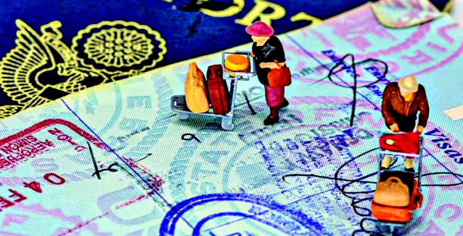
કોન્સ્યુલર સહાય જેવા કારણો આગળ ધરીને તેને "હાઈ એલ્ટ" કેટેગરીમાં રાખવામાં આવ્યું છે. ભારતને પાકિસ્તાન, ઈરાન,

ઓટાવા કેનેડાના વડા પ્રધાન માર્ક કાર્નીની ભારત મુલાકાત પૂર્વે જ કેનેડા સરકારે પોતાની ઈન્ટરનેશનલ ટ્રાવેલ એડવાઈઝરી અપડેટ કરી છે. આ એડવાઈઝરીના વિસ્તરમાં ભારતને "હાઈ એલ્ટ"ની શ્રેણીમાં મૂકવામાં આવ્યું છે. કેનેડા સરકારની સત્તાવાર વેબસાઈટ પર જાન્યુઆરીના બીજા સપ્તાહમાં જાહેર કરાયા અહેવાલમાં જણાવ્યાનુસાર, ભારતમાં રાજકીય અસ્થિરતા, સુરક્ષા જોખમો અને મર્યાદિત