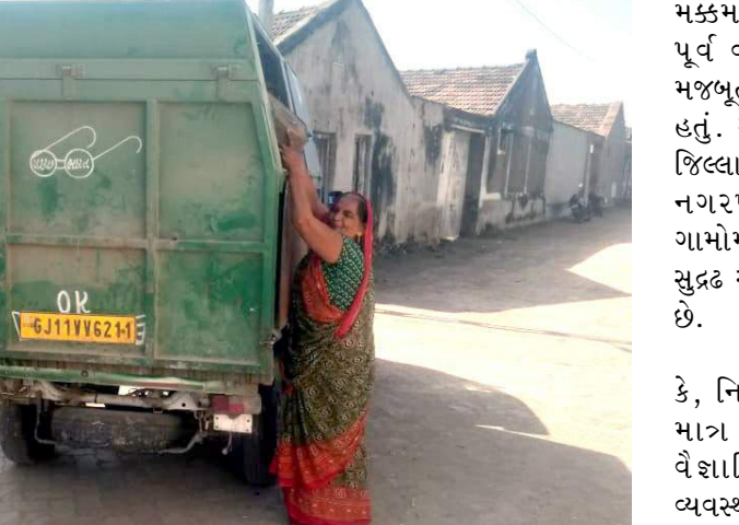
અમરેલી જિલ્લા વહીવટી તંત્ર નવી કિતિજો સર કરી રહ્યો છે. 'અંચોદય' અને 'સુશાસન'ના મંત્રને

મકમ નિર્ધાર કરવામાં આવ્યો છે. પૂર્વ વડાપ્રધાન અટલજીએ હંમેશા મજબૂત ગ્રામીણ માળખાનું સ્વપ્ન જોયું હતું. આ સ્વપ્ને સાકાર કરવા માટે નગરપાલિકા વિસ્તારના ૧૫૬ ગામોમાં ડોર-ટુ-ડોર કચરા કલેક્શનનું સુદ્રઢ આયોજન હાથ ધરવામાં આવ્યું છે. અત્રે એ પણ ઉલ્લેખનીય છે કે, નિર્મણ ગુજરાત ૨.૦ અભિયાન માંગ ધન કચરાનું ડોર-ટુ-ડોર વૈજ્ઞાનિક ઢબે કલેક્શન અને વ્યવસ્થાપન સુધી જ મર્યાદિત નથી! પરંતુ અમરેલીમાં તેનું મિશન મંગલમ યોજના સાથે પણ જોડાણ છે. મિશન મંગલમની બહેનોએ કચરાના ઢગલામાં રોજગાર અને આર્થિક