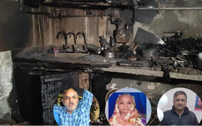
તેમના ઘર તરફ જવા લાગ્યા, પરંતુ લોકોએ તેમને રોકવા માટે સમજાવ્યા. રેસિડેન્સીમાં થોડીક સેકન્ડમાં બે વિસ્ફોટ થયા. સેંકડો લોકો ત્યાં ભેગા થયા. ઘરમાંથી નીકળતા ધુમાડા અને જવાબાઓને કારણે બીજા માળે બચાવ કાર્યમાં વિલંબ થયો. સાંકડી સીડીએ વધુ મુશ્કેલીઓ ઉભી કરી. આગને કાબુમાં લેવામાં ફાયર વિભાગને લગભગ એક કલાકનો સમય લાગ્યો.