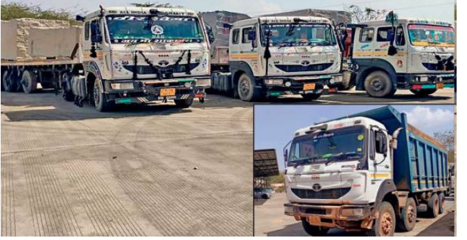
કાઠવામાં આવી હતી અને સ્થળ પર કાર્યવાહી કરવામાં આવી હતી. ખોરાવિશાલ પોલીસ સ્ટેશન વિસ્તાર: કાલવડ તાલુકાના બાવડી ગામમાં ગેરકાયદેસર રીતે ચૂનાના પથ્થરનું ખોદકામ કરતી વખતે બે ખોદકામ મશીન અને ત્રણ ટ્રેક્ટર ટ્રોલી જપ્ત કરવામાં આવી હતી. ફાગી પોલીસ સ્ટેશન વિસ્તાર: ચૂનાના ગેરકાયદેસર પરિવહનમાં સામેલ એક ટ્રેક્ટર ટ્રોલી જપ્ત કરવામાં આવી હતી. પરિવહન માટે એક ડમ્પર ટ્રક અને બે ટ્રેક્ટર ટ્રોલી જપ્ત કરવામાં આવી હતી. કોટખાવડા પોલીસ સ્ટેશન વિસ્તાર: ચૂનાના ગેરકાયદેસર પરિવહન માટે બે ટ્રેક્ટર ટ્રોલી જપ્ત કરવામાં આવી હતી. ફાગી પોલીસ સ્ટેશન વિસ્તાર: ચૂનાના ગેરકાયદેસર પરિવહનમાં સામેલ એક ટ્રેક્ટર ટ્રોલી જપ્ત કરવામાં આવી હતી.

જયપુર, અરવલ્લી પર્વતમાળામાં ગેરકાયદેસર ખાણકામ અને ખનિજોના ગેરકાયદેસર પરિવહન સામે ઝુંબેશ શરૂ કરવામાં આવી છે. જયપુર જિલ્લા કલેક્ટર ડો. જોતેન્દ્ર કુમાર સોનીની સૂચના પર, જિલ્લા વહીવટીતંત્ર, ખનિજ વિભાગ અને પોલીસની સંયુક્ત ટીમોએ વિવિધ વિસ્તારોમાં દરોડા પાડ્યા હતા અને મોટી કાર્યવાહી હાથ ધરી હતી. આ કામગીરી દરમિયાન, ગેરકાયદેસર ખાણકામ અને પરિવહનમાં વપરાતા બે ખોદકામ મશીનો સહિત કુલ ૧૬ વાહનો જપ્ત કરવામાં આવ્યા હતા. અનેક પોલીસ સ્ટેશન વિસ્તારોમાં ગેરકાયદેસર પ્રવૃત્તિઓ શોધી