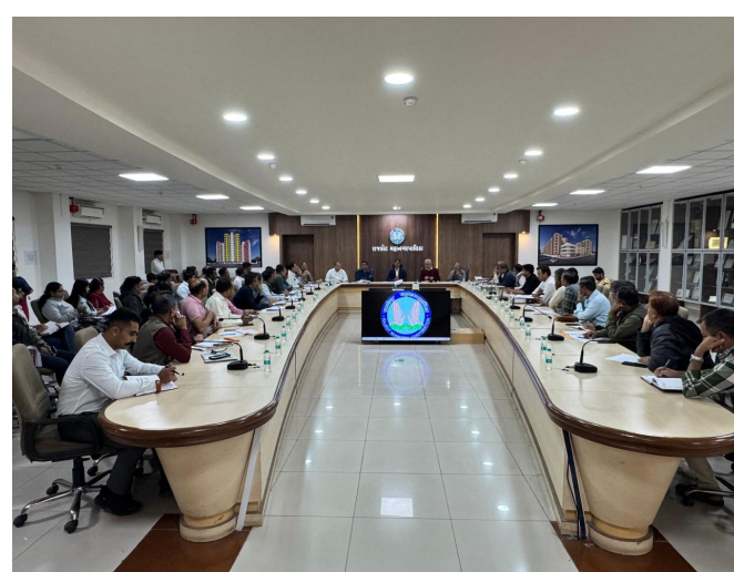
માહિતી ઉચ્ચ અધિકારીઓને રજૂ કરવાની સુચના આપવામાં આવી. તમામ ડેપ્યુટી મ્યુનિસિપલ કમિશનર શ્રી તથા સંલગ્ન અધિકારીઓને તેમના-તેમના ઝોનમાં પ્રગતિ હેઠળના વિકાસ કાર્યોની રૂબરૂ સ્થળ સમીક્ષા કરવામાં આવી. રાજકોટ મહાનગરપાલિકાની હેલ્પલાઈન નંબર-૧૫૫૩૦૪, વોટ્સએપ ચેટબોટ અને વેબસાઈટ પર નોંધાયેલી ફરિયાદોમાંથી દસ ફરિયાદો રેન્ડમ ચેક કરી તેની સ્થળ તપાસ કરવા અને નાગરિકો સાથે જનસંવાદ કરી સ્થળ પર ફરિયાદોના નિકાલની ખરાઈ કરી નિરાકરણ લાવવા, ત્રણેય ઝોનના નાયબ મ્યુનિસિપલ કમિશનર શ્રી અને વોર્ડ ઓફિસર્સને આદેશ

ફાઇલોના નિકાલ અંગે સુચના આપી હતી. એક અઠવાડિયા બાદ મ્યુનિસિપલ કમિશનર શ્રી ઝોન લેવેલે પેન્ડિંગ ફાઇલોના નિકાલ અંગે રીવ્યુ લેશે. આ ઉપરાંત તમામ મ્યુનિસિપલ કમિશનર શ્રીઓને સંબંધિત વિભાગોના અધિકારીશ્રીઓ સાથે સંકલન કરી ફાઇલોના સમયસર નિકાલ તેમજ ફાઇલ ટ્રેકિંગની વ્યવસ્થા કરવા માટે ૪૮ કલાકમાં એક્શન પ્લાન તૈયાર કરી મ્યુનિસિપલ કમિશનર શ્રી સમક્ષ રજૂ કરવા સુચના આપવામાં આવી. નિયત સમયમર્યાદા કરતાં વધુ સમય સુધી પેન્ડિંગ રહેલી ફાઇલો અંગે જવાબદારી નક્કી કરી સંબંધિત શાખાધિકારીઓને ઝડપી અને ગુણવત્તાપૂર્ણ નિકાલ માટે તાકીદ કરવામાં આવી. આ ઉપરાંત, દરેક વિભાગે પોતાની પેન્ડિંગ ફાઇલોનું શાખા વાઈઝ સામાજિક રિવ્યુ કરી નિકાલ અંગેના પગલાં લેવાની અને તેની