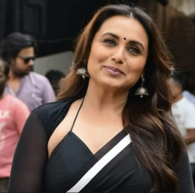
નથી. ઉદ્યોગમાં મારા ૩૦ વર્ષમાં, મેં ક્યારેય આવી કંઈ અનુભવ્યું નથી. મને આ ઉદ્યોગ ગમે છે. તેણે મને આજે જે છું તે બનાવ્યો છે. હું

પીઠ સંગીતકાર એઆર રહેમાને ઉદ્યોગમાં સાંપ્રદાયિકતાના વધતા પ્રભાવ વિશે વાત કરીને ઉદ્યોગમાં એક નવી ચર્ચા જગાવી છે. આ પછી, ઉદ્યોગ વિભાજિત થયો હોય તેવું લાગ્યું. જ્યારે ઘણી હસ્તીઓએ રહેમાનને ટેકો આપ્યો, ત્યારે અન્ય લોકોએ તેમની ટીકા કરી, તેમના નિવેદનને ખોટું ગણાવ્યું. હવે, અભિનેત્રી રાની મુખર્જીએ પણ એઆર રહેમાનના નિવેદન પર પ્રતિક્રિયા આપી છે. ડીડી ન્યૂઝ સાથેની એક મુલાકાતમાં, રાની મુખર્જીએ બોલિવૂડમાં એઆર રહેમાનના સાંપ્રદાયિક પ્રભાવ અને તેના કામ પર તેની અસર વિશે વાત કરી. રાનીએ કહ્યું, "બોલીવુડ સૌથી ધર્મનિરપેક્ષ સ્થળ છે, અને હું તેમાં સંપૂર્ણ વિશ્વાસ રાખું છું. અહીં જાતિ કે ધર્મના આધારે કોઈ ભેદભાવ