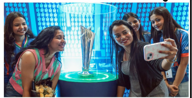
ટી ૨૦ વર્લ્ડ કપ ૨૦૨૬ માટે ક્રોન્ટોસાઉન શરૂ થઈ ગયું છે. ભારત અને શ્રીલંકા દ્વારા સહ-જયમાનિત આ ટુર્નામેન્ટ ૭ ફેબ્રુઆરીથી શરૂ થશે. અગાઉ, આંતરરાષ્ટ્રીય ક્રિકેટ પરિષદે આગામી વર્લ્ડ કપ માટે ગીત રજૂ કર્યું. 'ફ્રીલ ઇ શિલ' નામનું આ ગીત પ્રખ્યાત ભારતીય સંગીતકાર અને ગાયક અનિરુદ્ધ રવિચંદરે રચ્યું અને ગાયું હતું. આઈસીસીના સીઈઓ સંજોગ ગુપ્તાએ કહ્યું, "આઈસીસીની મુખ્ય ટુર્નામેન્ટ ફક્ત રમતગમતની ઘટનાઓ જ નહીં, પરંતુ વૈશ્વિક સાંસ્કૃતિક ઉત્સવોનો પણ છે. ટી ૨૦ વર્લ્ડ