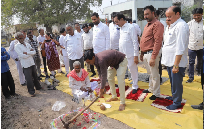
પંચાયત હસ્તકના તમામ રોડના કામ ચોમાસા પહેલા પૂર્ણ કરવામાં આવે તેવી નેમ છે. અમરેલી વિધાનસભા મતવિસ્તારની તમામ આંગણવાડીને મોડેલ આંગણવાડી બનાવવા માટે આયોજન કરવામાં આવી રહ્યું છે. વિકાસકાર્યોની વણગરમાં રાજ્ય સરકાર ઉદાર હાથે અમરેલીને વિકાસકાર્યોની ભેટ આપી રહી છે. કૃષિકારોને સંબોધતા મંત્રીશ્રીએ ઉમેર્યું કે, અમરેલી

અમરેલી: ગુજરાત રાજ્યના મુખ્યમંત્રીશ્રી ભૂપેન્દ્રભાઈ પટેલની ગરિમામય વચ્ચુંઅલ ઉપસ્થિતિમાં અમરેલી જિલ્લાની કુલ ૧૯૪ ગ્રામ પંચાયતોના નવા મકાનના નિર્માણ માટે ઈ-ખાતમુહૂર્ત કાર્યક્રમ યોજાયો હતો. આ પ્રસંગે અમરેલી જિલ્લાના સજિયાવદર ખાતે ઊર્જા અને કાયદો રાજ્ય મંત્રીશ્રી કોશિકભાઈ વેકરીયાના અધ્યક્ષ સ્થાને કાર્યક્રમ યોજાયો હતો. કાર્યક્રમને સંબોધતા રાજ્ય મંત્રીશ્રી કોશિકભાઈ વેકરીયાએ જણાવ્યું હતું કે, રાજ્ય સરકાર દ્વારા મુખ્યમંત્રીશ્રી ભૂપેન્દ્રભાઈ પટેલ તેમજ નાયબ મુખ્યમંત્રીશ્રી હર્ષભાઈ સંઘવીના નેતૃત્વમાં ગ્રામ્ય વિસ્તારના સર્વાંગી વિકાસ માટે સતત પ્રયત્નો કરવામાં આવી રહ્યા છે. ગ્રામ પંચાયત મકાનોના નિર્માણથી ગ્રામ સ્વરાજને વધુ મજબૂતી મળશે તેમજ ગ્રામ્ય નાગરિકોને સરકારી સેવાઓ એક જ સ્થળે સરળતાથી ઉપલબ્ધ બનશે. રાજ્ય મંત્રીશ્રીએ વધુમાં જણાવ્યું હતું કે, રૂ. ૪૮ કરોડથી વધુના ખર્ચે અમરેલી જિલ્લાની ૧૯૪ ગ્રામ પંચાયતોને આધુનિક સુવિધાઓથી સજ્જ નવા મકાનો ઉપલબ્ધ બનશે, જે ગ્રામ પંચાયતોની કાર્યક્ષમતામાં વધારો કરશે અને ગ્રામ્ય વહીવટને વધુ પારદર્શક બનાવશે. આગામી સમયમાં અમરેલી વિધાનસભા મતવિસ્તારના તમામ ગામમાં શાળાના નવા ભવન તૈયાર થશે જેની કામગીરી પ્રગતિતળે છે. માર્ગ મકાન વિભાગ રાજ્ય અને