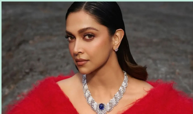
AA22xA6 દીપિકા પાદુકોણ અને અલુ અર્જુન પહેલી વખત ઓન-સ્ક્રીન જોડી જમાવતા જોવા મળશે

મુંબઈ, અટલીની આગામી તેલુગુ સાયન્સ ફિક્શન ફિલ્મમાં અલુ અર્જુન સાથે દીપિકા પાદુકોણ પહેલીવાર મોટા પડદા પર જોવા મળશે. ત્યારે ફિલ્મમેકર અટલીએ ફરી એકવાર દીપિકા પાદુકોણ પ્રત્યે પોતાનો આદર વ્યક્ત કર્યો છે. અલુ અર્જુન સાથેની તેની મહાત્વાકાંક્ષી તેલુગુ પેન-ઈન્ડિયા ફિલ્મ AA22xA6માં દીપિકા જોડાઈ હોવાનું જાહેર થયા બાદ અટલીએ જણાવ્યું કે દીપિકા પાદુકોણ તેના માટે ડેબીયુ ચાર્મી સમાન છે. અગાઉ અટલીએ દીપિકા અને શાહરુખ સાથે જવાન ફિલ્મમાં કામ કર્યું હતું. આ ફિલ્મની સફળતા બાદ ફરી દીપિકા સાથે કામ કરતા અટલીએ