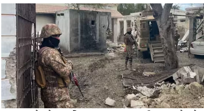
સ્વાગત કરે છે. દરમિયાન, પાકિસ્તાની સૈનિકો તેમની ચોકીઓ છોડીને ભાગી ગયા છે. આ ઘટના 'ઓપરેશન હેરોફ' ના બીજા તબક્કાના ભાગ રૂપે નોંધાઈ રહી છે, જેમાં બીએલએએ અને આઈએસઆઈ કેમ્પ પર હુમલો કર્યો હતો અને મોટા વિસ્તારો કબજે કર્યા હતા. ક્વેટામાં પોલીસ સ્ટેશનો

ક્વેટા, બલુચિસ્તાનની રાજધાની ક્વેટામાં બલુચિસ્તાન લિબરેશન આર્મીના લડવૈયાઓ અને કેટલાક બજારોનો કબજો મેળવ્યો છે. બલુચિસ્તાન પોસ્ટે એક્સ (ભૂતપૂર્વ ટ્રિવટર) પર પોસ્ટ કર્યું હતું કે બીએલએ લડવૈયાઓ બલુચ લોકોના ઉત્સાહ અને તાળીઓ વચ્ચે આગળ વધી રહ્યા છે, બજારો પર કબજો કરી રહ્યા છે. અત્યાર સુધીમાં, તેઓએ બલુચિસ્તાનના લગભગ ૧૦ શહેરો પર કબજો કરી લીધો છે, જેમાં અનેક બજારો અને પોલીસ ચોકીઓનો સમાવેશ થાય છે. વિડિઓમાં, લડવૈયાઓ બજારોમાં ફરતા જોવા મળે છે, જ્યારે સ્થાનિક લોકો ઉત્સાહપૂર્વક તેમનું