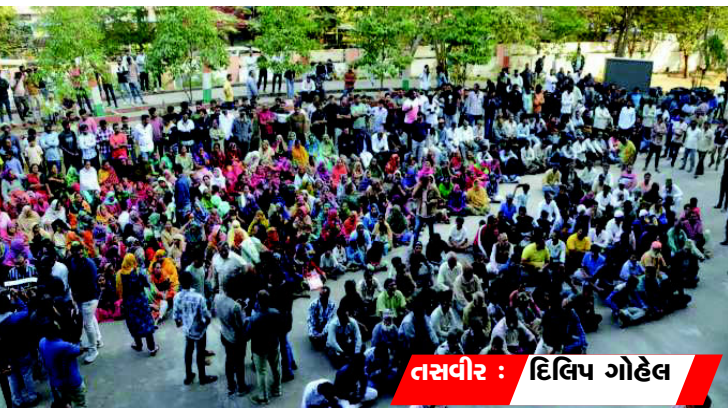
જંગલેશ્વરમાં આવેલા જમીનના ચાર ખંડ પૈકી બે ખંડ કલેક્ટર હસ્તકના અને બે ખંડ મ્યુનિસિપલ કમિશ્નર હસ્તકના છે. ગુજરાત સરકારના જીઆર પ્રમાણે મ્યુનિસિપલ કમિશ્નર હસ્તકના

પુરી પાડવામાં આવે છે. પરંતુ કલેક્ટર હસ્તકની જમીનમાં આવી કોઈ વ્યવસ્થા ન હોવાથી તે લોકો સાથે ભેદભાવ થયો. હાઈકોર્ટે આ મામલે માનવતાવાદી અભિગમ અપનાવવાની તરફેણ કરી હતી. આજે દલીલ દરમિયાન સરકાર પક્ષે જણાવ્યું હતું કે જો અરજદારોની કોઈ અપીલ પેન્ડીંગ હોય તો ગુજરાત રેવન્યુ ટ્રીબ્યુનલને પણ આદેશ આપવામાં આવે કે બે અઠવાડિયાની અંદર તે અંગે નિર્ણય લે પરંતુ હાઈકોર્ટે તે માટે ૯૦ દિવસનો સમય આપ્યો છે. આ અંગેની સુનાવણીમાં સરકાર પક્ષે રજૂઆત કરવામાં આવી હતી કે કલેક્ટરનાં માલિકીના બે ખંડમાં ડિમોલીશન થાય તો વિસ્તાપીતોને આવાસ આપવા માટે કોઈ પોલીસી નથી જેની સામે હાઈકોર્ટે પણ કહ્યું હતું કે એક જમીનમાં તમે ડિમોલીશનના અસરકર્તાને આવાસ ફાળવવા માટે મંજૂરી આપો છો તો બીજી જમીનમાં પણ આ બાબતે સરકારે વિચાર કરવો જોઈએ. ડિમોલીશનના ઓર્ડરને હાઈકોર્ટે રદ કરતાં જંગલેશ્વરમાં વસતા હજારો લોકોને રાહતનો શ્વાસ મળ્યો છે.