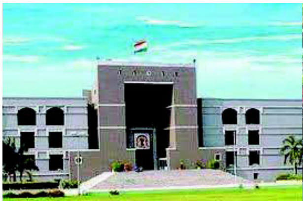
અને અરજદારોના પક્ષે રજૂઆત થઈ હતી. જેમાં મુખ્ય મુદ્દો ઉપસ્થિત થયો હતો કે

રાજકોટ, ૨૧ જાન્યુઆરી. જંગલેશ્વરમાં ૧૩૫૮ જેટલા દબાણકારોને કલેક્ટર તરફથી જમીન ખાલી કરવાની નોટિસને પગલે ભારે ચક્રાવર મચી જવા પામ્યો હતો અને લોકોએ મકાન ખાલી કરીને ભાડે જવા માટે પણ શોધખોળ આદરી હતી. પરંતુ હાલ પુરતી રાહત આપતાં હાઈકોર્ટે કલેક્ટરનો ડિમોલીશન કરવાનો ઓર્ડર હાઈકોર્ટે આજે ફગાવી દીધો છે અને અરજદારોની જમીનની માલિકીની કાયદેસરતાં બાબતે ગુજરાત રેવન્યુ ટ્રીબ્યુનલને ત્રણ મહિનામાં મેરીટના ધોરણે નિર્ણય કરવાનો હુકમ કર્યો છે. આ અંગે મળતી માહિતી પ્રમાણે કલેક્ટરની નોટિસ સામે જંગલેશ્વરનાં અરજદારો દ્વારા હાઈકોર્ટના દ્વાર ખખડાવવામાં આવ્યા હતાં. શનિવારનાં રોજ અરજીની સુનાવણી થતાં ન્યાયમૂર્તિ શ્રીમતિ વૈભવી નાણાવટી દ્વારા સોમવાર સુધી ડિમોલીશનને બ્રેક મારવામાં આવી હતી અને આ અરજીની અગ્રતાના ધોરણે સુનાવણી કરવા માટે લીસ્ટ કરવામાં આવી હતી. સવારે આ અરજી બાબતે સરકાર