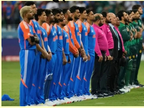
ઈન્ડિયા શ્રીલંકાની યાત્રા કરશે અને આઈસીસીના તમામ પ્રોટોકોલનું પાલન કરશે. ટીમ સમયપત્રક મુજબ પ્રેક્ટિસ કરશે, પ્રેસ કોન્ફરન્સમાં હાજરી આપશે, સમયસર કોલંબોના એસએસસી ક્રિકેટ ગ્રાઉન્ડ પર પહોંચશે અને મેચ ૨૬ કરવા કે નહીં તે અંગે મેચ રેફરીના નિર્ણયની રાહ જોશે. પાકિસ્તાને પહેલાથી જ જાહેરાત કરી દીધી છે કે તે ૧૫ ફેબ્રુઆરીએ ભારત સામે શ્રુપ સ્ટેજ મેચમાં નહીં રમે. પાકિસ્તાન સરકારે ૬ પર એક નિવેદન જારી

નવીદિલ્હી, આઈસીસી ટી ૨૦ વર્લ્ડ કપ ૨૦૨૬ માં ૧૫ ફેબ્રુઆરીએ ભારત અને પાકિસ્તાન વચ્ચેના શ્રુપ સ્ટેજ મેચ અંગે એક નવું અપડેટ સામે આવ્યું છે. પાકિસ્તાન દ્વારા ઈન્ડિયા વિરુદ્ધ પાકિસ્તાન મેચનો બહિષ્કાર કરવાના નિર્ણય છતાં, ભારતીય ટીમ શેડ્યુલ મુજબ શ્રીલંકા જશે અને આઈસીસી પ્રોટોકોલનું સંપૂર્ણપણે પાલન કરશે. બીસીસીઆઈ સૂત્રોના જણાવ્યા અનુસાર, ટીમ ઈન્ડિયા કોલંબો પહોંચશે અને મેચ સંબંધિત બધી ઔપચારિકતાઓ પૂર્ણ કરશે અને પછી મેચ રેફરીના સત્તાવાર નિર્ણયની રાહ જોશે. સૂત્રોએ જણાવ્યું હતું કે ટીમ