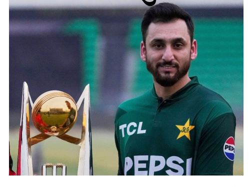
કરંચી, કપમાં પાકિસ્તાનની ભાગીદારી અંગે અંતિમ નિર્ણય ૩૦ જાન્યુઆરી અથવા ૨ ફેબ્રુઆરી સુધીમાં આવી શકે છે. ૩૦ જાન્યુઆરીએ કોઈ સત્તાવાર જાહેરાત ન થયા પછી, ૨ ફેબ્રુઆરીએ સ્પષ્ટતા અપેક્ષિત હતી. જો કે, ઘટનાક્રમ અચાનક વેગ પકડ્યો. ૧ ફેબ્રુઆરીની સાંજે, પાકિસ્તાનના વડા પ્રધાન શાહબાઝ શરીફ અને મોહસીન નકવી વચ્ચે એક મહત્વપૂર્ણ બેઠક થઈ, જેના પછી સત્તાવાર નિર્ણય જાહેર કરવામાં આવ્યો.

પાકિસ્તાનના કેપ્ટન સલમાન અલી આગાએ હવે આઈસીસી ટી ૨૦ વર્લ્ડ કપ ૨૦૨૬ માં ભારત સામે ન રમવાના પાકિસ્તાન સરકારના નિર્ણય પર પોતાનું મૌન તોડ્યું છે. ત્રીજા અને અંતિમ ટી ૨૦ માં ઓસ્ટ્રેલિયા સામે ૧૧૧ રનની જંગી જીત બાદ, સલમાન આગાએ સ્પષ્ટપણે કહ્યું કે આ નિર્ણયમાં ટીમની કોઈ ભૂમિકા નથી. ખરેખર, પાકિસ્તાન સરકારે ૧ ફેબ્રુઆરીએ સ્પષ્ટ કર્યું હતું કે ટીમને ટી ૨૦ વર્લ્ડ કપમાં ભાગ લેવાની પરવાનગી આપવામાં આવી છે, પરંતુ ૧૫ ફેબ્રુઆરીએ કોલંબોમાં યોજાનારી ભારત-પાકિસ્તાન મેચ રમાશે નહીં. આ નિર્ણયથી ક્રિકેટ જગતમાં ખળભળાટ મચી ગયો હતો. મેચ પછી મીડિયા સાથે વાત કરતા, પાકિસ્તાનના કેપ્ટન સલમાન આગાએ કહ્યું, "અમે વર્લ્ડ કપ રમવા જઈ રહ્યા છીએ. આ અમારો નિર્ણય નથી, અમે કંઈ કરી શકતા નથી. અમારી સરકાર અને પીસીબી ચેરમેન જે કહે તે અમારે સ્વીકારવું પડશે. ભારત સામે મેચ ન રમવાનો નિર્ણય અમારો નહોતો." આગાઉ, પીસીબી ચેરમેન અને પાકિસ્તાનના ગૃહમંત્રી મોહસીન નકવીએ સંકેત આપ્યો હતો કે વર્લ્ડ