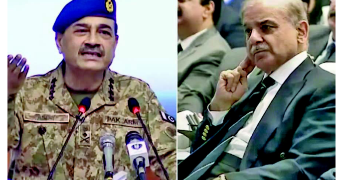
કે પીછેહઠ કરવાનો આરોપ લગાવી રહ્યા છે. આ વેપાર કરાર બાદ, પાકિસ્તાનીઓએ શેહબાઝ શરીફ અને અસીમ મુનીરની તુલના વેશ્યાઓ સાથે કરી છે. એક યુઝરે ૬ પર એક વીડિયો મીમ શેર કર્યો છે, જેમાં અસીમ મુનીર ડોલરની થેલીઓ સાથે અને કે વૈશ્વિક નેતાઓના ખોળામાં બેઠેલા દેખાય છે.

ભારત-અમેરિકાના સોદા પર પાકિસ્તાનીઓએ તેમનું ટ્રોલ કર્યું નવીદિલ્હી, જ્યારે ભારત અને યુનાઈટેડ સ્ટેટ્સ ગઈકાલે વેપાર કરાર પર હસ્તાક્ષર કર્યા હતા, ત્યારે પાકિસ્તાનીઓએ સોશિયલ મીડિયા પર તેમના જ વડા પ્રધાન શેહબાઝ શરીફ અને અમેરિકન રાષ્ટ્રપતિના ગુણગાન ગાતા જેવા મળ્યા છે. હવે, પાકિસ્તાનીઓ તેમની સરકારને પૂછી રહ્યા છે કે, આ બધી ગુસ્સેદારીથી તેમને શું મળ્યું? એક પાકિસ્તાની યુઝરે ઈન્સ્ટાગ્રામ પર એક સંપાદિત પોસ્ટર પોસ્ટ કર્યું જેમાં પાકિસ્તાની આર્મી ચીફ અસીમ મુનીર પીએમ મોદી અને યુએસ રાષ્ટ્રપતિ ડોનાલ્ડ ટ્રમ્પ સાથે રડતા દેખાય છે. આ છબીમાં અસીમ મુનીર પથ્થરોથી ભરેલું લાકડાનું બોક્સ પકડીને પણ દેખાય છે. બીજા યુઝરે એક ફોટો પોસ્ટ કર્યો જેમાં અસીમ મુનીર પીએમ મોદી અને ડોનાલ્ડ ટ્રમ્પની પાછળ પથ્થરોથી ભરેલું બોક્સ લઈને ઉભા દેખાય છે. યુએસએ સાથેના નવા વેપાર કરાર હેઠળ, ભારત પર ૧૮% ટેરિફ લાગશે, જ્યારે પાકિસ્તાને ભારત કરતા ૧૮% વધુ ટેક્સ ચૂકવવો પડશે. ઘણા પાકિસ્તાનીઓ તેમની સરકાર પર પ્રહાર કરી રહ્યા છે, અને ભારત પર પાકિસ્તાની જેમ તેની શરતો પર શરણાગતિ સ્વીકારવાનો