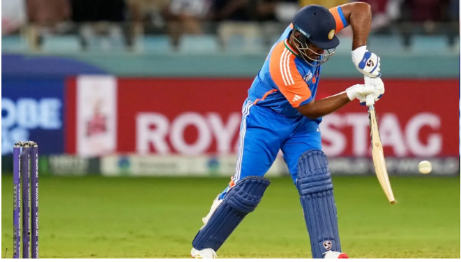
બેલાડીઓને મેદાનમાં ઉતારે છે તે બેટ્સમેન રસમદ રહેશે. તમને યાદ હશે કે ભારત અને ન્યૂઝીલેન્ડ વચ્ચેની ટીમ ૨૦ શ્રેણી અંતિમ મેચ દરમિયાન, સંજુ સેમસન ટીમ ઈન્ડિયાની પ્લેઈંગ ઈલેવનમાં વિકેટકીપર-બેટ્સમેન તરીકે રમી રહ્યો હતો. બેકે,

સંજુ સેમસન હાલમાં સમાચારમાં છે. ટીમ ઈન્ડિયા ન્યૂઝીલેન્ડ સામે શ્રેણી જીત્યા પછી આઈસીસી ટીમ ૨૦ વર્લ્ડ કપ માટે તૈયારી કરી રહી છે, પરંતુ ધ્યાન સંજુ સેમસન પર છે. આનું કારણ એ છે કે તે ન્યૂઝીલેન્ડ સામેની શ્રેણીમાં મોટો ફ્લોપ રહ્યો હતો. આવી સ્થિતિમાં, હવે સવાલો ઉભા થયા છે કે સંજુને ટીમ ૨૦ વર્લ્ડ કપ માટે ટીમ ઈન્ડિયાની પ્લેઈંગ ઈલેવનમાં સામેલ કરવામાં આવશે કે પછી તેને બહાર બેસવું પડશે. સૂર્યકુમાર યાદવની કેપ્ટનશીપવાળી ટીમ ઈન્ડિયા ૭