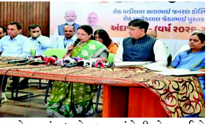
ટકા ટેક્સમાં વધારો કરવા અંગેની જોગવાઈ બે વર્ષ પહેલાના બજેટમાં થઈ ચૂકી હતી. જેથી ઓટોમેટીક બે ટકા ટેક્સમાં વધારો થઈ જાય છે.

દરવર્ષે ટેક્સમાં બેટકા વધારો કરવા અંગેની જોગવાઈ બે વર્ષ પહેલાના બજેટમાં થઈ ચૂકી હતી જેથી ઓટોમેટીક બે ટકા ટેક્સમાં વધારો થઈ જાય છે. અમદાવાદ, ગુજરાતનું આર્થિક પાટનગર ગણાતું અમદાવાદ શહેર ધીમે ધીમે વિસ્તરીને આજે ૬૮૦ ચોરસ કિમીથી વધારે વિસ્તારમાં ફેલાઈ ગયું છે. શહેરમાં વસતીનો આંકડો એકાદ કરોડ આસપાસ પહોંચી ગયો ગયો હોવાનો અંદાજ છે. અમદાવાદના ૧૭,૦૧૮ કરોડનું ડ્રાફ્ટ બજેટમાં કરવેરામાં કોઈ વધારો કરવામાં આવ્યો નથી. દર વર્ષે ટેક્સમાં બે