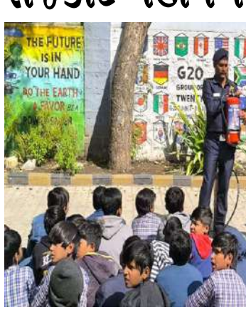
રાજકોટ, શાળા સલામતી

સમ્રાહ અંતર્ગત રાજકોટ મહાનગર પાલિકાની સરકારી પ્રાથમિક શાળાઓમાં ફાયર એન્ડ સેફ્ટી, પ્રાથમિક સારવાર તેમજ ડિઝાસ્ટર મનેજમેન્ટ અંગે દરરોજ પાંચ પ્રાથમિક વિદ્યાર્થીઓ અને શિક્ષકોને તાલીમો આપવામાં આવી હતી. રાજકોટ શહેરમાં આવેલ સરકારી પ્રાથમિક શાળાઓમાં કુલ વિદ્યાર્થીઓ ૨૭૬૦ અને ૧૫૧ શિક્ષકોને પ્રાથમિક