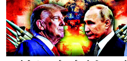
પર કોઈ બંધનકર્તા મર્યાદા કે નિયમ રહ્યો નથી. આ ઘટનાથી વિશ્વમાં પરમાણુ શસ્ત્રોની નવી સ્પર્ધા શરૂ થવાનો ખતરો વધી ગયો છે.

નવી દિલ્હી રશિયા અને અમેરિકા વચ્ચે પરમાણુ શસ્ત્રો પરની છેલ્લી મોટી કાનૂની મર્યાદા હવે ખતમ થઈ ગઈ છે. આજે પ કેબુઆરી ૨૦૨૬ ના રોજ 'ન્યૂ સ્ટાર્ટ' સંધિ ની મુદત પૂરી થઈ ગઈ છે. લગભગ ૫૦ વર્ષમાં પ્રથમ વખત એવું બન્યું છે કે બંને દેશોના વ્યૂહાત્મક પરમાણુ શસ્ત્રો, જેમ કે આંતરખંડીય બેલેસ્ટિક મિસાઈલો, સબમરીન લોન્ચ મિસાઈલો અને બોમ્બર