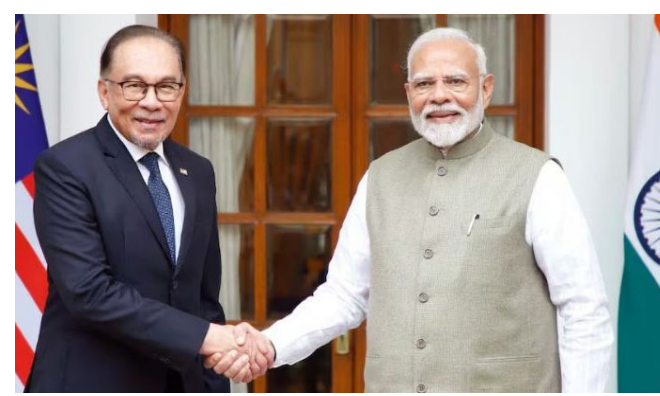
મજબૂત બનાવવા માટે એક મહત્વપૂર્ણ પગલું ગણાયું હતું. તેમના રોકાણ દરમિયાન, પ્રધાનમંત્રી મોદી તેમના મલેશિયન સમકક્ષ સાથે બંને દેશો વચ્ચે સહકાર સંબંધિત વિવિધ મુદ્દાઓ પર વિગતવાર ચર્ચા કરશે. પ્રધાનમંત્રી મલેશિયામાં ભારતીય સમુદાયના સભ્યોને પણ મળશે. આ ઉપરાંત, તેઓ ઉદ્યોગના નેતાઓ અને

નવી દિલ્હી, પ્રધાનમંત્રી નરેન્દ્ર મોદી ૭ થી ૮ ફેબ્રુઆરી ૨૦૨૬ દરમિયાન મલેશિયાની સત્તાવાર મુલાકાત લેશે. વિદેશ મંત્રાલયે જણાવ્યું હતું કે, મલેશિયાના પ્રધાનમંત્રી અનવર ઈબ્રાહિમના આમંત્રણ પર આ મુલાકાત થઈ રહી છે. આ પીએમ મોદીની મલેશિયાની ત્રીજી મુલાકાત હશે. ઓગસ્ટ ૨૦૨૪ માં ભારત અને મલેશિયાએ વ્યાપક વ્યૂહાત્મક ભાગીદારી સુધીના સંબંધોને આગળ વધાર્યા પછી આ તેમની પહેલી મુલાકાત પણ હશે. વિદેશ મંત્રાલયે આ મુલાકાતને દ્વિપક્ષીય સંબંધોને વ્યવસાયિક પ્રતિનિધિઓ સાથે વાતચીત કરશે. વિદેશ મંત્રાલય અનુસાર, મુલાકાત સાથે ૧૦મો ભારત-મલેશિયા સીઈઓ ફોરમ પણ યોજાશે. ભારત અને મલેશિયા ઇતિહાસ, સભ્યતા અને સંસ્કૃતિમાં મૂળ ધરાવતા ઊંડા અને લાંબા સમયથી ચાલતા સંબંધો ધરાવે છે. મલેશિયામાં રહેતા ભારતીય ડાયસ્પોરા દ્વારા આ સંબંધો વધુ મજબૂત બને છે, જે લગભગ ૨.૮ મિલિયન લોકો ધરાવે છે અને વિશ્વનો ત્રીજો સૌથી મોટો ભારતીય સમુદાય છે. ભારત-મલેશિયા સંબંધો સ્થિર છે જણાવ્યું હતું કે બંને દેશો વચ્ચેના સંબંધ વ્યાપક છે અને સતત વધતો રહે છે. સહયોગના ક્ષેત્રોમાં વેપાર અને રોકાણ, સંરક્ષણ અને સુરક્ષા, દરિયાઈ સહયોગ, ડિજિટલ અને નાણાકીય ટેકનોલોજી, ઊર્જા, આરોગ્યસંભાળ, શિક્ષણ, સંસ્કૃતિ, પર્યટન અને લોકો-ટો-લોકોના આદાનપ્રદાનનો સમાવેશ થાય છે. સીઈઓ એ ઉમેર્યું હતું કે આ મુલાકાત બંને નેતાઓને આ તમામ ક્ષેત્રોમાં પ્રગતિની સમીક્ષા કરવાની અને પરસ્પર લાભ માટે ભવિષ્યના સહયોગ માટે એક માર્ગ નક્કી કરવાની તક આપશે.