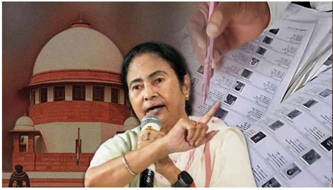
પાસ પ્રમાણપત્ર આપવાની પ્રક્રિયા સમજાવી હતી, અને આ સમજણના આધારે, આ મુદ્દાનો સમાવેશ કરવામાં આવ્યો હતો. કેસમાં મુખ્યમંત્રી મમતા બેનર્જીનું પ્રતિનિધિત્વ કરતા વરિષ્ઠ વકીલ શ્યામ દિવાનએ સમજાવ્યું કે કોર્ટે અગાઉ તાર્કિક વિસંગતતાઓની યાદી પ્રદર્શિત કરવાનો નિર્દેશ આપ્યો હતો.

પશ્ચિમ બંગાળમાં મતદાર યાદીના વિશેષ સઘન સુધારણા અંગે સુપ્રીમ કોર્ટમાં સુનાવણી