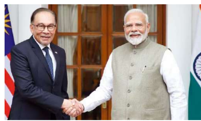
મજબૂત બનાવવા માટે એક મહત્વપૂર્ણ પગલું ગણાયું હતું. તેમના રોકાણ દરમિયાન, પ્રધાનમંત્રી મોદી તેમના મલેશિયન સમકક્ષ સાથે બંને દેશો વચ્ચે સહકાર સંબંધિત વિવિધ મુદ્દાઓ પર વિગતવાર ચર્ચા કરશે. પ્રધાનમંત્રી મલેશિયામાં ભારતીય સમુદાયના સભ્યોને પણ મળશે. આ ઉપરાંત, તેઓ ઉદ્યોગના નેતાઓ અને

નવી દિલ્હી, પ્રધાનમંત્રી નરેન્દ્ર મોદી ૭ થી ૮ ફેબ્રુઆરી ૨૦૨૬ દરમિયાન મલેશિયાની સત્તાવાર મુલાકાત લેશે. વિદેશ મંત્રાલયે જણાવ્યું હતું કે, મલેશિયાના પ્રધાનમંત્રી અનવર ઈબ્રાહિમના આમંત્રણ પર આ મુલાકાત થઈ રહી છે. આ પીએમ મોદીની મલેશિયાની ત્રીજી મુલાકાત હશે. ઓગસ્ટ ૨૦૨૪ માં ભારત અને મલેશિયાએ વ્યાપક વ્યૂહાત્મક ભાગીદારી સુધીના સંબંધોને આગળ વધાર્યા પછી આ તેમની પહેલી મુલાકાત પણ હશે. વિદેશ મંત્રાલયે આ મુલાકાતને દ્વિપક્ષીય સંબંધોને વ્યવસાયિક પ્રતિનિધિઓ સાથે વાતચીત કરશે. વિદેશ મંત્રાલયે અનુસાર, મુલાકાત સાથે ૧૦મો ભારત-મલેશિયા સીઈઓ ફોરમ પણ યોજાશે. ભારત અને મલેશિયા ઇતિહાસ, સભ્યતા અને સંસ્કૃતિમાં મૂળ ધરાવતા ઊંડા અને લાંબા સમયથી ચાલતા સંબંધો ધરાવે છે. મલેશિયામાં રહેતા ભારતીય ડાયસ્પોરા દ્વારા આ સંબંધો વધુ મજબૂત બને છે, જે લગભગ ૨.૮ મિલિયન લોકો ધરાવે છે અને વિશ્વનો ત્રીજો સૌથી મોટો ભારતીય સમુદાય છે. ભારત-મલેશિયા સંબંધો સ્પષ્ટ છે જણાવ્યું હતું કે બંને દેશો વચ્ચેના સંબંધ વ્યાપક છે અને સતત વધતો રહે છે. સહયોગના ક્ષેત્રોમાં વેપાર અને રોકાણ, સંરક્ષણ અને સુરક્ષા, દરિયાઈ સહયોગ, ડિજિટલ અને નાણાકીય ટેકનોલોજી, ઊર્જા, આરોગ્યસંભાળ, શિક્ષણ, સંસ્કૃતિ, પર્યટન અને લોકો-ટો-લોકોના આદાનપ્રદાનનો સમાવેશ થાય છે. સૌથી ઉમેર્યું હતું કે આ મુલાકાત બંને નેતાઓને આ તમામ ક્ષેત્રોમાં પ્રગતિની સમીક્ષા કરવાની અને પરસ્પર લાભ માટે ભવિષ્યના સહયોગ માટે એક માર્ગ નક્કી કરવાની તક આપશે.