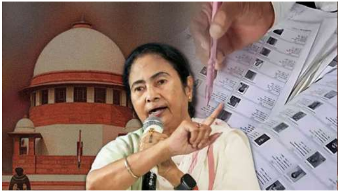
પાસ પ્રમાણપત્ર આપવાની પ્રક્રિયા સમજાવી હતી, અને આ સમજણના આધારે, આ મુદ્દાનો સમાવેશ કરવામાં આવ્યો હતો. કેસમાં મુખ્યમંત્રી મમતા બેનર્જીનું પ્રતિનિધિત્વ કરતા વરિષ્ઠ વકીલ શ્યામ દિવાનએ સમજાવ્યું કે કોર્ટે અગાઉ તાર્કિક વિસંગતતાઓની યાદી પ્રદર્શિત કરવાનો નિર્દેશ આપ્યો હતો.

પશ્ચિમ બંગાળમાં મતદાર યાદીના વિશેષ સઘન સુધારણા અંગે સુપ્રીમ કોર્ટમાં સુનાવણી