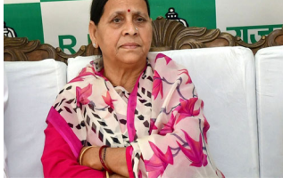
હવે આ મામલાને દબાવવાના પ્રયાસો થઈ રહ્યા છે. રાબડી દેવીએ સરકારના ઈરાદા પર પ્રશ્ન ઉઠાવતા કહ્યું કે પોલીસે પહેલા જહાનાબાદ કેસને ઢાંકી દીધો અને પછી તેને સીબીઆઈને સોંપી દીધો. તેમણે કટાક્ષમાં ટિપ્પણી કરી કે સીબીઆઈ પણ કેન્દ્ર સરકારના હાથમાં છે, જેના કારણે નિષ્પક્ષ તપાસ શક્ય નથી. તેમના મતે,

પટણા, નીટ વિદ્યાર્થીના મૃત્યુ મામલે વિપક્ષના નેતા રાબડી દેવીના નેતૃત્વમાં વિપક્ષના સભ્યોએ સરકારને ઘેરી લેતા બિહાર વિધાનસભા પરિષદની બહાર વાતાવરણ ગરમાયું. બેનરો અને પોસ્ટરો પકડીને, વિપક્ષના સભ્યોએ મુખ્યમંત્રી વિરુદ્ધ સુત્રોચ્ચાર કર્યા. વિરોધ કરતી મહિલા સભ્યોએ જાહેર કર્યું કે બિહારની દીકરીઓ સાથે થઈ રહેલા અન્યાયને સહન કરવામાં આવશે નહીં. વિપક્ષનો આરોપ છે કે જહાનાબાદના એક મેરીટિઅર્સ વિદ્યાર્થીના મૃત્યુ અંગે પોલીસનો વ્યવહાર શંકાસ્પદ રહ્યો છે અને