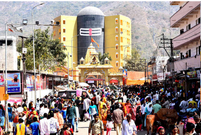
યાત્રિકો શ્રદ્ધા અને પોતાની ભાવના સાથે આવે છે. અત્યાર સુધી મેળામાં અનેક પ્રકારની મુકેલીઓ હોવા છતાં લાખો લોકો આવે છે. કુંભ મેળાની જેમ શિવરાત્રીના મેળાને ભવ્ય બનાવવાના સરકાર અને તંત્ર દ્વારા

જૂનાગઢઃ મહા શિવરાત્રીના મેળાને મુળ રીતે ઉજવવાને બદલે વધુ પડતા દેખાડા કરવાના અભરખામાં કરોડોનું આંધણ થશે બીજી તરફ યાત્રિકોને ૧૦ કિમી ચાલવાની મજબુરી ઉભી કરવામાં આવી રહી છે. પરંપરાગત યોજાતા મેળામાં આ વખતે યાત્રાધામ વિકાસ બોર્ડ દ્વારા ઈવેન્ટ મેનેજમેન્ટ એજન્સીઓ રાખવામાં આવી છે. આ એજન્સી દ્વારા કરવામાં આવેલા સૂચનોના આધારે ગોઠવણ કરવામાં આવી રહી છે. ઈવેન્ટ એજન્સીએ ભૂતકાળના અનુભવ, મેળાની મુળ પરંપરાને બદલે દેખાડા પર વધુ ફોકસ રાખ્યું હોવાનો સુર ઉઠી રહ્યો છે. સરકાર દ્વારા કોઈપણ પ્રકારની જાહેરાત કે દેખાડો કરવામાં ન આવે તો પણ લાખોની સંખ્યામાં