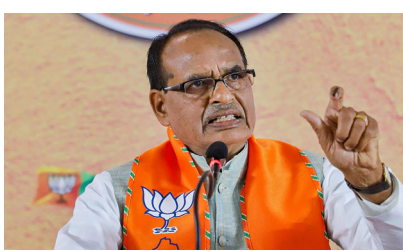
સમગ્ર પરિસ્થિતિ સ્પષ્ટ કરી છે. હું પુનરાવર્તિત કરું છું કે ભારતીય ખેડૂતોના હિતોનું સંપૂર્ણ રક્ષણ કરવામાં આવ્યું છે. ભલે તે નાના હોય કે મોટા, અમારા બધા કૃષિ ઉત્પાદનોનું રક્ષણ કરવામાં આવશે. બજાર આવી કોઈ પણ વસ્તુ માટે પૂલ્વું મૂકવામાં આવ્યું નથી. "ભારતના કૃષિ

નવીદિલ્હી, ભારત અને અમેરિકા વચ્ચે લાંબા સમયથી અટકેલા વેપાર કરાર પર સંમતિ સધાઈ છે. રાષ્ટ્રપતિ ટ્રમ્પે પીએમ મોદી સાથે ફોન પર વાતચીત બાદ આ જાહેરાત કરી. જોકે, વિપક્ષ વેપાર કરાર પર સવાલ ઉઠાવી રહ્યું છે, અને પૂછી રહ્યું છે કે કૃષિ ક્ષેત્રને પૂલ્વું પાડવાથી "ખેડૂતોનું રક્ષણ" કેવી રીતે થશે. કૃષિ મંત્રી શિવરાજ સિંહ ચૌહાણે હવે આ અંગે એક નિવેદન બહાર પાડ્યું છે.