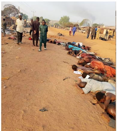
ભયાનક હત્યાકાંડ પછી ગામડાઓમાં વિખરાયેલા મૃતદેહોના દૃશ્યે બધાને ગભરાવી દીધા છે. હજુ સુધી કોઈએ

ઘટનાસ્થળના ફૂટેજમાં લોહીથી લથપથ જમીન પર મૃતદેહો પડેલા, કેટલાકના હાથ બાંધેલા, તેમજ સળગતા ઘરો પણ દેખાયા