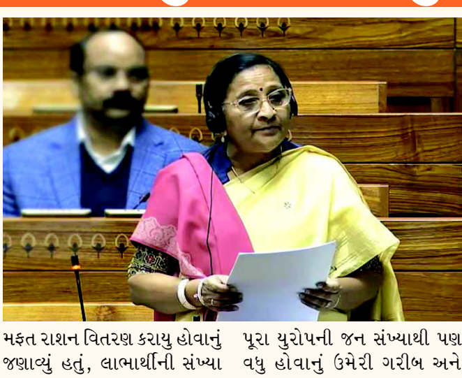
મફત રાશન વિતરણ કરાવ્યું હોવાનું જણાવ્યું હતું, લાભાર્થીની સંખ્યા પૂરા યુરોપની જન સંખ્યાથી પણ વધુ હોવાનું ઉમેરી ગરીબ અને

ભાવનગર,તા.૬ દેશમાં ગરીબ કલ્યાણ અન્ન યોજનાને અસરકારક બનાવવા અને પ્રવાસી શ્રમિકોને અનાજ મળી રહે એ માટે કેન્દ્ર સરકાર દ્વારા શું વ્યવસ્થા છે તે અંગે લોકસભા સત્રમાં પ્રશ્ન પૂછાયો હતો. જેના ઉત્તરમાં આહક બાબતો, ખાદ્ય અને જાહેર વિતરણ મંત્રાલય ભારત સરકારના કેન્દ્રીય રાજ્ય મંત્રી નિમુબેન બાંભણીયાએ 'પ્રધાન મંત્રી ગરીબ કલ્યાણ અન્ન યોજના' તળે સંપૂર્ણ પારદર્શક રીતે દેશના ૮૦ કરોડથી વધુ લાભાર્થીને