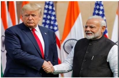
સરકારે જણાવ્યું કે ભારત-અમેરિકા વેપાર કરારનો પ્રથમ તબક્કો લગભગ તૈયાર છે. તેમણે જણાવ્યું કે સંયુક્ત નિવેદન પછી કરારને ઔપચારિક બનાવવામાં આવશે, અને માર્ચના મધ્ય સુધીમાં ઔપચારિક કરાર પર હસ્તાક્ષર થવાની અપેક્ષા છે. મંત્રીએ એ પણ સ્પષ્ટતા કરી કે

નવીદિલ્હી, ભારત અને યુનાઇટેડ સ્ટેટ્સ વચ્ચે દ્વિપક્ષીય વેપાર કરાર અંગે એક મુખ્ય અપડેટ બહાર આવ્યું છે. કેન્દ્રીય વાણિજ્ય મંત્રી પિયુષ ગોયલે કહ્યું છે કે બંને દેશો આગામી ૪-૫ દિવસમાં સંયુક્ત નિવેદન પર હસ્તાક્ષર કરે તેવી અપેક્ષા છે.