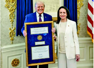
અગાઉ, નોબેલ શાંતિ પુરસ્કાર આપતી સંસ્થાએ જણાવ્યું હતું કે માચાડો ટ્રમ્પને તે આપી શકશે નહીં. વ્હાઈટ હાઉસે ટ્રમ્પ સાથેની માચાડોની મુલાકાત પહેલાં જણાવ્યું હતું કે જો તેણી આમ કરવાનો પ્રયાસ કરશે, તો ટ્રમ્પ તેને સ્વીકારશે કે નહીં તે સંપૂર્ણપણે રાષ્ટ્રપતિ પર નિર્ભર રહેશે. વ્હાઈટ હાઉસ છોડીને કેપિટોલ હિલ તરફ પ્રયાણ કરતી વખતે, માચાડોએ પત્રકારોને કહ્યું, "મેં યુનાઈટેડ સ્ટેટ્સના રાષ્ટ્રપતિને નોબેલ શાંતિ પુરસ્કાર મેડલ અર્પણ કર્યો." તેણીએ કહ્યું કે તેણીએ "આપણી સ્વતંત્રતા પ્રત્યેની તેમની અનન્ય પ્રતિબદ્ધતાના માનમાં" આમ કર્યું. માચાડોએ એ પણ જાહેર કર્યું કે તેણીએ ગુરુવારે વ્હાઈટ હાઉસમાં યુએસ રાષ્ટ્રપતિ ડોનાલ્ડ ટ્રમ્પ સાથે તેના દેશના ભવિષ્ય અંગે ચર્ચા કરી હતી. જોકે, ટ્રમ્પે તત્કાલીન રાષ્ટ્રપતિ નિકોલસ માર્દુરોની ધરપકડ બાદ તેમને સત્તા સંભાળવા માટે સંભવિત ઉમેદવાર તરીકે ભારતરફ કરી દીધા હતા. બંને નેતાઓ વચ્ચે આ મુલાકાત એવા સમયે થઈ જ્યારે કાર્યકારી રાષ્ટ્રપતિ ડેલ્લી રોડિગ્ઝ તેમનું પહેલું સ્ટેટ ઓફ ધ યુનિયન સંબોધન કરી રહ્યા છે, જે અમેરિકા દ્વારા તેમના પુરોગામી, માર્દુરોને હાંકી કાઢવામાં આવ્યાના બે અઠવાડિયાથી પણ ઓછા સમયમાં થયું હતું.