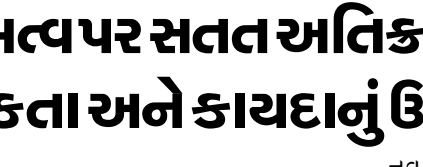
વેનેઝુએલાના વિપક્ષી નેતા માચાડોએ કહ્યું કે તેમણે ટ્રમ્પ સાથેની મુલાકાત દરમિયાન તેમનો નોબેલ શાંતિ પુરસ્કાર એનાયત કર્યો. માચાડોએ જણાવ્યું કે તેમણે વ્હાઈટ હાઉસમાં તેમની મુલાકાત દરમિયાન રાષ્ટ્રપતિ ડોનાલ્ડ ટ્રમ્પને પોતાનો નોબેલ શાંતિ પુરસ્કાર મેડલ એનાયત કર્યો. તત્કાલીન રાષ્ટ્રપતિ નિકોલસ માર્દુરોને પદબદ્ધ કર્યા પછી ટ્રમ્પ દ્વારા દેશનું નેતૃત્વ કરવાની તેમની ક્ષમતા પર વારંવાર પ્રશ્ન ઉઠાવવામાં આવ્યો હોવા છતાં, તેણીએ ટ્રમ્પની આપણી સ્વતંત્રતા પ્રત્યેની અનોખી પ્રતિબદ્ધતાની પ્રશંસા કરી. માચાડોએ બેઠક વિશે વધુ કોઈ વિગતો આપી ન હતી, અને વ્હાઈટ હાઉસે જણાવ્યું ન હતું કે ટ્રમ્પે મેડલ સ્વીકાર્યો કે નહીં.

મોસ્કો, રશિયન રાષ્ટ્રપતિ વ્લાદિમીર પુતિને ગ્રાન્ડ કેમલિન પેલેસના સેન્ટ એલેક્ઝાન્ડર હોલમાં નવા વિદેશી રાજદૂતો માટે ઓળખપત્રો પ્રાપ્ત કરવા માટેના સમારોહમાં એક મજબૂત સંદેશ આપ્યો. તેમણે કહ્યું કે વૈશ્વિક પરિસ્થિતિ ઝડપથી બગડી રહી છે અને વિશ્વ ખૂબ જ ખતરનાક વળાંક પર પહોંચી ગયું છે. વેનેઝુએલા સામે અમેરિકાની કાર્યવાહી અને ટ્રમ્પ દ્વારા ઈરાનને સતત ધમકીઓ આપ્યા બાદ પુતિનનો આ સંદેશ આવ્યો છે. જોકે તેમણે અમેરિકા કે ટ્રમ્પનું નામ લીધું ન હતું, પરંતુ તેમણે ગર્ભિત રીતે બંને પર નિશાન સાચ્યું હતું. પુતિને કહ્યું કે ઘણા દેશોની સાર્વભૌમત્વ પર સતત અતિક્રમણ થઈ રહ્યું છે. આ નિવેદન વેનેઝુએલા સામે અમેરિકાની તાજેતરની જબરદસ્ત કાર્યવાહી અને ઈરાનમાં ગેરકાયદેસર દખલગીરીનો ઉલ્લેખ કરે છે. પુતિને આરોપ લગાવ્યો કે ડઝનબંધ દેશો તેમની સાર્વભૌમત્વ, અરાજકતા અને કાયદાનું ઉલ્લંઘનનો સામનો કરી રહ્યા છે. પોતાના ભાષણમાં, પુતિને કહ્યું, "આંતરરાષ્ટ્રીય મંચ પર પરિસ્થિતિ ઝડપથી બગડી રહી છે. આ અંગે કોઈ ચર્ચા થઈ શકે નહીં. લાંબા સમયથી ચાલતા સંઘર્ષો તીવ્ર બની રહ્યા છે, અને