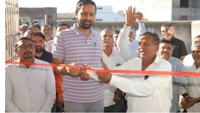
માટે પ્રતિબદ્ધ છે. અમરેલી જિલ્લાનો સંતુલિત વિકાસ સરકારની પ્રાથમિકતા છે. તેમણે ઉમેર્યું કે, ગામડાંઓ સુધી મૂળભૂત સુવિધાઓ પહોંચે, લોકોનું જીવનસ્તર ઊંચું આવે અને ગ્રામ્ય વિસ્તારોના સર્વાંગી વિકાસ

અમરેલી જિલ્લાના કુંકાવાવ તાલુકાના જીયુડી ગામે રાજ્યના ઉર્જા રાજ્યમંત્રી કૌશિક વેકરિયાના હસ્તે રૂપિયા ૨૬ લાખના વિવિધ વિકાસ કાર્યોનું ખાતમુહૂર્ત કરવામાં આવ્યું હતું. આ કાર્યોમાં મંદિર પાસે બ્લોક રોડ, સીસી રોડ, કોઝવે અને પાઈપલાઈન સહિતના માળખાકીય કામોનો સમાવેશ થાય છે. આ વિકાસકાર્યોનો મુખ્ય ઉદ્દેશ્ય જીયુડી ગામનો સર્વાંગી વિકાસ કરવાનો છે. આ કામો પૂર્ણ થવાથી ગામના નાગરિકોને આવાગમન, સુરક્ષા અને રોજિંદા જીવનમાં વધુ સુવિધાઓ પ્રાપ્ત થશે. આ પ્રસંગે ઉર્જા રાજ્યમંત્રી કૌશિક વેકરિયાએ જણાવ્યું હતું કે, રાજ્ય સરકાર ગ્રામ્ય વિસ્તારોના સર્વાંગી વિકાસ