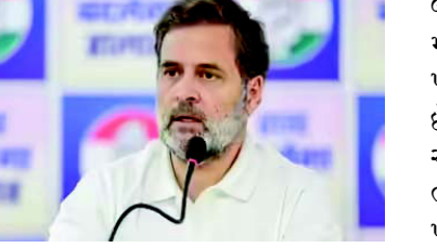
ચૂંટણી પંચ દ્વારા નાગરિકોને ગેરમાર્ગે દોરવાનું કાર્ય આપણા લોકશાહીમાં વિશ્વાસના ધોવાણનું કારણ છે. મત ચોરી એ રાષ્ટ્ર વિરોધી કૃત્ય છે. બહાનું બ્રિગેડ પાછી આવી ગઈ છે! મત ગણતરી પૂર્ણ થાય તે પહેલાં જ હાર સ્વીકારી લીધી? રાહુલ જે શ્રેષ્ઠ કરે છે તે કરવા પાછા ફર્યા છે:

મુંબઈ, બૃહમુંબઈ મ્યુનિસિપલ કોર્પોરેશન ચૂંટણી માટે ગણતરી ચાલી રહી છે. પ્રારંભિક વલણો દર્શાવે છે કે મહાયુતિ આગળ વધી રહી છે. જ્યારે ભાજપ ઉજવણી કરી રહી છે, ત્યારે કોંગ્રેસે શરૂઆતના વલણોના આધારે હાર સ્વીકારી લીધી છે. કોંગ્રેસના સાંસદ રાહુલ ગાંધીએ આરોપ લગાવ્યો કે ચૂંટણી પ્રક્રિયામાં લોકોનો વિશ્વાસ ઘટી રહ્યો છે. તેમણે ભાજપ પર મત ચોરીનો આરોપ લગાવ્યો. દરમિયાન, ભાજપે રાહુલ ગાંધીને "વારસાગત ચોર" ગણાવ્યા. રાહુલ ગાંધીએ ટ્વિટર પર પોસ્ટ કર્યું કે