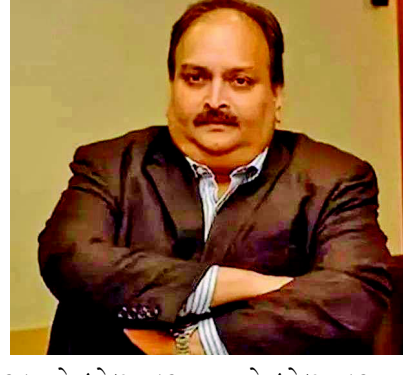
રકમને ધોળા કરવા અને ધોળા કરવા માટે કરવામાં આવતો હતો.