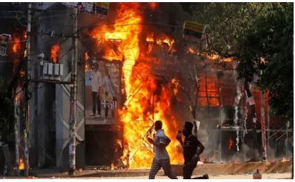
બાંગ્લાદેશમાં ઇસ્લામિક કટ્ટરપંથીઓની કૃત્યોનો એક વિડિઓ પણ સામે આવ્યો છે. વિડિઓમાં આખા ઘરમાં ઝડપથી આગ ફેલાતી દેખાઈ રહી છે. પરિવારના સભ્યો પોતાનો જીવ બચાવવા માટે ભાગી જવાનો પ્રયાસ કરી રહ્યા છે. આગથી થઈ સંપૂર્ણપણે નાશ પામ્યું હતું.