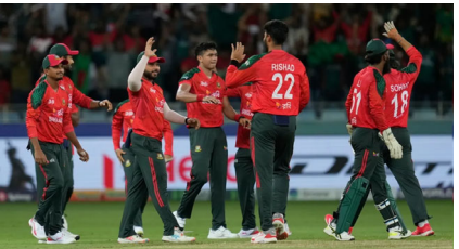
જાન્યુઆરીના રોજ મોડી રાત્રે સીડબ્લ્યુએબી દ્વારા એક મોટું નિવેદન બહાર પાડવામાં આવ્યું છે. અહેવાલ મુજબ, ૧૫ જાન્યુઆરીના રોજ મોડી રાત્રે બાંગ્લાદેશના ખેલાડીઓ બીસીબી સાથે મળ્યા પછી, સીડબ્લ્યુએબીના પ્રમુખ મોહમ્મદ મિથુન, બીસીબીના ડિરેક્ટર મોહમ્મદ મિથુન સાથે, પ્રેસ કોન્ફરન્સમાં માહિતી આપી હતી કે તેઓ ક્રિકેટના હિતોને ધ્યાનમાં રાખીને ૧૬ જાન્યુઆરીએ રમત કરી શકે છે. બીસીબીએ અમને ખાતરી આપી છે કે તેઓ ડિરેક્ટર એમ. નઝમુલ ઇસ્લામ સાથે વાત કરશે અને અમારી માંગણીઓ શક્ય તેટલી વહેલી તકે પૂર્ણ કરવામાં આવશે. બીસીબીએ નઝમુલને ફાઈનાન્સ કમિટી ચેરમેન પદેથી દૂર કર્યા છે, પરંતુ બોર્ડ દ્વારા શરૂ કરાયેલી તપાસ પૂર્ણ ન થાય ત્યાં સુધી તેઓ તેમના પદ પર રહેશે. જો નઝમુલ ઇસ્લામ કારણદર્શક નોટિસ મળ્યાના ૪૮ કલાકની અંદર જવાબ નહીં આપે, જે ૧૭ જાન્યુઆરીએ સમાપ્ત થાય છે, તો બીસીબીના બંધારણ મુજબ, આ મામલો શિસ્ત સમિતિને મોકલવામાં આવશે અને આગળની કાર્યવાહી શરૂ થશે. બાંગ્લાદેશ ક્રિકેટ બોર્ડને કરેલી પોતાની માંગણીઓમાં, સીડબ્લ્યુએબીએ સ્પષ્ટ કર્યું છે કે એમ. નઝમુલ ઇસ્લામને તેમના વિવાદાસ્પદ નિવેદનો માટે જાહેરમાં માફી માંગવી જોઈએ.

જ્યારથી બાંગ્લાદેશ ક્રિકેટ બોર્ડ આઈસીસીને ટી ૨૦ વર્લ્ડ કપ ૨૦૨૬ માટે તેની મેચો ફરીથી શેડ્યુલ કરવા વિનંતી કરી છે, ત્યારથી બીસીબીએ અનેક નિવેદનો જારી કર્યા છે. બાંગ્લાદેશ ક્રિકેટ બોર્ડ હવે પોતાના જ ઘરમાં ઘેરાયેલું દેખાય છે, જેનું સૌથી મોટું કારણ બાંગ્લાદેશ ક્રિકેટ બોર્ડના ડિરેક્ટર એમ. નઝમુલ ઇસ્લામ છે, જેમને ૧૫ જાન્યુઆરીએ બીસીબી દ્વારા તેમના વિવાદાસ્પદ નિવેદનોને કારણે કારણદર્શક નોટિસ જારી કર્યા બાદ તેમના પદ પરથી ભરતરફ કરવામાં આવ્યા હતા. ૧૫ જાન્યુઆરીએ યોજાનારી બાંગ્લાદેશ પ્રીમિયર લીગ બીપીએલ ની ચાલી રહેલી મેચો પણ બાંગ્લાદેશના ક્રિકેટરો વેલ્ફેર એસોસિએશન દ્વારા નઝમુલ પાસેથી જાહેર માફીની માંગણીને કારણે રદ કરવામાં આવી હતી. આ મામલે ૧૫